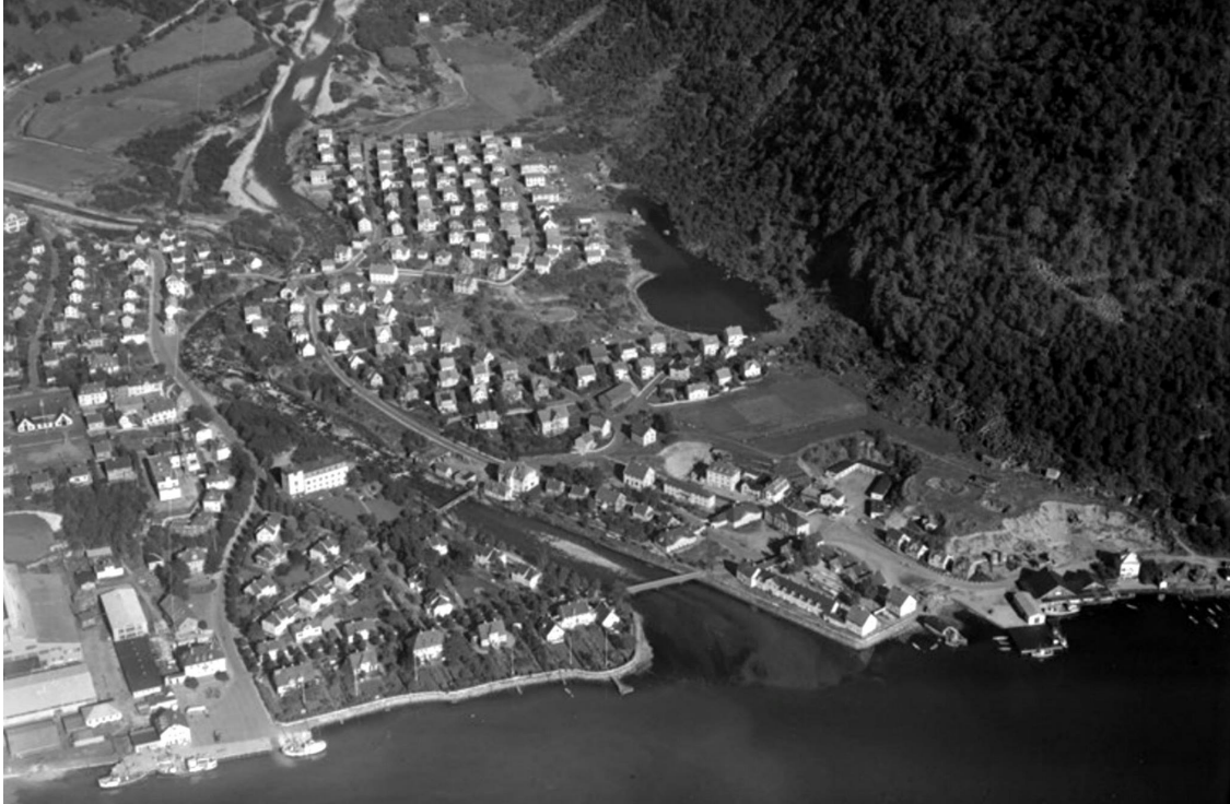
1 Flyfoto ca. 1953, Foto: Widerøe, Fylkesarkivet Sogn og Fjordane

Etter en spasertur rundt i sentrum satt jeg meg ned på Kaffetelegrafan, den ene av to kafeer. Den hadde uteservering som passet godt på en dag som dette, og den andre kafeen var uansett stengt for dagen. Det fristet med et glass vin for å feire at feltarbeidet var i gang, men det måtte bli med en Solo da de ikke hadde servering på det aktuelle tidspunktet. Da klokken nærmet seg fem ble jeg gjort oppmerksom på at de snart skulle stenge, men at jeg kunne sitte ute selv om de var stengt. Jeg spurte servitøren om det var noe annet som var åpent eller om det skulle skje noe denne lørdagskvelden, hun tenkte seg om og svarte at hun ikke visste. Jeg pakket sammen tingene mine og ruslet hjemover, og lurte hvorfor det ikke hadde vært noen andre på kafeen, og hvorfor det generelt var så lite folk å se.