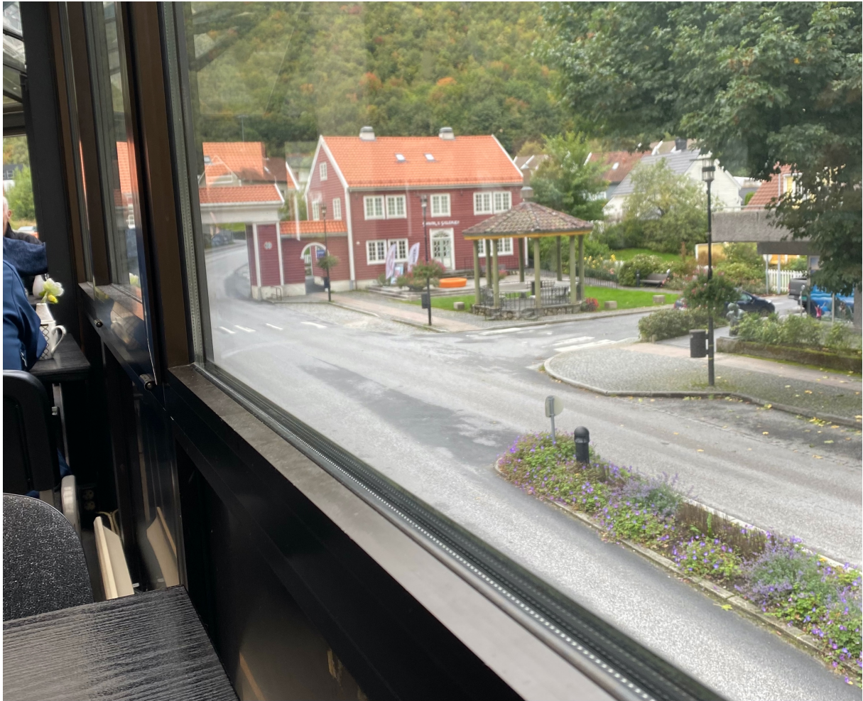
Foto: Tuva Helland, 2020. Bilde tatt ut fra glassbygget i kafeen mot byporten.

samfunnsshusplassen, og langsiden som går langs hovedgaten er det bygget ut et to meter bredt glassbygg.