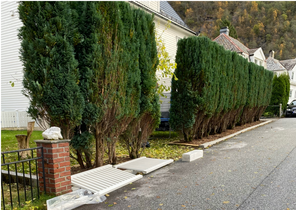
Her byttes det til plastikkjerde.