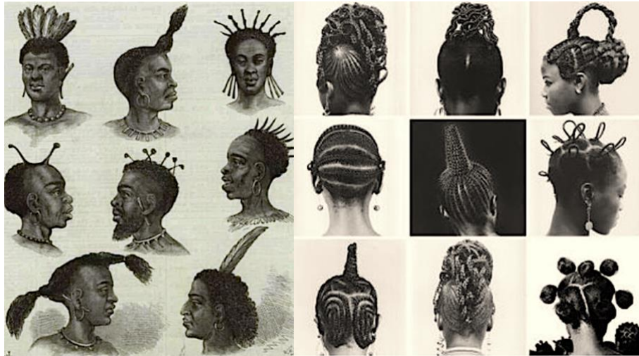
Figur 2: Eldre tradisjonelle afrikanske hårstiler for menn og kvinner

slavetiden i større grad et symbol på det arbeidet man ble tvunget til å utføre, og indikerte underkastelse til slaveherrene.