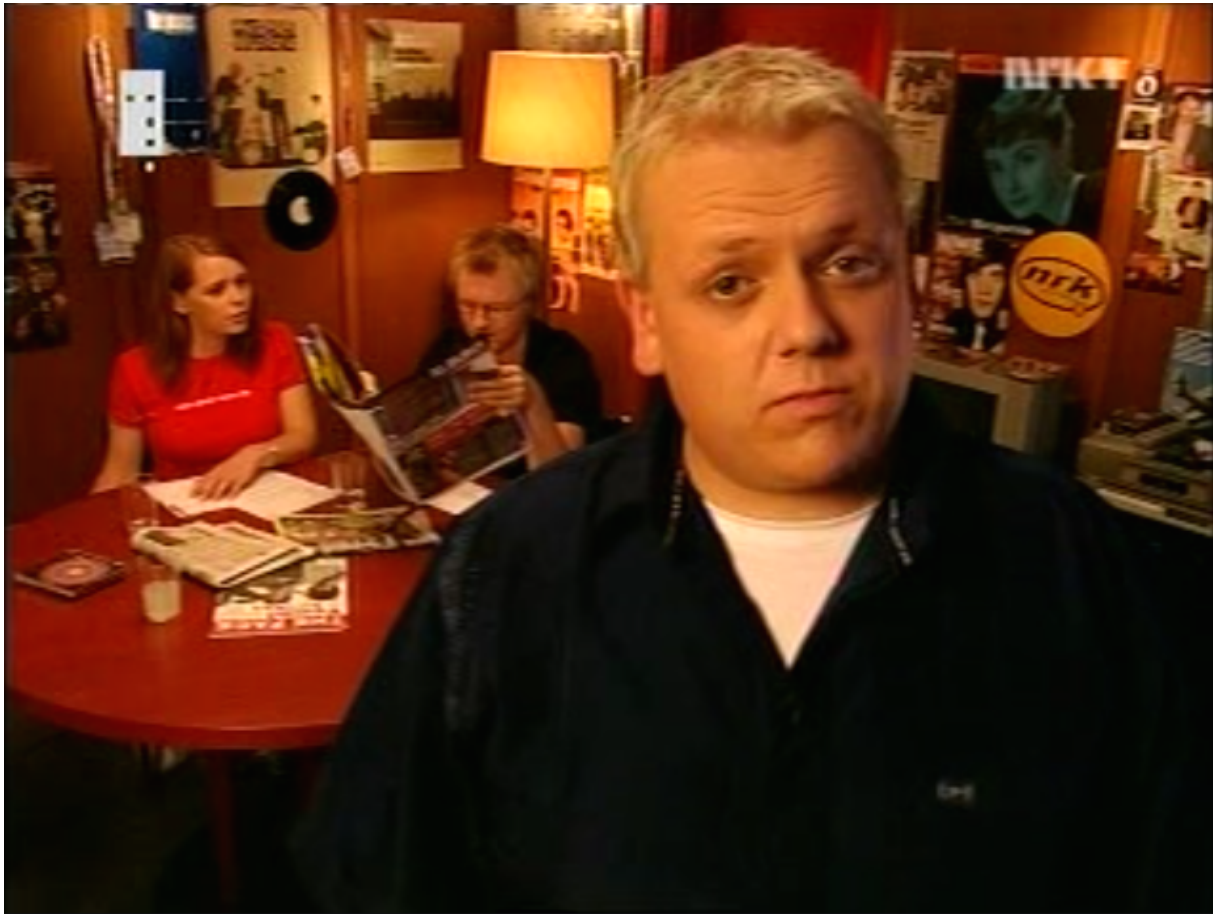
Figur 4: Lydverkets interiør i første sending Skjermdump/stillbilde fra 04.09.2002

Lydverkets kulisser beholder samme tema de første årene, men utvikler seg fra å gi inntrykk av å være en fjernsynssending på et musikkredaksjonelt kontor, til å være sendinger fra et fjernsynsstudio med elementer fra førstnevnte. Fra våren 2003 begynner platespilleren å bli et fremtredende element i kulissene, samtidig som møbler av lakkert tre og sparsommelig lyssetting går igjen. Disse grepene bidrar til å gi studio et renere og mer ryddig preg, som kan assosieres med en moderne leilighet. I sendingen fra 24.09.2004 er kulissene fortsatt relativt like med de samme fargene, romfølelsen og lyssettingen, men minner tematisk sett mer om en platebutikk (se figur 5), med vinyler oppstilt på veggen bak programleder.