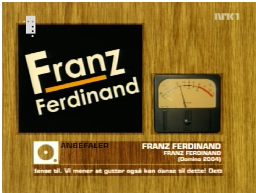
Figur 7: Lydverkets 3 anbefalinger. Skjermdump/stillbilde fra 11.02.2004