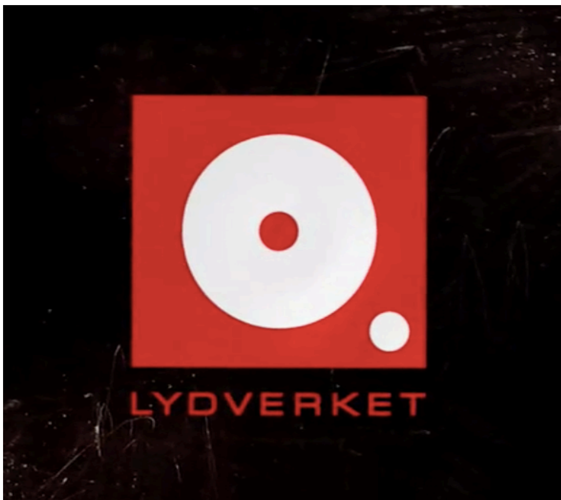
Figur 2: Lydverkets logo. Skjermdump/stillbilde fra 25.11.2010.