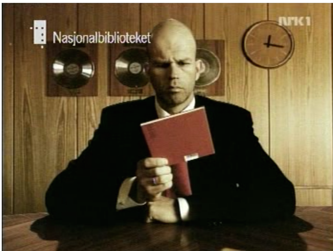
Figur 1: Vignettens ”platedirektør”. Skjermdump/stillbilde fra 04.09.2002

Musikken som akkompagnerer er synth-basert med vregte trommer. I programmet som ble sendt 14.02.2007 har vignettens musikk fått en endring produksjonsmessig, men inneholder fortsatt de samme melodiene og rytmene. Videoen er enklere med en spillende platespiller, filmet fra forskjellige vinkler med Lydverket sin logo i midten. Denne vignetten fortsetter ut 2008. Vignetten fra sendingen 11.02.2009 viser høye tårn som bygger seg opp av gitarforsterkere, og gitarer som daler ned fra himmelen mens de innhyles i flammer. Dette settes etter hvert inn i et urbant miljø og sammen med diskokuler, før vi får se de høye forsterkertårnene på en scene sammen med mange konsertlys. Den gitarbaserte kjenningsmelodien slutter sammen med et bilde av Lydverkets karakteriske platespillerlogo (se figur 2).