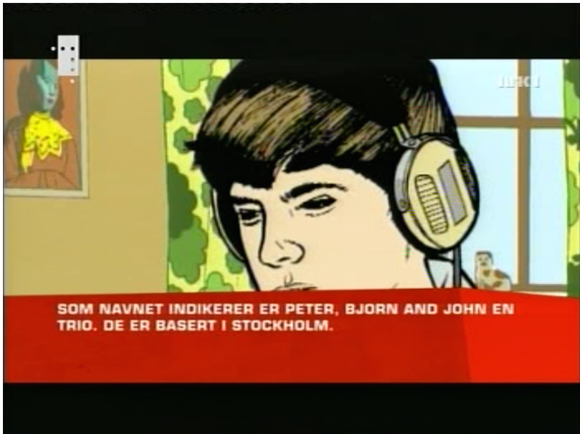
Figur 7: Bonussporet. Skjermdump/stillbilde fra 27.09.2006

Lydverket går, med ukens anmeldelser , i 2007 over til å vurdere musikk som god eller dårlig ved å presentere oppsummeringer av grunngivelsen, samt “terningkastet” fra anmeldelser på nett. Spalten er også merkbart kortere enn sine forgjengere. I sendingen som ble sendt 16.05.2007 presenterer Lydverket anmeldelser av nye album fra Superfamily, Linkin Park og Rufus Wainwright. I presentasjonen av hver anmeldelse spilles det av et kort musikklipp fra platen mens tallkarakteren, utdrag fra anmeldelsen på nett og navnet på anmelderen vises på skjermen (se figur 9). Tallkarakteren er imidlertid et større blikkfang på skjermen enn teksten. Ukens anmeldelser presenteres på 1 minutt og 15 sekunder.