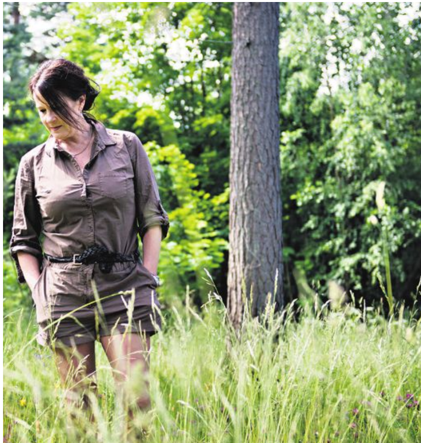
og ender i en historie om misbruk og fortellser.