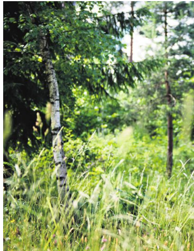
ROMAN OM OVERGREP: Vigdis Hjorths nye roman starter med et arveoppgjør

Det egentlige temaet sirkles langsom inn. Hint om fyll og brutalitet, minner om moren med et blått øye, et brukket ben. Og kjernen altså. Farens forhold til sin eldste datter, Hans skam, hennes ulykke, begge «alene med sin uhandterlige bagasje». Hvor og i hvilken utstrekning misbruket skjedde trer fram i antydninger, i plutselige og overraskende bilder, sjokkerende utbrudd. «Min