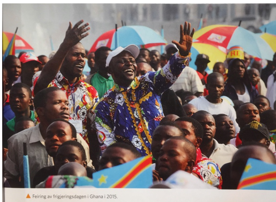
Figur 7 Døme på ei positiv framstilling av ikkje-europearar (Ingvaldsen og Krisentensen, Nye makt og menneske : Historie 10, 103)

I kapittelet «Avkolonisering og maktkamp» konsentrerer Nye makt og menneske seg om kva som skjedde i eit utval tidlegare koloniar i tida etter frigjeringsa. Sentrale aktørar i forteljinga er innbyggjarar i dei landa. Det er få kontaktpunkt mellom europearar og ikkje-europearar, og slik liknar tilnærminga den i Undervegs . Tidlegare koloniar vert likevel framstilt på ein heilt annan måte enn i Undervegs . Nye makt og menneske skapar eit bilete av andre kulturar som sjølvstendige og aktive aktørar og gir slik ei meir positiv framstilling. Gjennom mellom anna fargerike bilete og fleire smilande menneske bidrar illustrasjonane til å gi eit meir optimistisk og variert syn på andre kulturar, noko som legg opp til ei anna forståinga av kultur møter. Nye makt og menneske gir noko plass til den konkrete gjennomføringa av avkoloniseringa, særleg i Afrika, og i avslutninga på forteljinga kjem kultur møter inn som ein mogleg veg framover i form av moderne bistand.