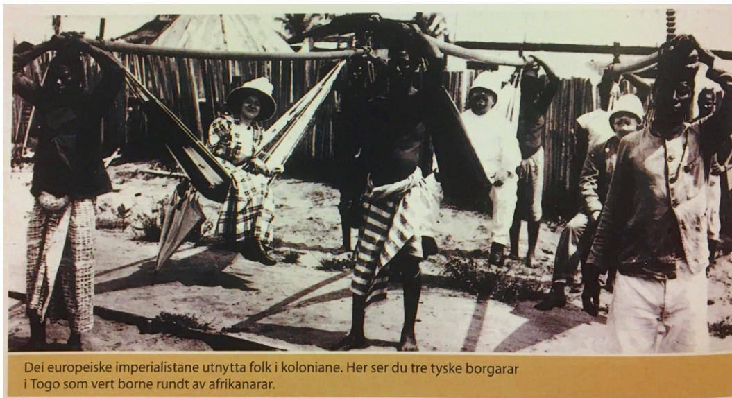
Figur 5 Døme på bilete av utydelege afrikanarar (Nomedal og Bråthen, Kosmos 9 : samfunnsfag for ungdomstrinnet , 116)

Kosmos forklarar at imperialisme framleis finst i dag, og forklarar skilnaden på militær, økonomisk og kulturell imperialisme. Slik viser boka kontinuitet fram til dagens samfunn: