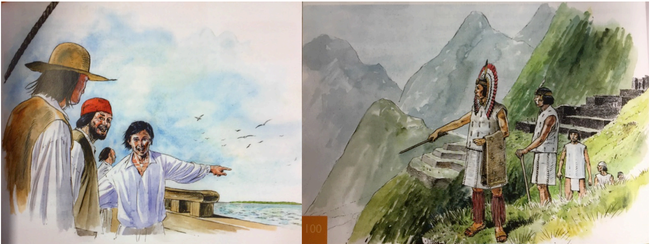
Figur 3 Døme på oppdagarar. (Libæk, Globus 7 : Samfunnsfag , 93) Figur 4 Døme på inkaer. (Libæk, Globus 7 : Samfunnsfag , 100)

Bøkene gir sjølvstendig plass til skildringar av inkaene og aztekarane, men mykje av framstillinga av indianarar skjer også i kontakt med europearar. Bøkene har døme på at både indianarar og europearar beundra kvarandre. Globus skriv til dømes om aztekaranes hovudstad: «Folk som besøkte byen sa at han såg ut som ein flytande, blomstrande oase!» 140 Det var også samarbeid mellom spanjolar og «andre indianerstammer» i felles kamp mot aztekarar eller inkaer. Midgard har også ei teikning som illustrerer samarbeidet, biletteksta lyd: «(...) Den viser også at andre indianerstammer gikk sammen med spanjolene for å bli kvitt de aztekiske herskerne.» 141 I Globus vert det peika på at samarbeid mellom urfolk og europearar ved eit tilfelle var avgjerande for konkvistadorane: «Men sjølv om spaniarane hadde betre våpen enn aztekarane, var ikkje dette nok til at Cortez fekk overtaket. Han fekk nemleg støtte frå fleire indianerstammer som lenge hadde blitt undertrykte av aztekarane.» 142 Gaia skildrar liknande samarbeid mot inkaene: «Med berre nokre hundre mann klarte Pizarro å leggje dette enorme riket under seg. Ei årsak kan vere ein blodig borgarkrig i inkariket. Dessutan fekk Pizarro hjelp av undertrykte stammer.» 143 Sjølv om desse gruppene ikkje får ein like tydeleg plass som inkaer og aztekarar viser det moglegheiter for samarbeid i kulturmøta. Samarbeid vitnar om likeverdige partar fordi det tyder at begge grupper kan bidra.