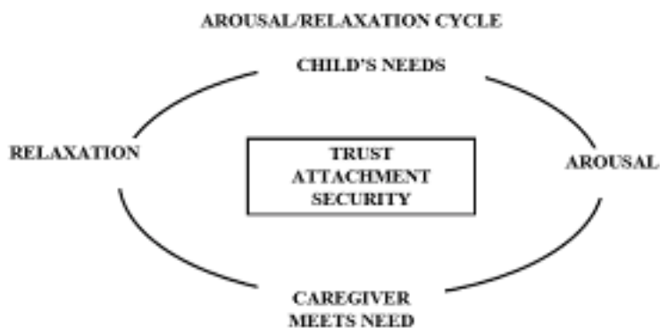
Figur 1. The Arousal-relaxation cycle (Fhalberg 1994, i Daniel, Wassel & Gilligan, 2010, s.24)

Barnets mål i sine nære relasjoner med sine nærmeste omsorgspersoner er å oppnå en følelse av trygghet, og vissheten om å være beskyttet. Dette er et slags system i barnet fra fødsel av, attachment system eller tilknytningssystem , og henger sammen med barnets tilknytningsatferd. Barnet utvikler fra spedbarnsalderen et nærhetsfremmende atferdsmønster som kan innebære vokalisering, smil eller å strekke seg etter omsorgspersonen. Denne tilknytningsatferden kan gjøre at omsorgspersonen viser barnet positiv oppmerksomhet, mens uttrykk i form av gråt viser at barnet trenger trøst og hjelp til å regulere seg. Sagt på en annen måte aktiverer barnets tilknytningsatferd tilknytningspersonens omsorgssystem. Figuren nedenfor viser en vellykket interaksjon mellom en omsorgsperson og et barn initiert av barnet (Daniel, Wassel, & Gilligan, 2010, s. 24)