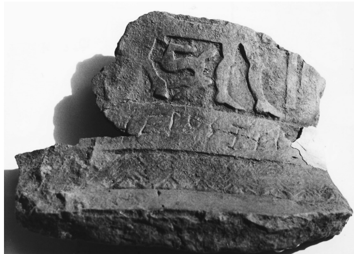
Εικόνα 1α: ΜΕ 18687: Λεπτομέρεια του ανάγλυφου πίθου, στον οποίο διακρίνεται η επιγραφή ιερός .