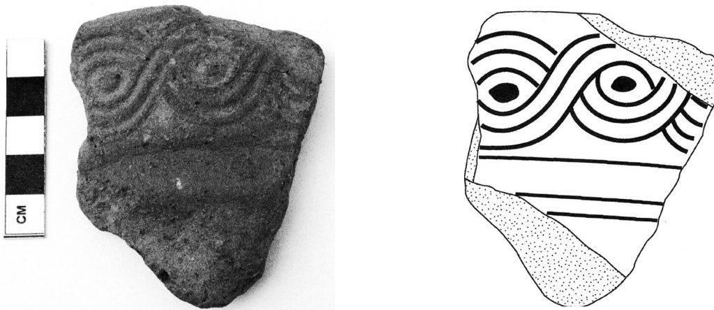
Εικόνα 4-Σχέδιο 3 (A3): ΜΕ 18808: Θραύσμα από χείλος ανάγλυφου πίθου, διακοσμημένο με ζώνη απλού πλοχμού.