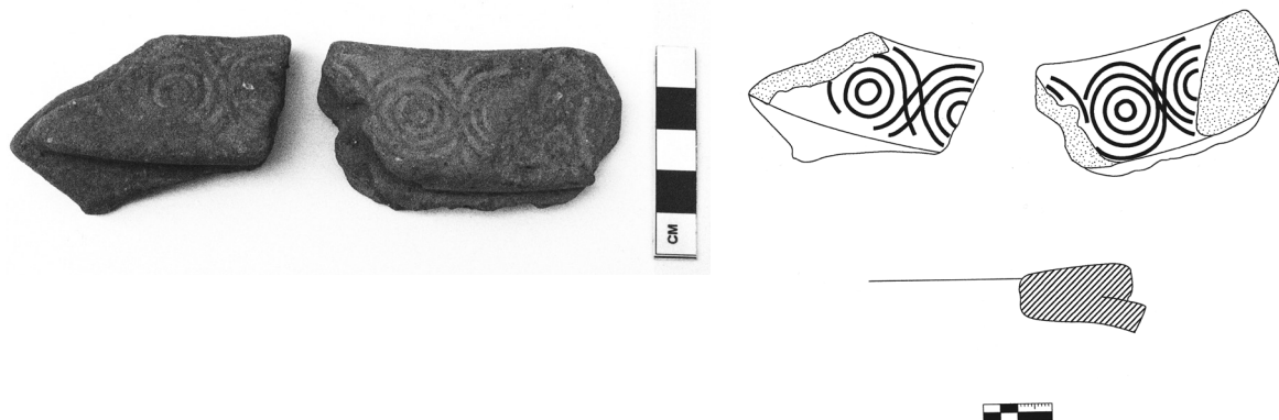
Εικόνα 5-Σχέδιο 4 (A4): ΜΕ 18858+18883: Θραύσματα από χείλος αγγείου, διακοσμημένα με το μοτίβο των ομόκεντρων κύκλων.