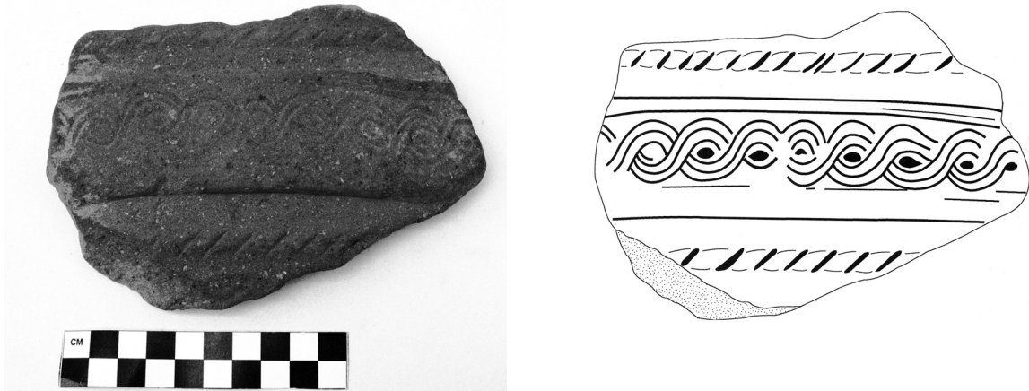
Εικόνα 3-Σχέδιο 2 (A2): ΜΕ 18806: Θραύσμα ανάγλυφου πίθου, διακοσμημένο με ζώνη απλού πλοχμού και σχοινοειδές κόσμημα.