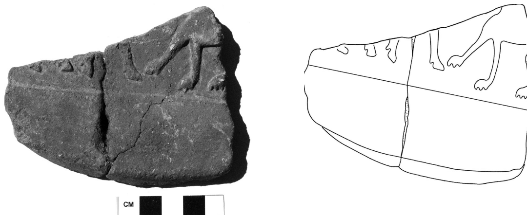
Εικόνα 6-Σχέδιο 5 (A5): ΜΕ 18923: Θραύσμα από πήλινη κυκλωτήρη πλάκα με ανάγλυφη παράσταση δύο αντιμέτωπων ζώων.