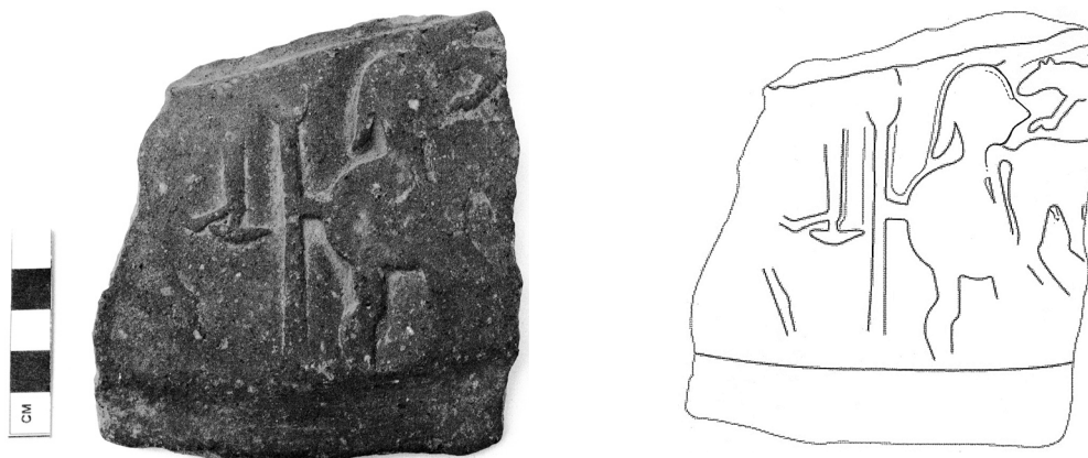
Εικόνα 7-Σχέδιο 6 (A6): ΜΕ 18871: Θραύσμα αγγείου με ανάγλυφη παράσταση πολεμιστή.