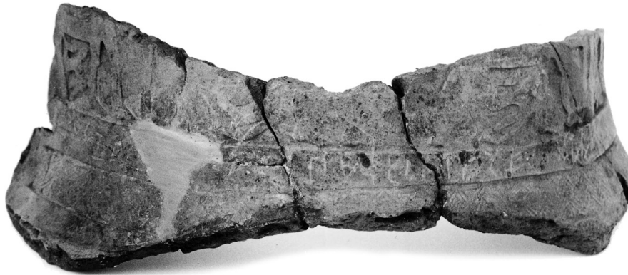
Εικόνα 1: ΜΕ 18687: Θραύσμα ανάγλυφου ενεπίγραφου πίθου με παράσταση Κενταύρων.