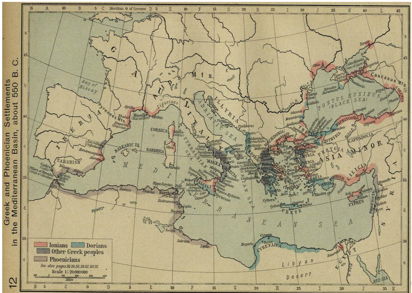
Kart som viser spredningen av de greske kolonibyene.

Det ble dannet tidlige, og sene bosetninger av grekerne rundt middelhavet, selv under det romerske hegemoni. De fleste slike i dagens Italia var tidlige bosetninger, av naturlige