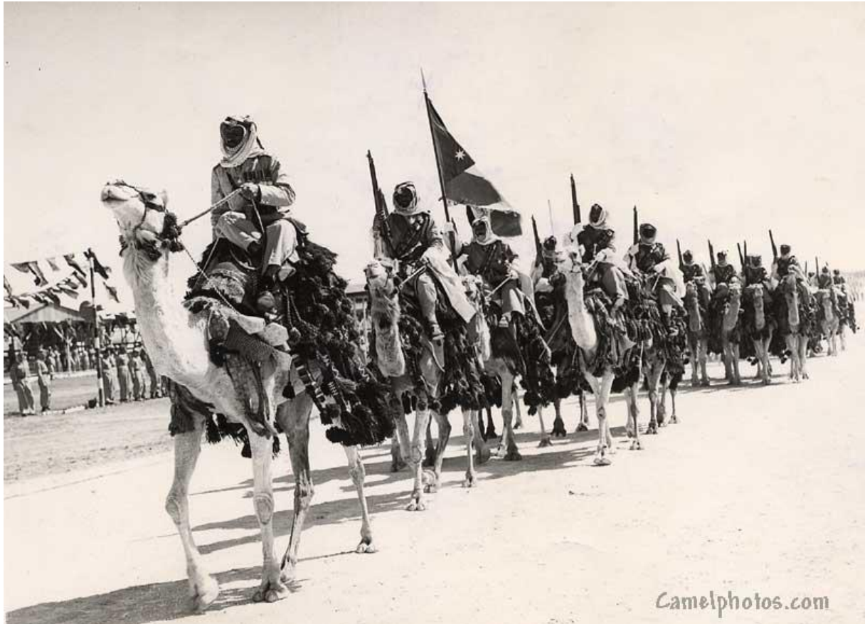
Ørkenpatruljen rir ut fra en beduinleir. 82

John Glubb ankom Transjordan i november 1930 med rykte som ”beduineksperter” og som mannen som stoppet Saudi-Arabias Ikhwan fra å fortsette raidene inn i Irak. John Glubb ble født i Preston i Lancashire den 16. April 1897. Han kom fra en militær familie, og selv ble han uteksaminert fra det britiske militærakademiet Sandhurst i 1915 som offiser i ingeniørvåpenet. Han kjempet i skyttergravene på vestfronten i første verdenskrig og ble både høyt dekorert og alvorlig skadet. Senere i livet skulle han få kallenavnet ”Abu Hunaik” av beduinene han jobbet sammen med. Abu Hunaik betyr ”liten kjeve” og kom av at Glubb fikk deler av underkjeven skutt vekk ved Arras på vestfronten i 1917. 83