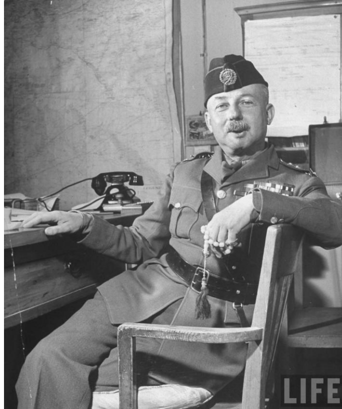
Glubb som hærsjef i 1948 137

I 1933 var problemet med raid og motraid i ørkenen og over grensene til nabolandene over. Det siste raidet over grensene som er registrert, var i 1932. 138 Etter det ble forholdet mellom Transjordan og nabolandene Syria og Saudi-Arabia bedre, om enn fremdeles kjølig og distansert. Å stoppe raidene var bare halve jobben. Vel så viktig var det å få stammene til å begynne å betale skatt, sikre deres lojalitet og stabilisere ørkenen uten at det ville kreve store troppestyrker og store mengder penger. Det ble derfor viktig å gjøre stammene avhengig av statlig velvilje og sikre deres lojalitet til den.