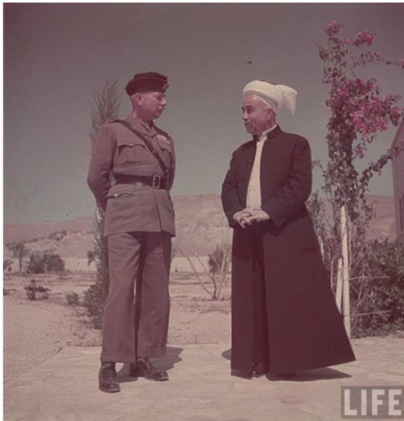
Emir Abdullah og John Glubb i 1940-årene 5

Antallet personer i denne teksten er stort, og det kan være vanskelig å skille de forskjellige aktørene fra hverandre. De vil bli presentert etter hvert som de dukker opp i selve teksten, men jeg gir her en oversikt.