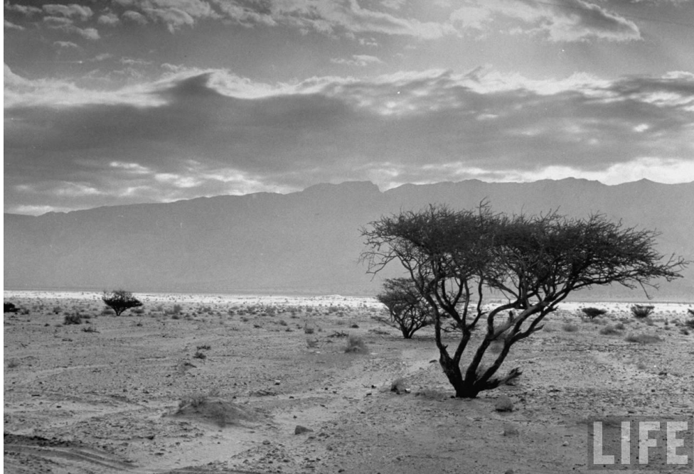
Ørkenområde i Transjordan ca 1949 8

Dagens Jordan er med unntak av mindre grensejusteringer, det samme området som emiratet Transjordan opprettet i 1921. Grensen til Jordan ble justert i 1925 og 1965, hovedsakelig i sør og øst mot Saudi-Arabia. Landet er rundt 380 kilometer fra nord til sør og 330 kilometer på det bredeste. Ca 900 kilometer av grensen til Transjordan gikk på midten av 1930-tallet ute i ørkenen. I dag er tallet noe annerledes på grunn av kultivering og de tidligere nevnte justeringene av grensene. Klimaet er tørt og varmt, med de våteste månedene mellom november og mars. Landet har per i dag et flateareal på 89 342 km 2 , og før andre verdenskrig ble det anslått at bare omtrent 5 % av dette var fruktbart land. Dette er hovedsakelig Jordandalen som går langs Jordanelven fra grensen i nord til Dødehavet i sør. 9