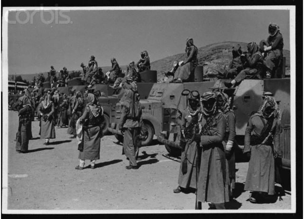
Beduinsoldater med panserbiler klare til kamp under andre verdenskrig 171

I 1939 overtok Glubb kommandoen over Den arabiske legion etter oberst Frederick Peake. Like etter brøt andre verdenskrig ut, og emir Abdullah erklærte straks sin uforbeholdne støtte til Storbritannia. Som i så mange andre land, førte verdenskrigen til at de siste effektene av depresjonen på tredvetallet forsvant. Legionen ble utvidet betraktelig og ble i løpet av krigen forvandlet til en moderne hær med stridsvogner og mekanisert infanteri. Glubb fortsatte sin politikk med å rekruttere beduiner. Støttetropper, forsyningsenheter og teknisk personell ble rekruttert blant andre deler av folket, men kamptroppene ble nesten utelukkende rekruttert fra beduinstammene. Dette er en politikk som har blitt ført helt opp til i dag, og som hadde til hensikt å sikre at de mest kapable styrkene også var de som var mest lojale til emiren.