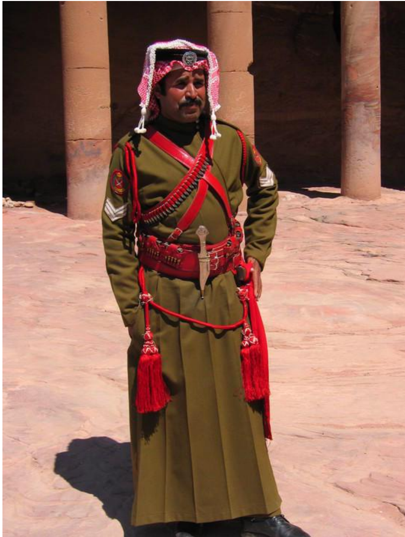
Sersjant i Ørkenpatruljens paradeuniform 113

kvalitet. Dette var med på å øke statusen til soldatene i Ørkenpatruljen og å gjøre denne karriereveien mer attraktiv for potensielle rekrutter. 112