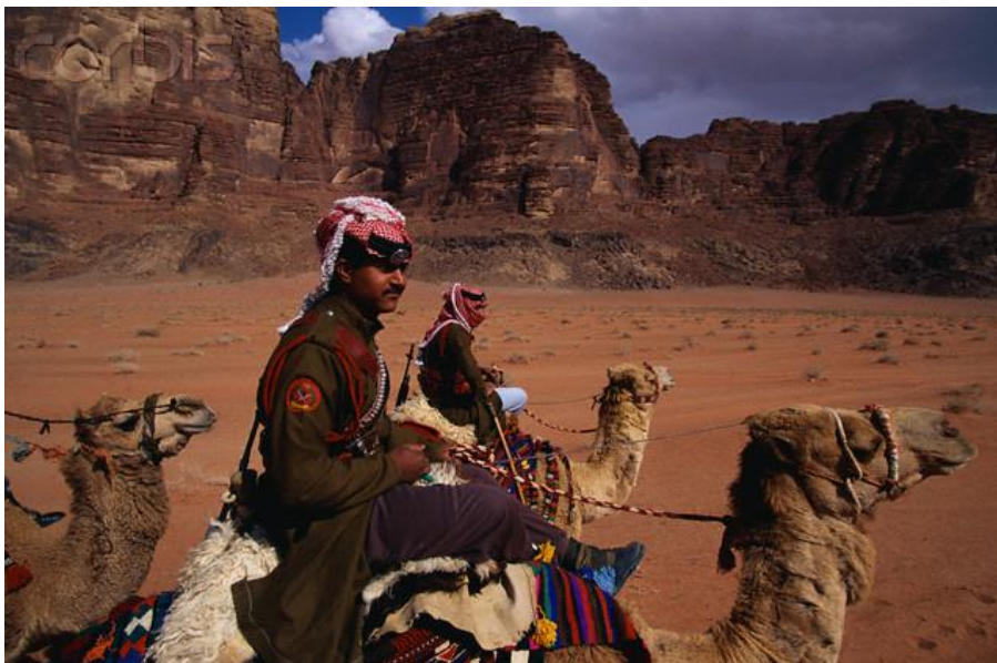
Soldater fra Ørkenpatruljen på patrulje. Privat foto (2006)

Glubb begynte naturlig nok med å prøve å rekruttere menn til sin nye styrke. I motsetning til Peake sin politikk om ikke å rekruttere beduiner overhodet gikk Glubb inn for å rekruttere kun beduiner. Som tidligere nevnt, var Peake og flere med ham, imot å bruke beduiner som soldater fordi de mente at beduiner var for udisiplinerte og illojale av natur til å kunne bli gode soldater og at de ville desertere ved første anledning sammen med penger, våpen og utrustning. Glubb med sin erfaring fra det sørlige Irak, mente tvert imot at beduiner var naturlig gode soldater og at de utgjorde et bedre råmateriale enn fellahinsoldatene til Peake. Selv om beduinsoldater kunne tenkes å være mer lojale til sin stamme enn sin nye arbeidsgiver, ville dette oppveies av deres naturlige kjennskap til ørkenens samfunn og kultur og dermed være bedre i stand til å sloss og overleve der. Et eventuelt lojalitetsproblem kunne overvinnnes gjennom trening, bygging av en god korpsånd og sørge for at æren og stoltheten til den enkelte soldat var knyttet til Ørkenpatruljen og dens suksess.