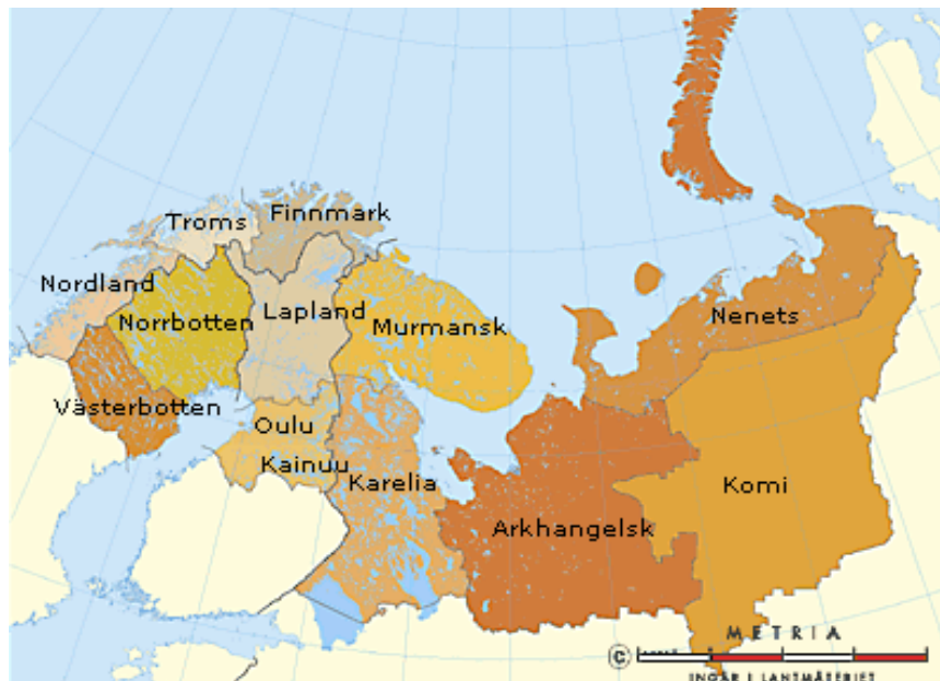
Figur 1 - «Regionane som deltek i Barentssamarbeidet»