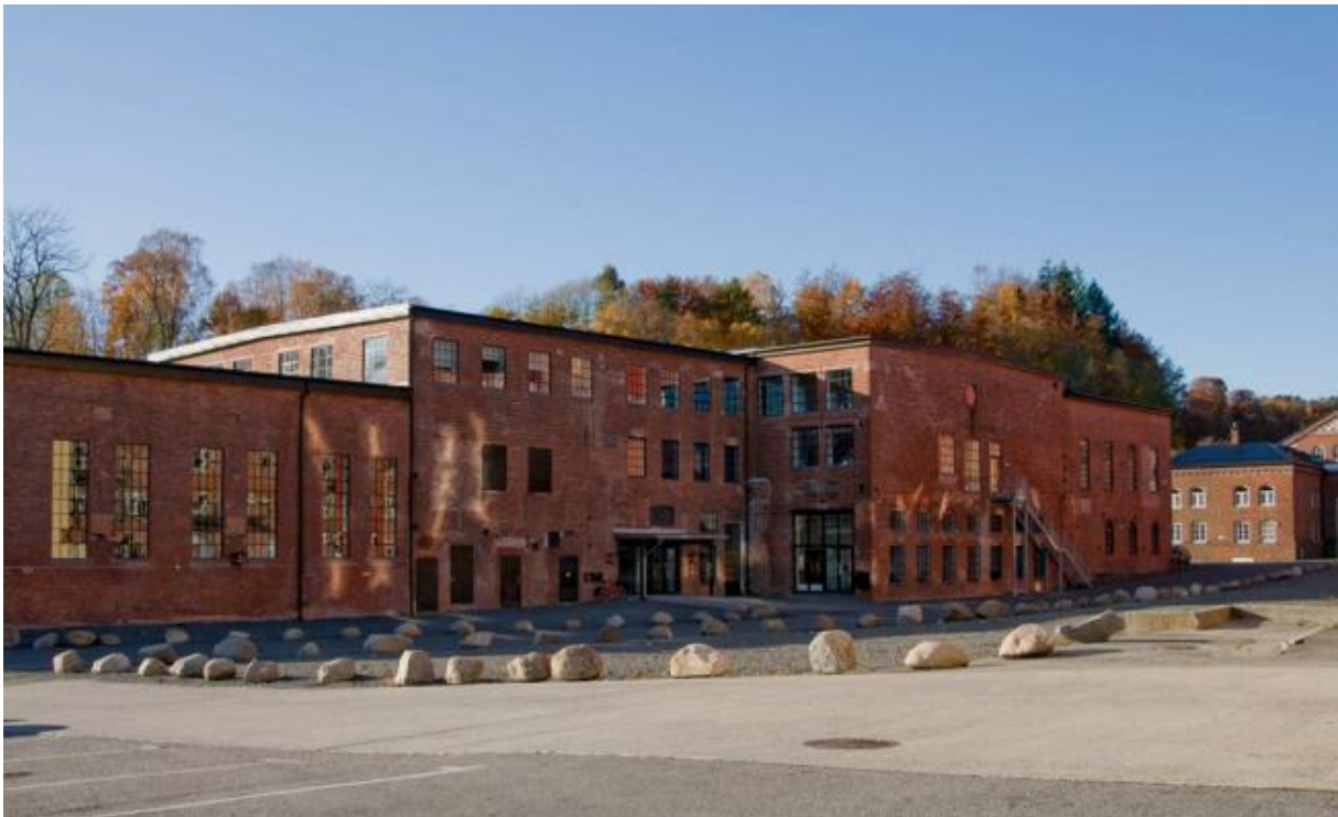
Figur 4 Sliperiet. Larvik kulturskole og Larvik Ballettskole har virksomhetene sine her i dag.

I den endelige rapporten omtales VSP Hammerdalen som et byutviklingsprosjekt som skal ta vare på og bruke den materielle og den immaterielle kulturarven. Samtidig er det også et stedsutviklingsprosjekt som satser på en bærekraftig utvikling innen næring og kultur. 290 Et byutviklingsprosjekt kan i denne sammenhengen forstås som et bevaringsprosjekt. Ved at de gamle industrilokalene blir satt i stand og nye aktiviteter flytter inn, er dette en form for vern gjennom bruk. Dette er også et av utgangspunktene for den statlige kulturminnepolitikken. 291