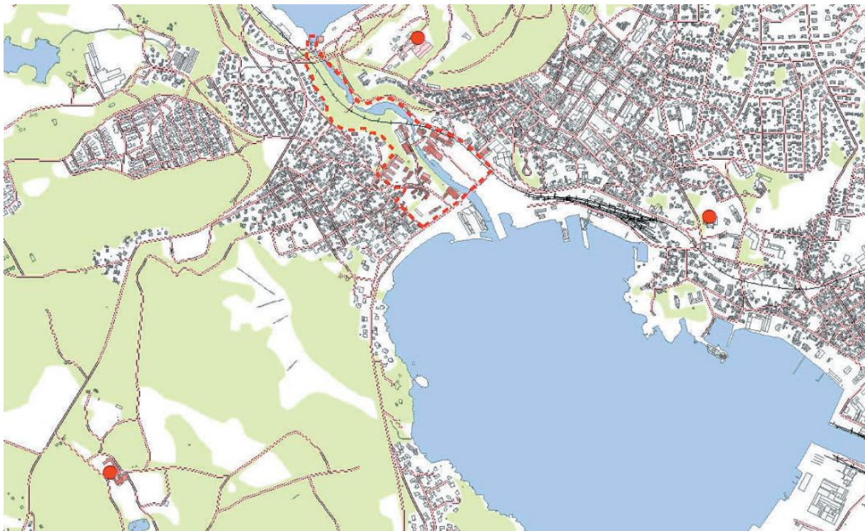
Figur 3 Kart over Larvik sentrum. Kjerneområdet for verdiskapingsprosjektet er avgrensa med stipla linje. Kilde: VSP Hammerdalen 270

I utgangspunktet var Hammerdalen et konsentrert område langs vestsiden av Farriselva som fikk navnet etter lyden av hamrene fra jernverket. Området som i dag kalles Hammerdalen inkluderer også anleggene for trelastindustri og mølledrift på østsiden av elva. 269