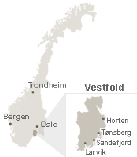
Figur 1 Hvor er Vestfold?

Sandefjord byen med flest innbyggere, ca. 43 600. Larvik kommer derimot rett under med et innbyggertall på ca. 42 600. 64 Byene ligger langs kysten og er populære hytte- og ferieområder. De inngår også i et stort sett sammenhengende bybelte som går fra Holmestrand nord for Horten i Vestfold, til Porsgrunn og Skien i Grenlandsområdet i Telemark.