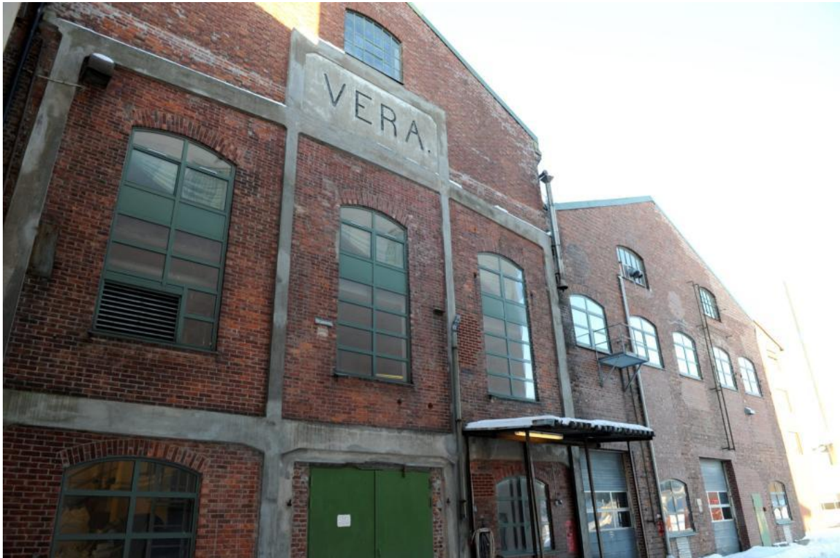
Figur 5 Bygning E (til høyre) og F (til venstre).

Jotun sendte i juni 2010 en søknad om riving av bygning E og F samt fjerning av to deponier. Årsakene til ønsket om riving var at bygningene er i dårlig forfatning og standard. Bygningene har i følge Jotun høye driftskostnader som til tider overgår inntektene og egner seg ikke til utleie eller nytte. 305