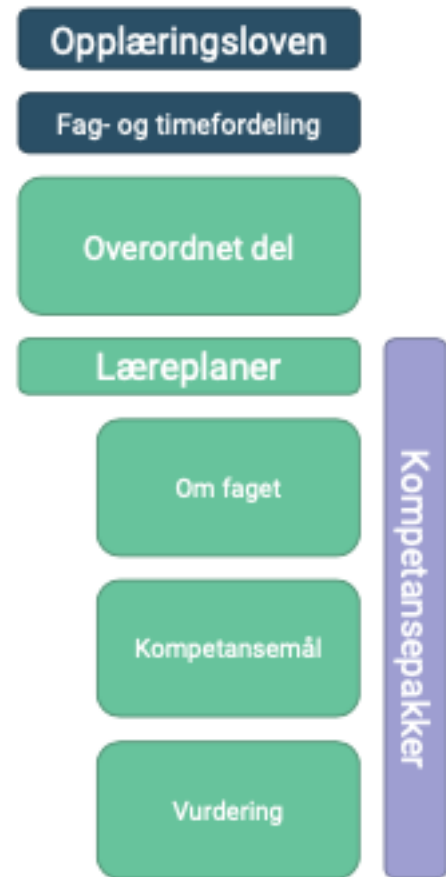
Figur 1: Presentasjon av den nye strukturen til læreplanane (Udir, 2019)

Med tanke på relevansen for denne undersøkingas tema, vil eg i hovudsak prioritere korleis demokrati og medborgarskap vert framstilt i overordna del, og kort forklare temaet i samanheng med opplæringslova og konkrete læreplanar. Opplæringslova på si side inneheld det formaliserte lovverket som skulane er pålagde å følgje. Lova inneheld blant anna formålet med opplæringa, og konkretiserer at skulen skal byggje på demokratiske verdiar i samsvar med kristen og humanistisk tradisjon. Verdiane er overordna demokratiske og formulerer det offisielle samfunnsmandatet til skulen. Lova kan oppleve endringar i formuleringar og nye tilskot, men står relativt stabilt forankra i lovverket. Det vil ikkje vere hensiktsmessig for oppgåvas omfang å gå nærmare i detalj på lova, men vurdert som relevant å konstatere at opplæringslova er den overordna, lovpålagde delen av læreplanane. Med grunnleggande demokratiske verdiar, legg den rammeverket for formuleringa av overordna del og læreplanane. Oppgåva vil heller ikkje vie mykje plass til konkrete læreplanmål, men det er verdt å nemne at dei vert konstruerte i samsvar med overordna del.