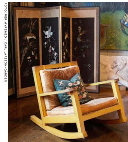
FIG. 2.3 Karins gungstol i ateljén på Lilla Hytttä, Sundborn.