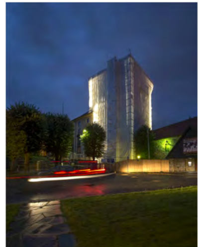
Fig. 3 | Rundt museets tårn var det satt opp stillas dekket med presenning.