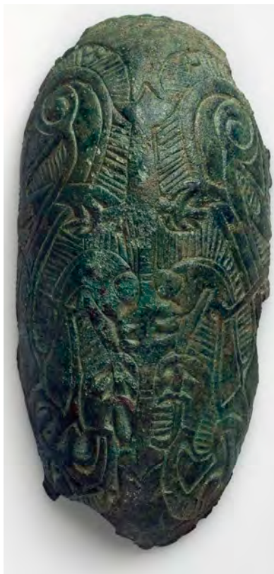
Fig. 6 | Den eldste typen skålformet spenne er fortsatt savnet.