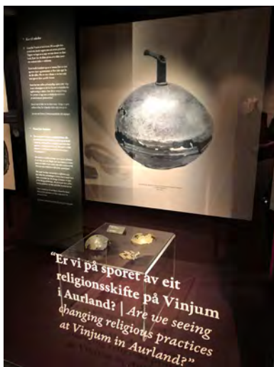
Fig. 11 | Karet fra Vinjum er nå knust, og store deler av det mangler. Kanskje får vi aldri vite hva dette karet egentlig ble brukt til.