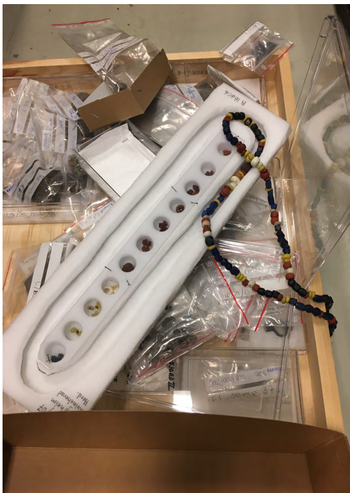
Fig. 4 | Gjenstandene i magasinet lå i sterk uorden etter tyvenes herjinger.