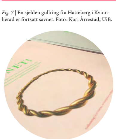
Fig. 7 | En sjelden gullring fra Hatteberg i Kvinnherad er fortsatt savnet.

tusen år i jorden gjerne rustet, irret eller brukket. Når man likevel ser godt etter og kjenner til hvordan de så ut en gang, blir de langt mer betydningsfulle. Vi antok at gjennom kunnskap om utseende og historisk betydning ville publikum få mer kunnskap og bli motivert til å hjelpe oss med å forhindre ødeleggelse, eksport eller videresalg.