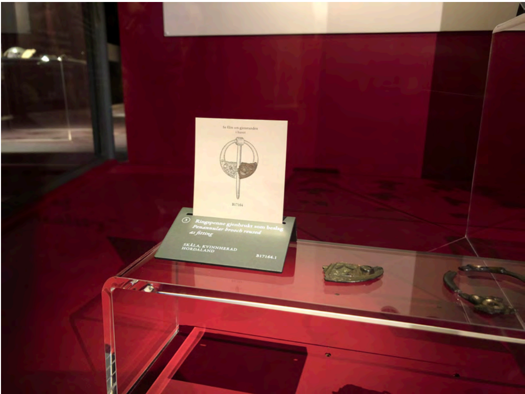
Fig. 9 | En liten del av det som en gang var en flott ringspenne, funnet i Kvinnherad. Den ble laget på og senere stjålet fra Irland på 800-tallet. Da spennen ble ødelagt, ble denne delen gjenbrukt som beslag. Den lille biten har en lang og spennende historie, som vi forteller i en animasjon i utstillingen.

Etter at omfanget er dokumentert, skal gjenstandene først og fremst stabiliseres slik at bevaringstilstanden ikke forverres. Dette innebærer for eksempel å sikre deler som er i ferd med å løsne, eller å fjerne aktiv korrosjon som følge av overfladiske skader. Dersom det lar seg gjøre, vil vi i neste omgang lime deler som er brutt av. De mest synlige og alvorlige skadene, som deformering eller merker fra filing og saging, kan ikke tilbakeføres til opprinnelig form. Sporene kommer til å være synlige i all fremtid og slik bli en del av gjenstandens historie.