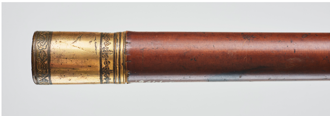
Fig. 4 | Stokkens knapp og messingbåndet gravert med border i Louis XVI-stil i overgang fra rokokko-stil.