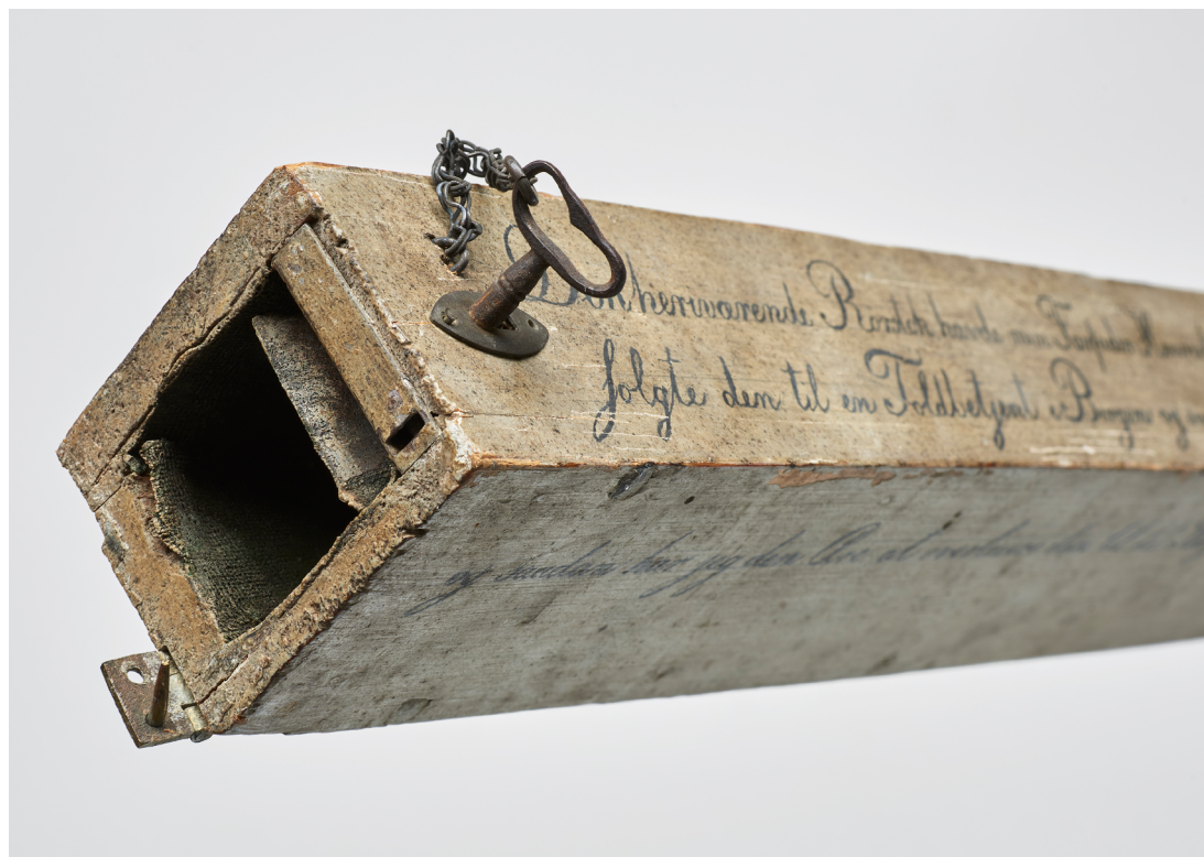
Fig. 1 | Utsnitt av gavebrevet fra Margrethe Jordan.

Christie og hans medstiftere må ha gjort et iherdig arbeid med å reklamere for det nyopprettede museet og behovet for donasjoner, for gavene strømmet inn og ble nøye protokoll-