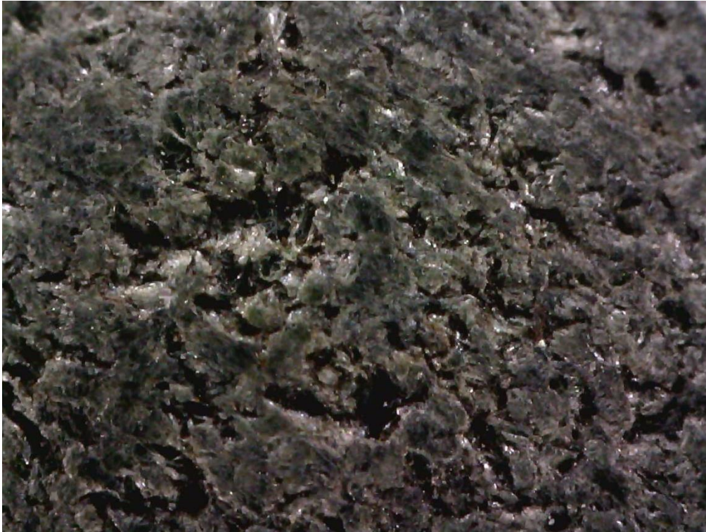
Figur 1: Spinnehjul i serpentinit BRM 1/63/3115/3, 100x forstørrelse. KEE 2022.

Mikroskopbilder av råmaterialets krystallstruktur, spinnehjul i stein fra Borgund