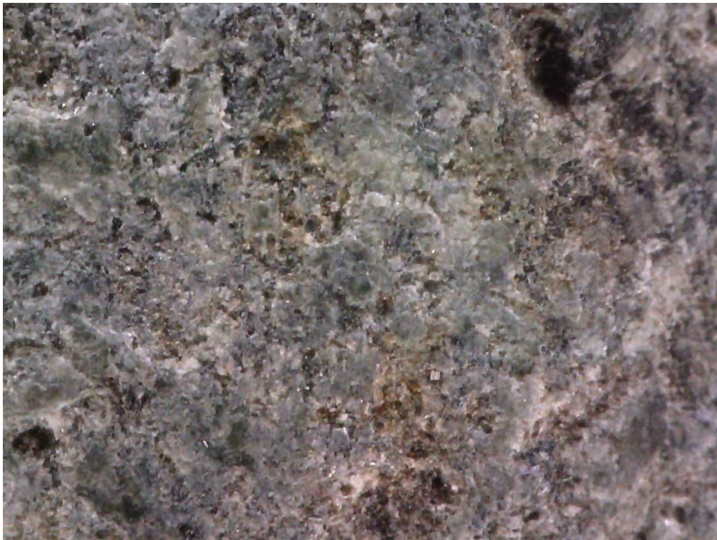
Figur 5: Spinnehjul i kleberstein med annet opphav, BRM 1/6136/1, 100x forstørrelse. KEE 2022.