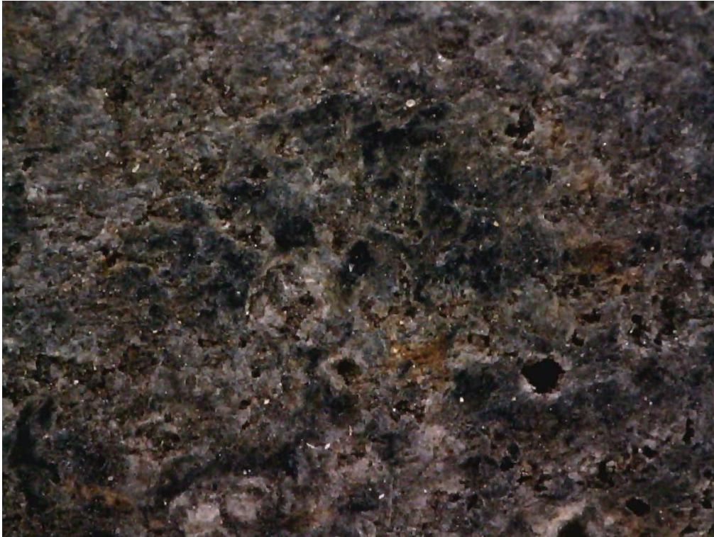
Figur 3: Spinnehjul i kleberstein med lignende mønster som spinnehjulene i serpentinit, BRM 1/54/25/1, 100x forstørrelse. KEE 2022.