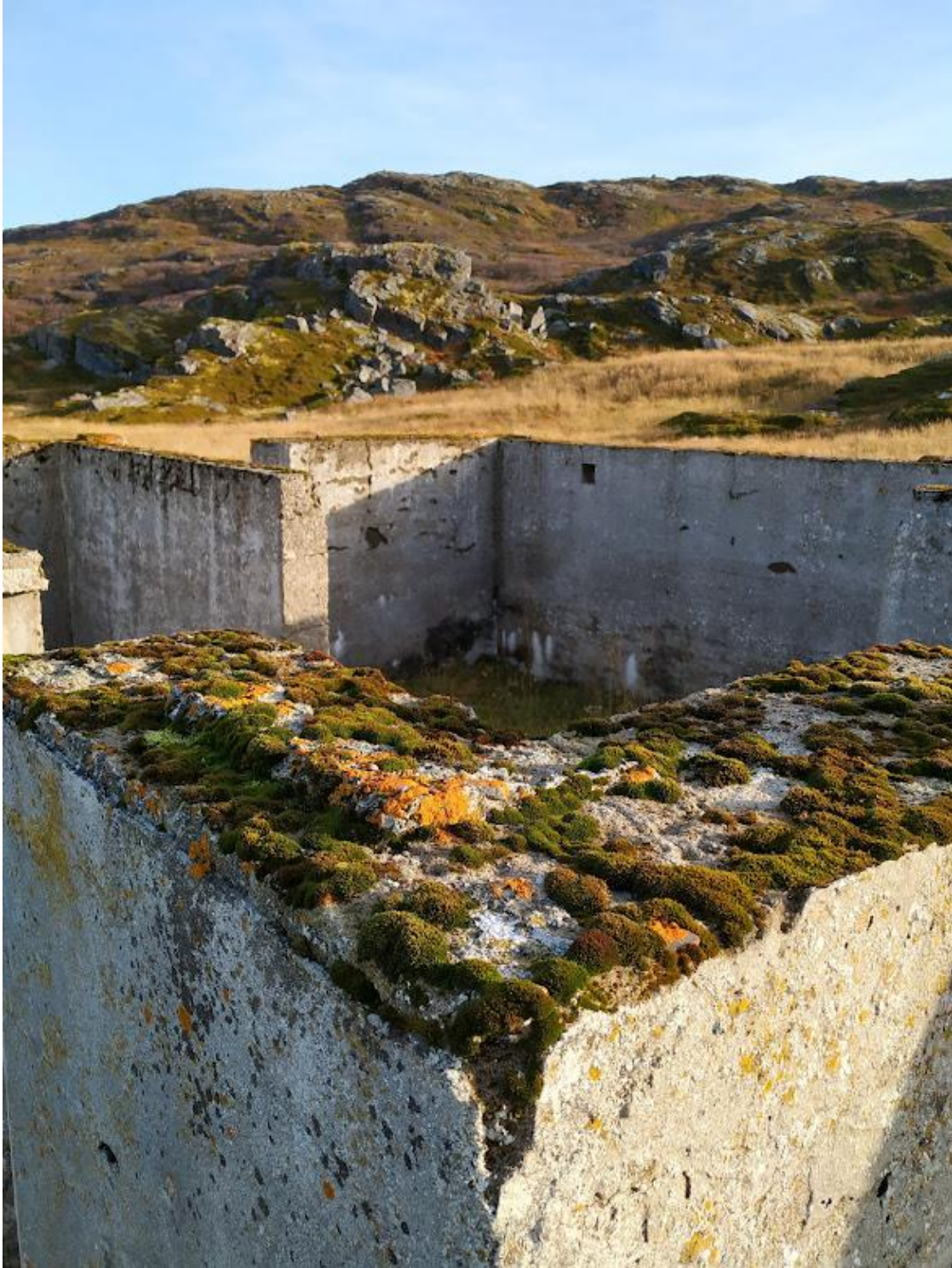
Figur 8: Et bilde av en mur på et gjenreist og fraflytta sted.