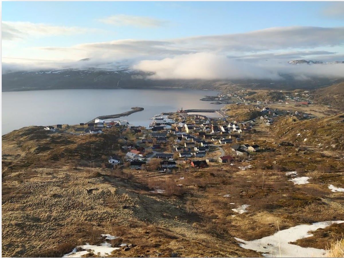
Figur 5: Et bilde av Breivikbotn tatt fra Kollaren, en liten fjelltopp i bygda.