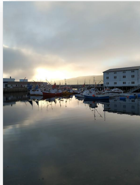
Figur 4: Et bilde tatt i nyere tid av bygget som tidligere var Produksjonslaget.