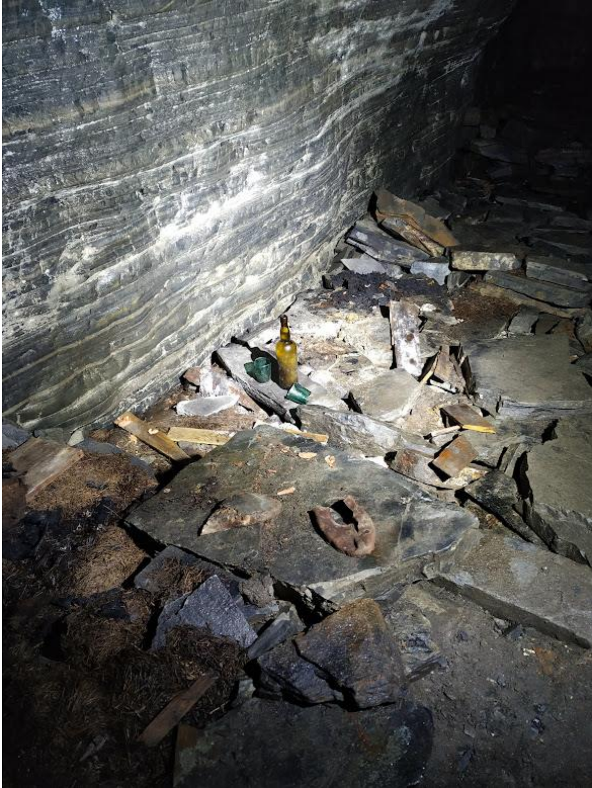
Figur 2: Et bilde av ulike gjenstander som ble lagt igjen i Nordsandfjordhula på Sørøya.