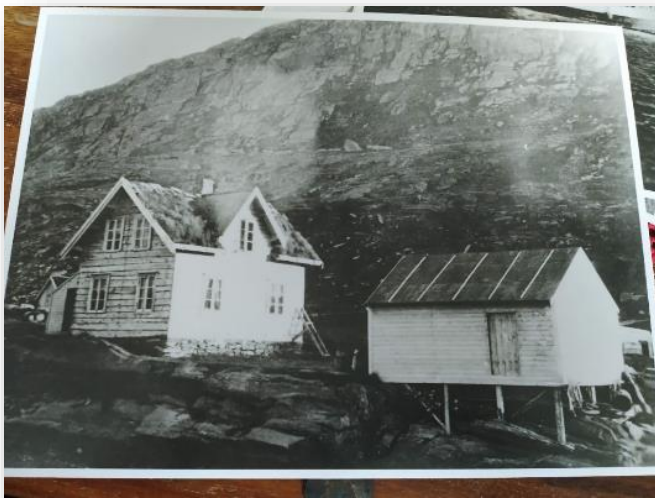
Figur 7: Et bilde av et fotografi tatt før krigen. Bildet viser et hus og en sjå og tilhører Evald Husby.