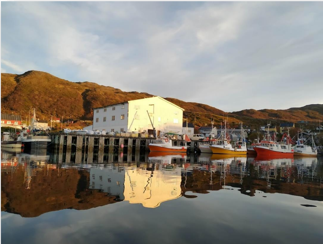
Figur 1: Et bilde av havna i Breivikbotn.

Det har gått 77 år siden de første nordtromsværingene og finnmarkingene reiste tilbake til sine hjemsteder for å bygge opp husene og livene sine igjen i et landskap som besto av brannruiner. I denne oppgaven undersøkes det hvilke minner de som vokste opp i etterkrigstiden har fra hjemkomsten etter krigen og det store gjenreisningsprosjektet. Videre skal vi se på hva disse fortellingene kan si om sosiale, politiske og kulturelle utviklinger i bygdene. Ved å ta utgangspunkt i materialitet og dets evne til å fremkalle minner skal det utforskes hvordan den materielle oppbyggingen etter krigen påvirket og påvirker ulike bygger på Sørøya. Inspirert av Eric Hirschs (1995) begrep sekundære landskap vil det både fokuseres på metoder for memorering i landskap og videre hva de spesifikke minnene sier om relasjonen mellom menneske og sted.