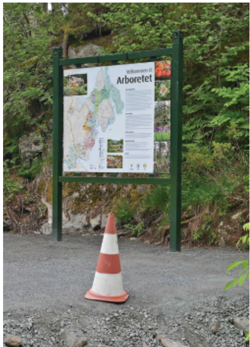
Ny informasjonstavle ved "Verdens Ende", like ved Blondehuset (foto: Bjørn Moe, 30. mai 2017).

I trekanten mellom vegene ved "Verdens ende" ble det etablert et nytt informasjonsområde. Jorda ble gravd opp og flyttet til den nye skråningen på Dalsmyra, samtidig som steinmasser fra Dalsmyra ble fylt i til å planere ut informasjonsområdet til samme høyde som bilvegen. Det planerte området har blitt en god stimleplass foran infotavlen som er montert ved bergveggen. Det gjenstår å ferdigstille den delen som har skråning mot veien til Grønevika, og det skal lagges en snarveg over plenen der. Her må det også graves ned ny drengum før plassen kan ferdigstilles.