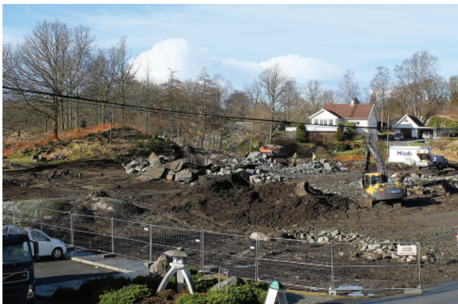
Tomten for reising av lystgårdsbuset fra Lønningen ble gravd ut og knausen der huset skal stå, ble sprengt ut (1. mars 2017).