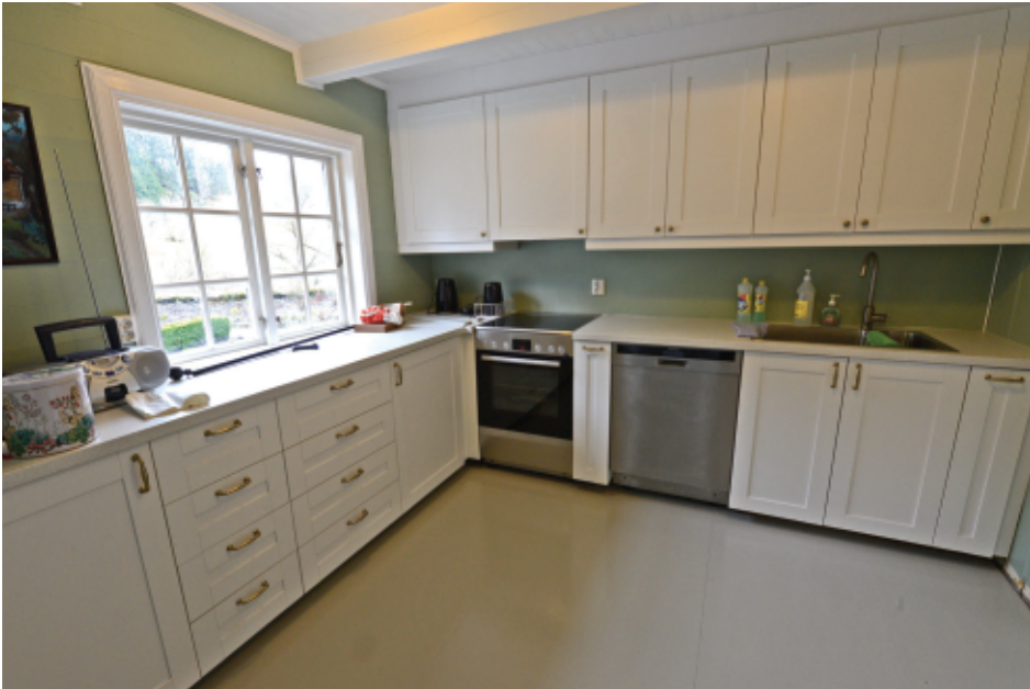
I Blondehuset er ny kjøkkeninnredning kommet på plass (foto: Bjørn Moe, 27. mars 2017).

Turvegen og tørrmuren som går parallelt med Mildevegen ved Damhaugen (ovenfor Rosariet) ble ferdigstilt.