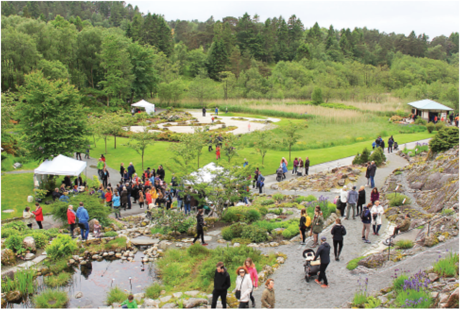
Mange hadde lagt turen til Milde for å være med på 'Japansk dag' i Botanisk hage (foto: Terbi Pousi, 11. juni 2017).