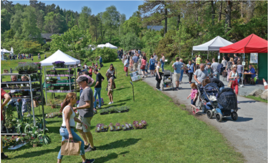
Svært mange fant veien til Milde på 'Arboretets dag' (foto: Bjørn Moe, 28. mai 2017).

"A river runs through it", om en botanisk hage i Norfolk i England. Venneforeningen arrangerte tur til Bekkjarvik lørdag 10. juni.