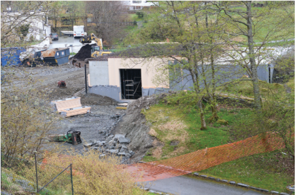
Grunnmuren for Lønningen lystgård er kommet opp. Underetasjen skal bl.a. romme undervisningsrom og garderobes med toaletter (foto: Bjørn Moe, 9. mai 2017).