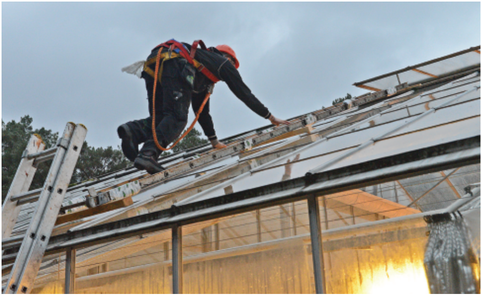
Glasstaket på Veksthuset byttes til polykarbonat (foto: Bjørn Moe, 16. november 2017).

Det er observert spor og skade etter hjort i flere områder både i Arboretet og Botanisk hage. Vi står overfor et økende problem dersom hjorten får et mer fast tilhold med flere dyr i skogene på Milde.