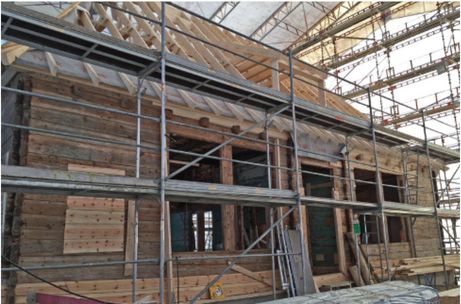
Under stillas og presenningtelt reiser tømmerveggene i det gamle lystgårdshuset seg (foto: Anne Hordnes, 21. desember 2017).

Anleggsarbeidet startet opp 20. februar 2017 med graving og felling av trær, men de store eikene ved tomten ble bevart. Noe sprengning måtte til for å gi plass til husets kjelleretasje. Hele denne delen av Botanisk hage skal bygges om, og et større areal ble avstengt som anleggsområde. Lønningen lystgård er første del av Adiabata-prosjektet, en framtidsvisjon for utvikling av Botanisk hage.