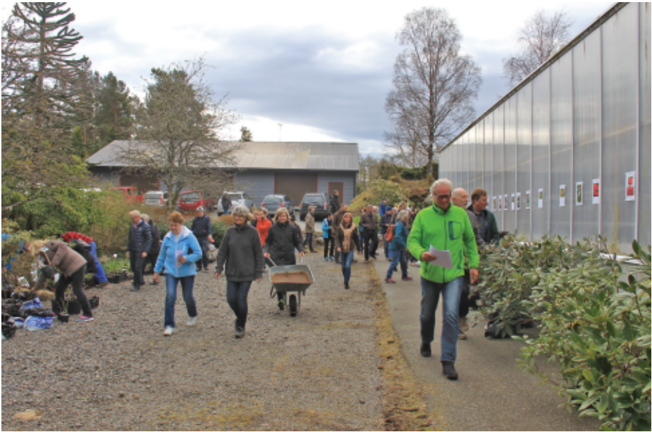
Startskuddet er gått for Venneforeningens årlige plantesalg (foto: Terhi Pousi, 29. april 2017).