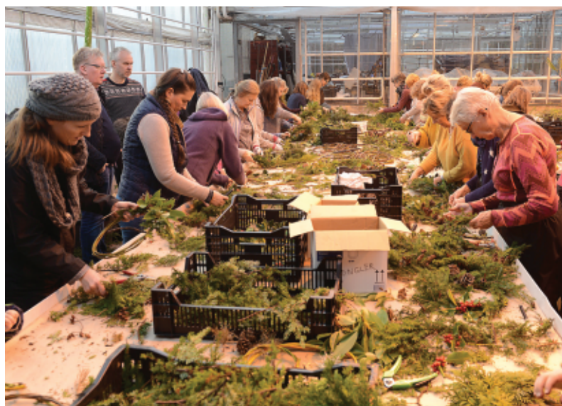
Det var konsentrert og hektisk aktivitet med kransebinding og dekorasjoner under 'Juleverksted' i Veksthuset (foto: Bjørn Moe, 3. desember 2017).

En annen viktig støttespiller for oss er "Kor e' Vi" som driver kaféen i Blondehuset på søn- og helligdager fra påske og ut september. I mai og juni er det kafé også på lørdager.