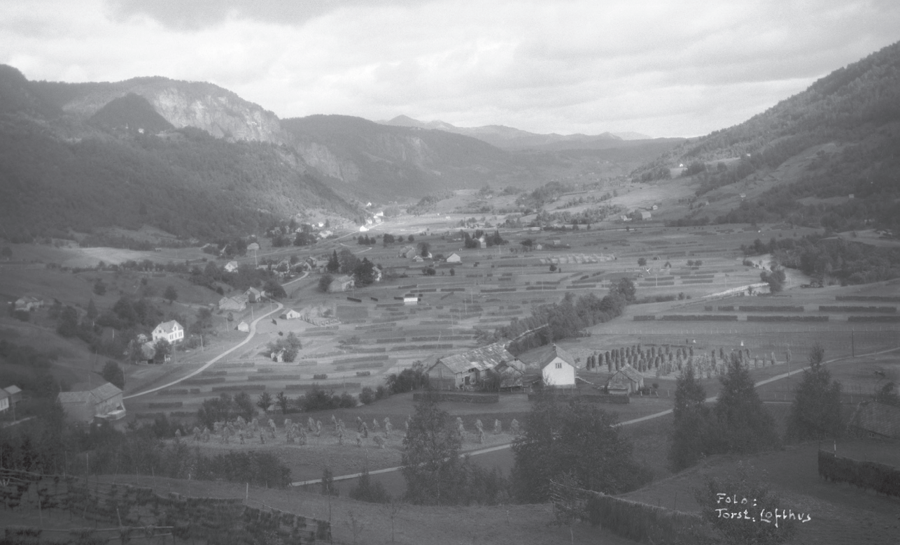
Fig. 6 | Steinsdalen med Steine og Lied ca 1910.