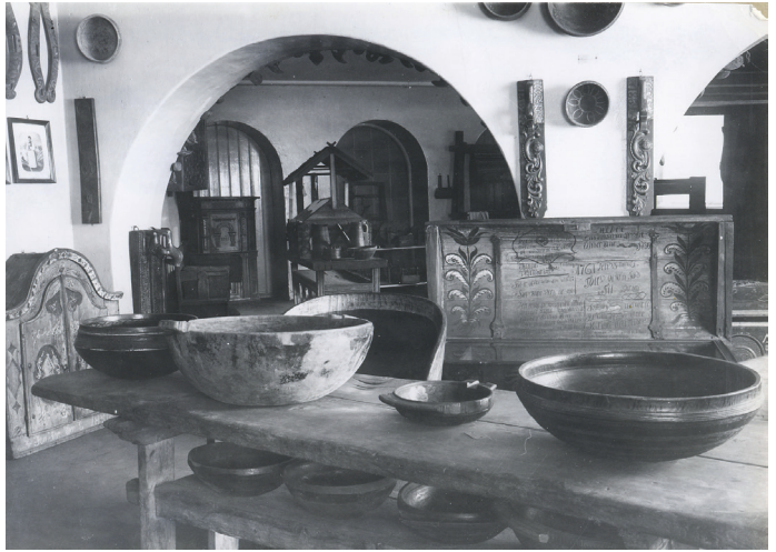
Fig. 3 | Deler av bygdeustillinga ca. 1900