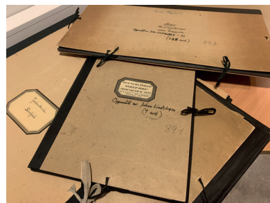
Fig. 8 | Frå Teikningsarkivet etter Bergens Museum, Fylkesarkivet i Vestland.

Registreringane omfatta all slags inventar, som treskurd, rosemåling, veving, beslagarbeid, møbelkunst og innreiingsarbeid, og vart sidan systematisert i typologiske og ikonografiske grupper. Registreringsarbeidet vart i stor grad utført