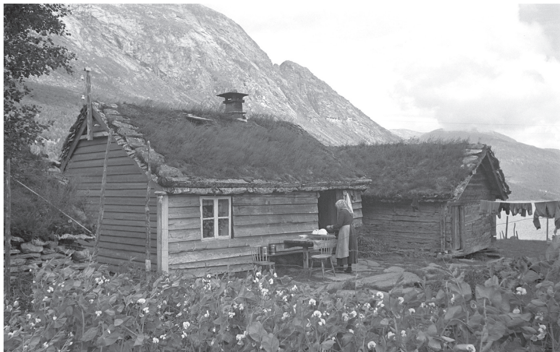
Fig. 1 | Frå Vassenden Jølster, ca 1939.