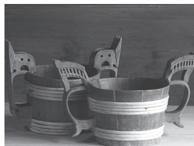
Fig. 9 | «Kulturinventar» frå Sunnfjord ca. 1939