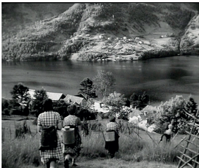
Fig. 7 | Frå filmen Havretunet, 1950.