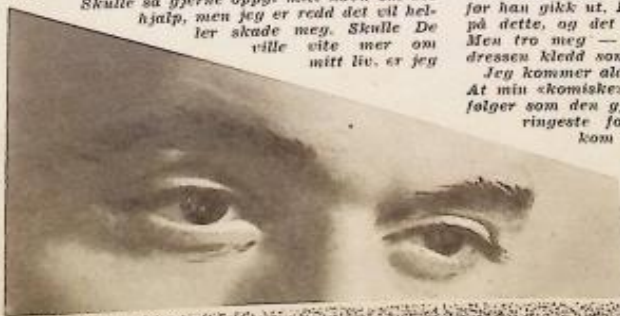
Figur 3: «Skjulte tragedier», Norsk Dameblad, 1953, nr. 7

Mot sedvane var han helt edru, og han ga i det hele tatt uttrykk for en ro og en venalighet som jeg bare husket fra den første tiden av vårt ekteskap. Jeg fikk nær- (Forts. side 38.)