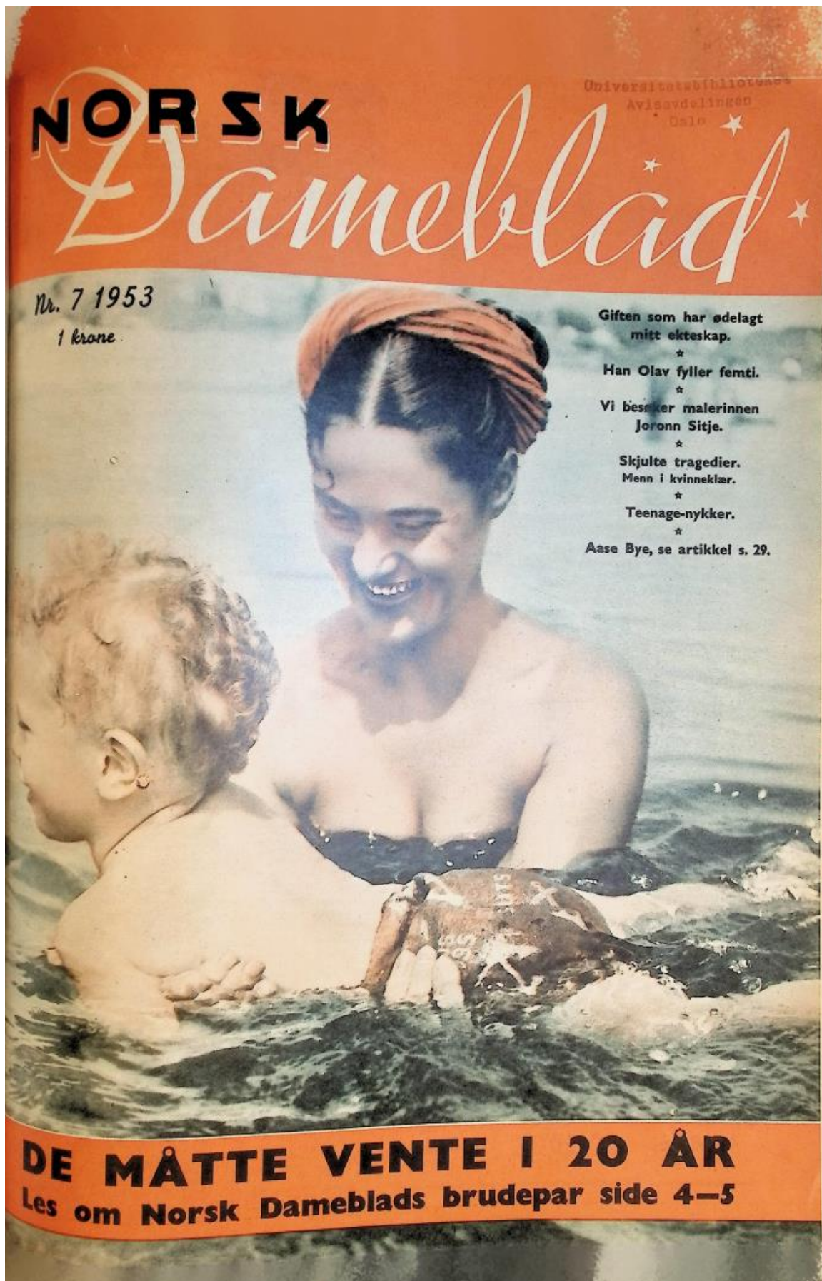
Figur 4: Norsk Dameblad, 1953, nr. 7