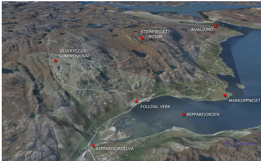
Bilde 4.1: Oversiktsbilde av Nussirprosjektets geografiske utstrekning