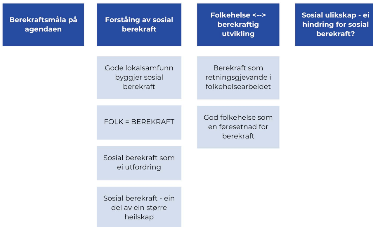
Figur 1. Overordna og underordna tema fra analysen