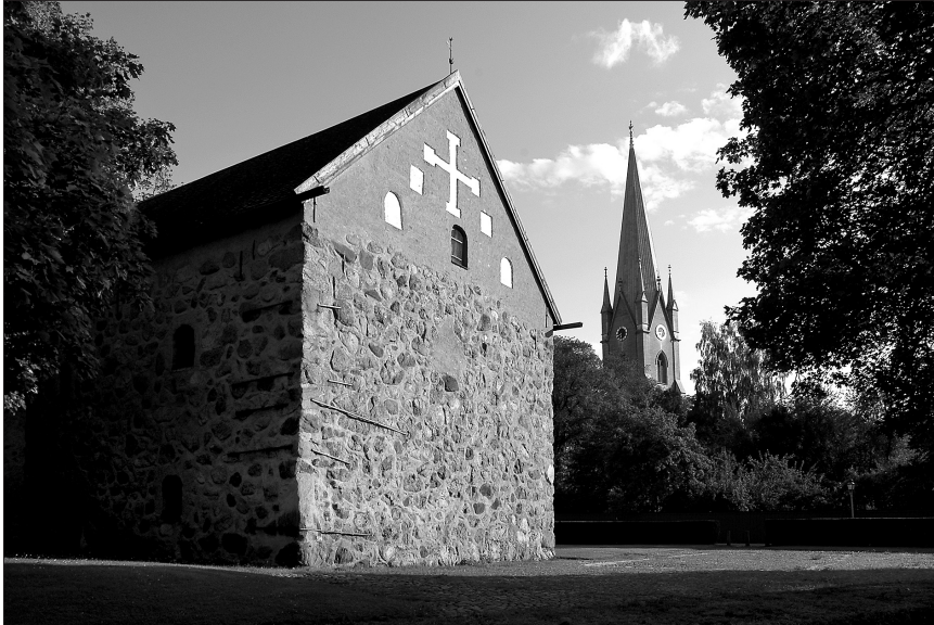
Figur 4. Den s.k.Rhyzeliushgården, under medeltiden residensgård för prebendet Omnium Sanctorum. Stenhusets äldsta del från 1300-talets slut, kraftigt tillbyggt kring sekelskiftet 1500. I bakgrunden domkyrkan.