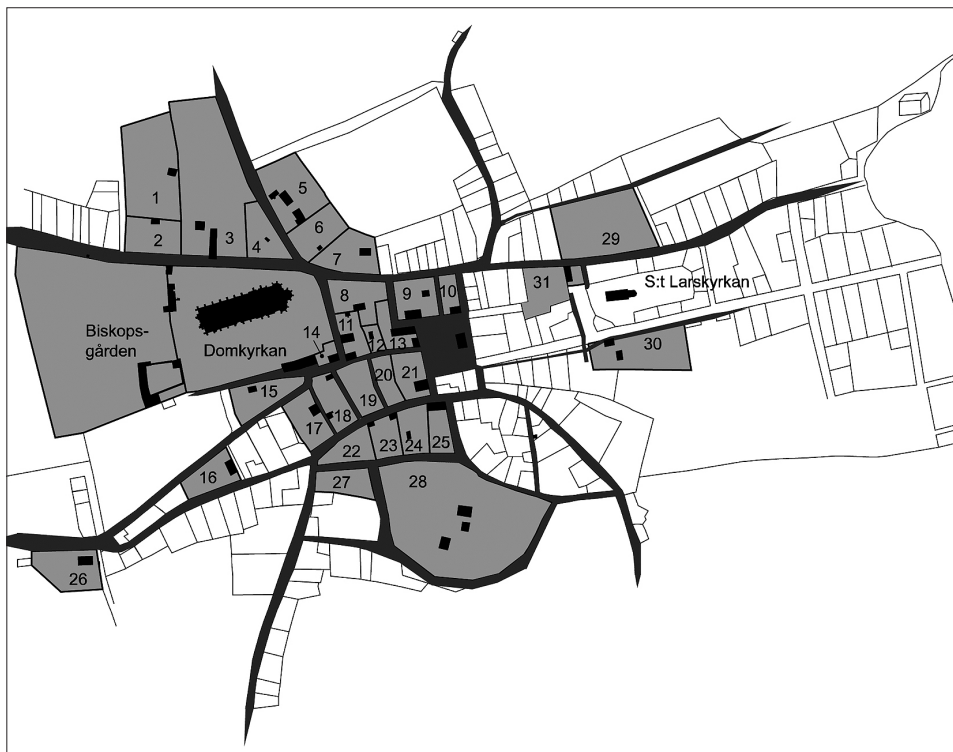
Figur 3. Linköping under 1400-talet. Svart markerar kända stenhus, grått markerar rekonstruerade tomter och gårdar. Nr 28 markerar franciskankonventet. Efter Tagesson 2002b.

analyserat detta rumsligt. Inte heller hade tidigare arkeologer försökt jämföra arkeologiska observationer med det skriftliga källmaterialet. Jag tolkar förloppet på så sätt att man har upprättat en sorts domkyrkostadsdel i den lilla staden, och dessa rika prästhushåll har dragit resurser från landsbygden runtom i stiftet in till staden, samtidigt som dessa har ökat efterfrågan på varor och tjänster. Detta ledde till en ekonomisk utveckling som satt tydliga spår i det arkeologiska källmaterialet, även i den mer profana delen av staden.