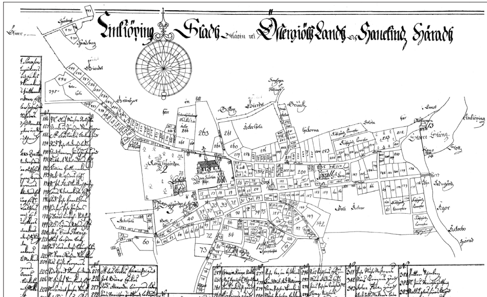
Figur 1. Linköpings äldsta tomtkarta 1696 utgör ett viktigt underlag för en retrospektiv analys av den medeltida staden och dess tomtstruktur.

örjan var det avsikten att främst beröra frågor om varför resultaten från de arkeologiska undersökningarna under 1980-talet tycktes avvika så kraftigt från den traditionellt och på skriftliga källor baserade historieberättelsen. Efterhand vidgades mina frågeställningar för att till slut omfatta frågor om stadens olika topografiska och sociala rum, och hur utvecklingen kunde beskrivas i ett ahistoriskt perspektiv, med stora diskontinuerliga skillnader över tiden.