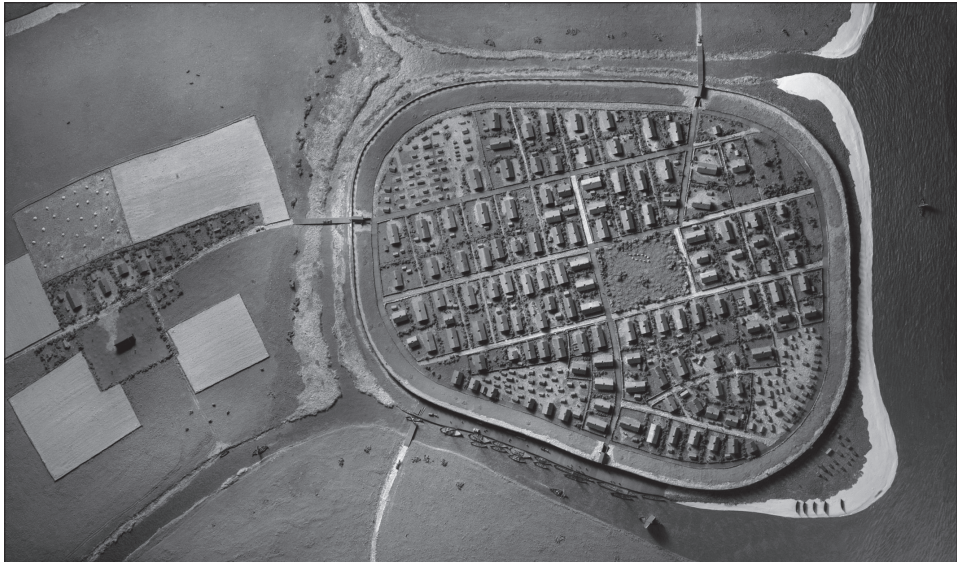
Figur 1a. Model af Århus ca. 980. Til højre mod øst ses Århus Bugten. Vest for ringvolden ses byens første kirke og bebyggelsen ved denne.