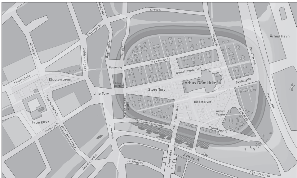
Figur 1b. Kort, der viser modellen lagt oven på et nutidigt Århuskort.

Næste gang, Århus nævnes i de skriftlige kilder, er i 965, hvor den tyske kejser Otto den Store udstedte et privilegium, hvori han fritager «al ejendom i danernes mark eller rige ved de til Guds ære opførte kirker, nemlig i Slesvig, Ribe og Århus... for enhver skat eller tjenesteydelse efter vor ret». Den tyske kejser giver altså afkald på skat fra de danske bispesæders ejendomme. Et let løfte da den tyske kejser efter alt at dømme ikke har haft nogen myndighed over ejendom