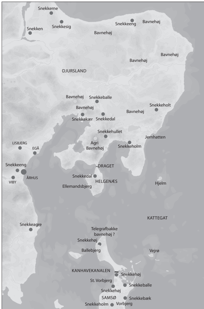
Figur 4. Omkring Århusbugten findes Danmarks største koncentration af snekkenavne fra vikingetiden (mørke prikker). De lyse prikker viser placeringen af bavneshøje og andre dominerende høje, der formentlig har indgået i et bålvarslingsystem, der kunne træde i funktion, hvis en fjendtlig flåde nærmede sig Århus. Tegning Moesgård Museum.

Som tidligere nævnt kan det ældste Århus følges tilbage til 770'erne, men allerede i 726 er det tydeligt for enhver, at kongemagten har militærstrategiske interesser i området. Dette år anlægges den ca. 500 m lange og 11 m brede Kanhavekanal på Samsø (Asingh 2005:116f). Kanhavekanalen blev anlagt for, at man hurtigt kunne flytte en krigsflåde fra den ene side af Samsø til den anden og på denne måde beherske både Århusbugten og det sydlige Kattegat med de samme krigsskibe. Dette anlægsarbejde er så omfattende, at kongen må have stået bag det. Måske er der tale om kongen Angantyr (Ogendus), som omtales i helgenbiografien om ærkebiskop Willibrord af Utrecht (Jensen 1991:10).