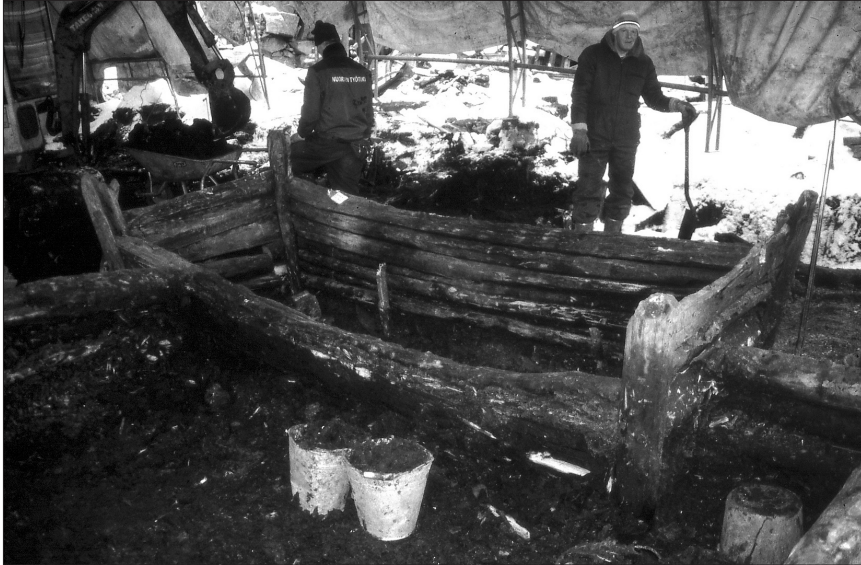
Figur 3. Utgrävningen pågår på Åbo Akademis tomt år 1999 (nr. 2 på bild 1). Boden av stock på bilden har daterats dendrokronologiskt till slutet av 1300-talet.