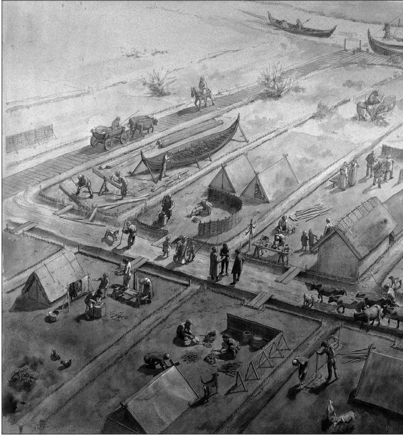
Figur 1. Markedspladsen i Ribe. Tegning Flemming Bau.

Mange fund af sceattas af Wodan-monster typen har gjort, at numismatikeren David Metcalf har rejst spørgsmålet, om denne type blev udmøntet i Ribe. Baggrunden er, at typen har sit tyngdepunkt i Ribe. Yderligere er den dominerende her, nærmest enerådende efter ca. 725, og den fortsætter med at være i almindelig brug helt frem til ca. 800 og således også efter Pippins møntreform i midten af 700-tallet. Den afløses af Hedeby-mønten, hvoraf én type har samme billedprogram som Wodan-monster sceattaen. Dette kunne tolkes som, at der ikke alene fandt en udmøntning sted i Ribe fra ca. 720, men at der lokalt var tale om en monopolmønt, og at den blev afløst af en ripensisk produceret mønt af Hedebytypen (Moesgaard 2007 med henvisninger). Dette peger på en tilstedeværelse af en form for magt – centralmagt om man vil – der skal ses i sammenhæng med de mindst fem faser af Dannevirke før 800 og måske Kanhavekanalen på Samsø fra 726.