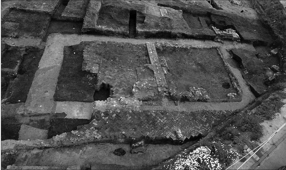
Figur 3. Franciskanerklosteret i Ribe blev grundlagt 1232, men allerede o. 1300 byggedes et stenhus som sydføj i klostergård nr. 2, der lå syd for den egentlige klostergård. Stenhuset opførtes på sandfundamenter. (Andersen 2003:34).

m.v. indikerer, at borgens i hvert fald er fra anden halvdel af 1200-tallet. Arkæologiske undersøgelser har afsløret aktivitet på stedet tilbage i 1100-årene, men der kunne ikke siges noget om aktivitetens karakter – det behøver intet at have med et borganlæg at gøre (Jensen et al. 1982:57–59).