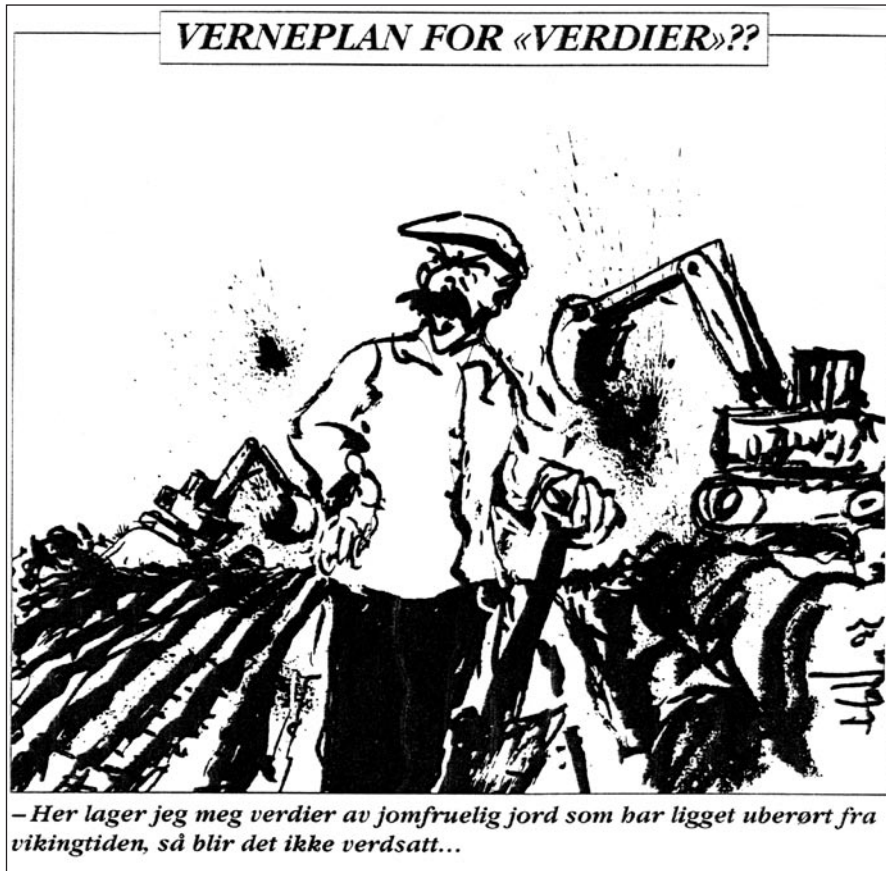
Figur 3. Verneplan for "verdier"?? (etter Jærbladet 3. mars 1997. Tegner: Tor Atle Hatlem).