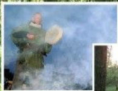
Forsøvel, Fjell, Høy