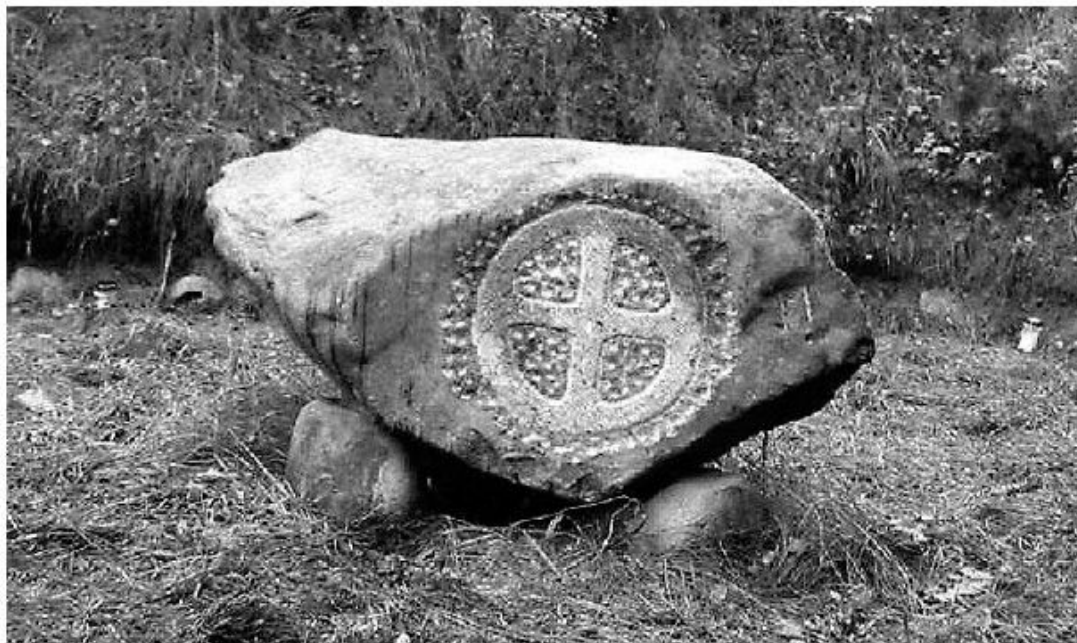
Blotsstenen i Yggdrasils skov

Mens kristenfolket kontemplerte over guddommelig himmelfart, ble en skog eid av danske hedninger innviet i Danmark. Et 50-talls inviterte gjester deltok på denne historiske begivenheten.