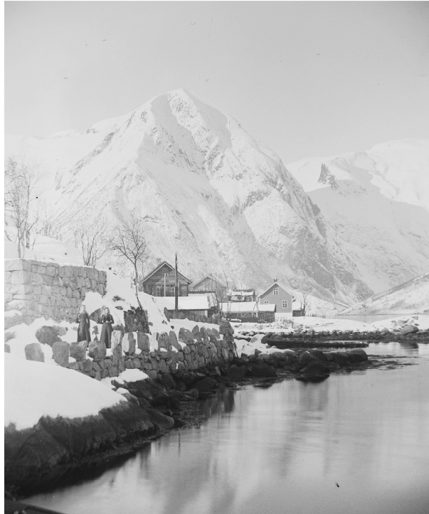
Foto: Fjellet Vindteken sett frå Balestrand sentrum ca. 1897–1910.

14 meter høg sokkel og står oppført på sørsida av fjorden på Vangsnes. 80 Statuen står slik at han ser over til Balestrand. Statuen av Kong Bele vart plassert i Balestrand ved ein gravhaug frå vikingtida.