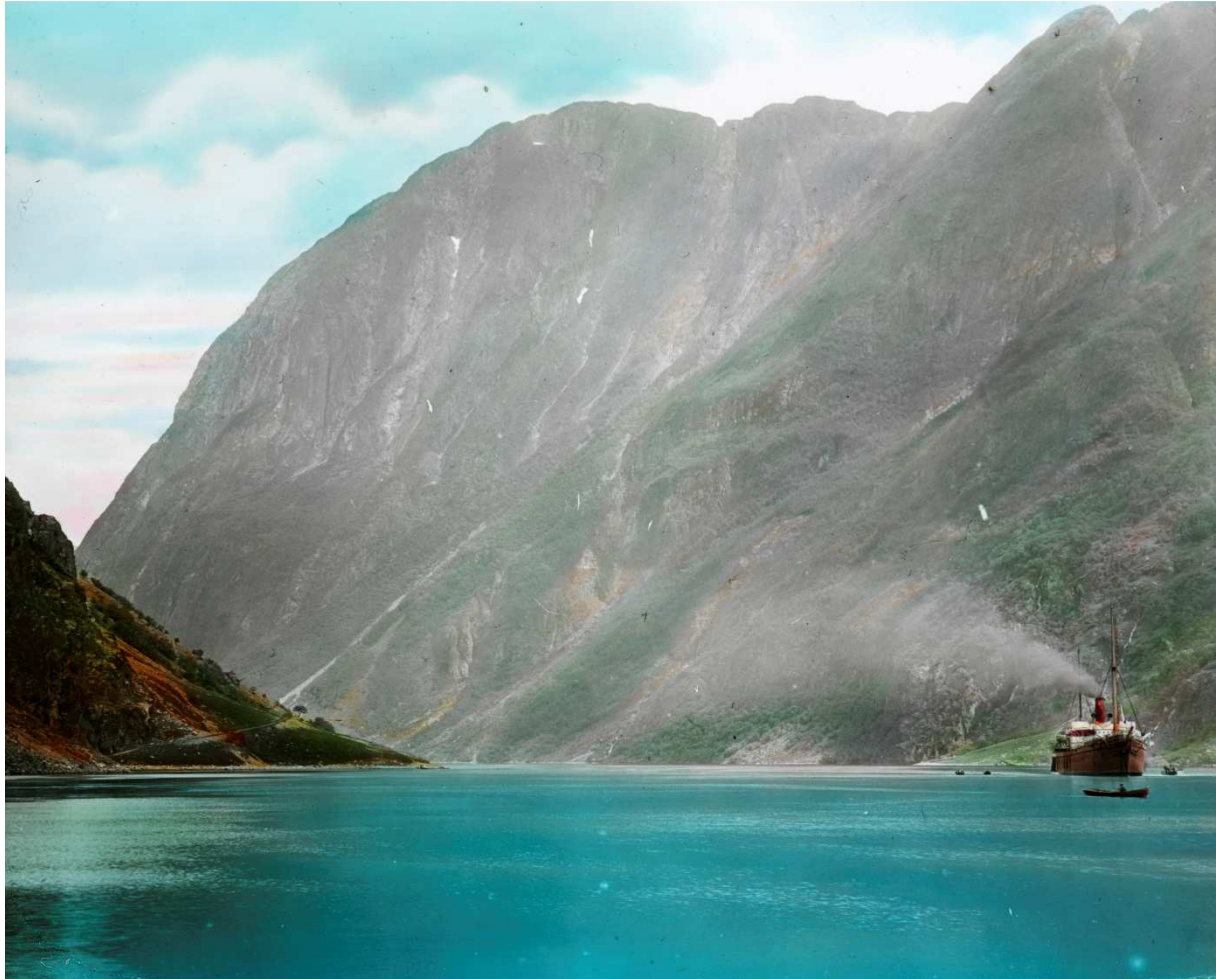
Foto: Dei nye dampskipa kjem til Sognefjorden. Bilete er tatt frå Gudvangen ca. 1890–1910. (Kjelde: Fylkesarkivet i Sogn og Fjordane. Fotograf ukjend. Kan ha vore ein av dei to britiske fotografane Samuel J.Beckett og P. Heywood Hadfield.)

cruiseskipa kom, var det få og små hotell i Noreg. Rundreisene med cruiseskipa gjorde at fleire fekk høve til å reise til Noreg. Turane vart enklare å gjennomføre, og kostnadane gjekk ned.