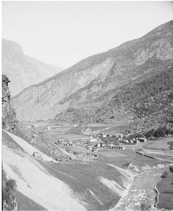
Foto: Flåm og Flåmsdalen, ca.1898.

Fram til 1914 var det 550 personar frå Flåm som reiste over Atlanterhavet og færre enn ti av dei kom tilbake. 94 Mellom 1866 og 1910 steig innbyggartalet frå 478 til 581 personar. 95 Folketalet heldt seg såleis stabilt, med ei lita auke fram mot første verdskrig.