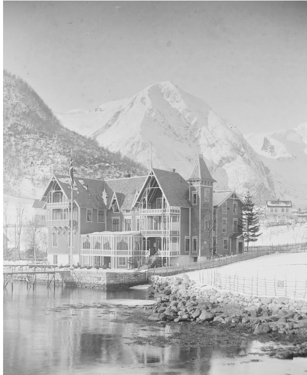
Foto: Hotel Balestrand opna i 1892.

Sidan det ikkje er den same yrkeskategorien for overnatting på heradsnivå som i 1891, er det vanskeleg å samanlikne tala. Med god vekst for reiselivet på nasjonalt nivå, hadde eg forventa at det var større fokus på dette i statistikken på heradsnivå. Under viser eg tala for kategorien som er den næraste til overnatting, og tenarkategoriar som kan vere aktuelle for hotelldrift.