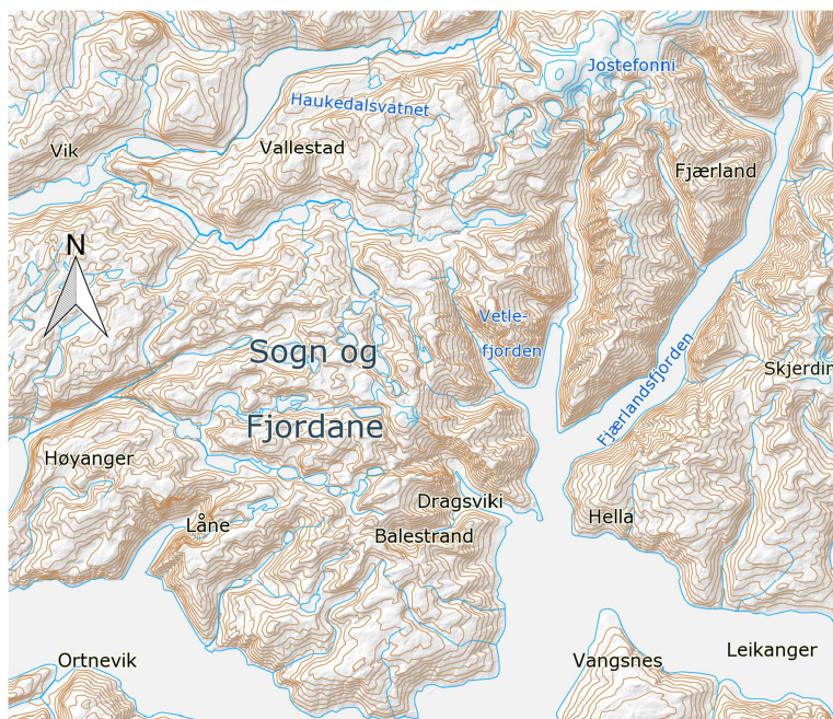
Kart over Balestrand. Målestokk: 1:320 000

Balestrand kommune vart ikkje sjølvstendig før etter Formannskapsloven av 1849. Før det var dei tre sokna Tjugum, Vangnes og Fjærland ein del av Leikanger kommune. Desse tre vart slått saman til Balestrand kommune i 1849. Sentrumet for kommunen vart i soknet Tjugum, og det er bygda der som har gitt namnet til kommunen. Det er dette området som er det sentrale for denne oppgåva, sjølv om reiselivet òg vaks fram i Fjærland. Frå 1600 til 1800 var det liten vekst i folketalet i Balestrand samanlikna med andre bygdar i Sogn. Dette tok seg opp frå 1800 og fram mot 1865. Då var veksten om lag den same som i dei andre bygdene. I 1865 var det 2204 innbyggjarar i Balestrand, og talet er nesten det same i 1910. Då var det 2141 innbyggjarar. I same periode var det òg høg utvandring til Amerika, som i dei andre bygdene i Sogn.