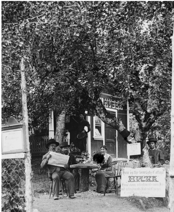
Foto: Gjester på kafeen Hygea ca. 1890–1925.