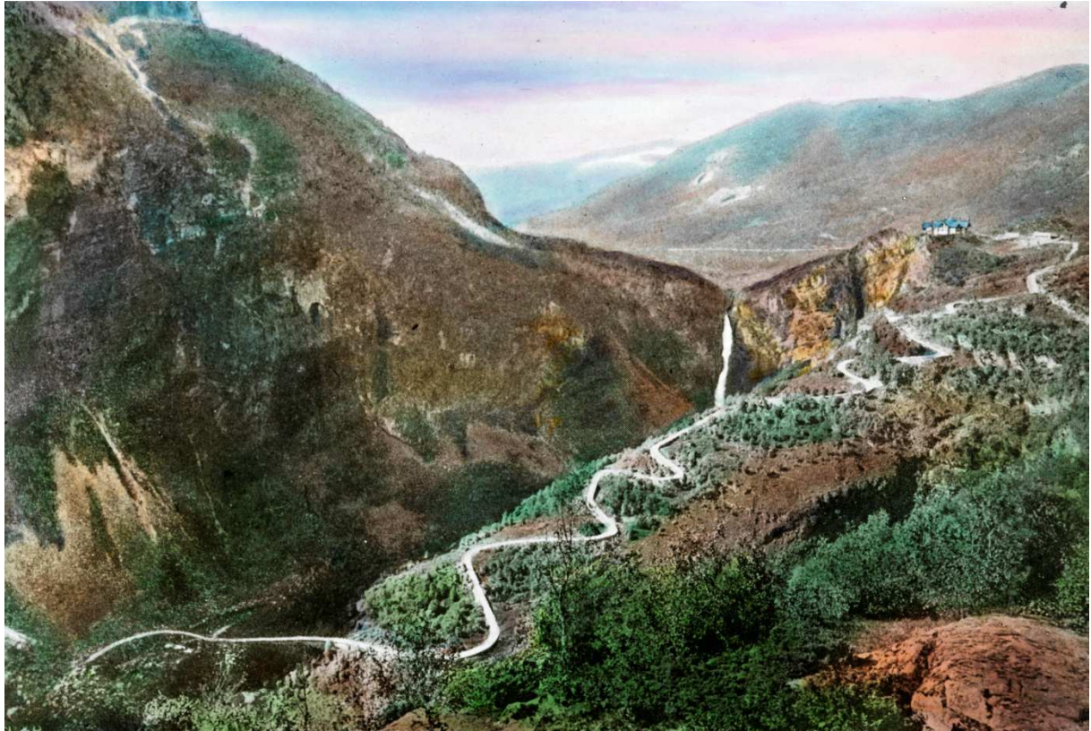
Foto: Den bratte og svingete Stalheimskleiva med Stalheim Hotel på toppen ca. 1890–1910.

destinasjonar for reisande som kom til Noreg. Det var så populært at det opna eit hotell på toppen av utkikkspunktet, Stalheim Hotel, i 1885. 54 Hotellet vart raskt populært, og ti år etter opninga hadde dei plass til over 150 gjester. 55