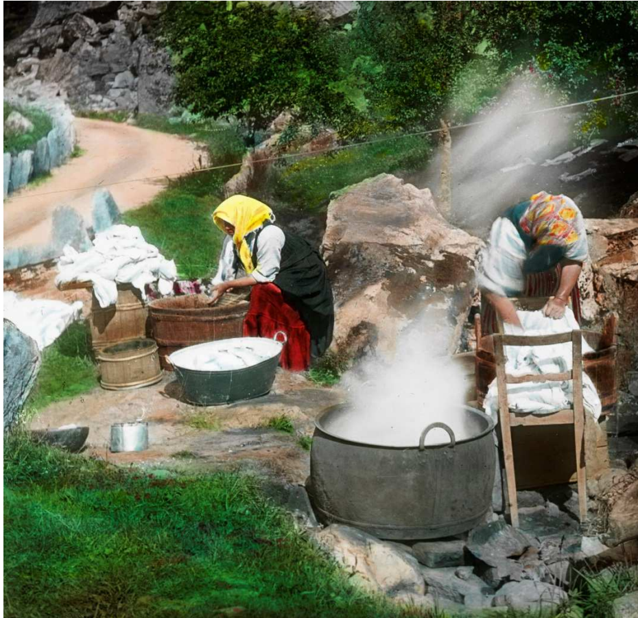
Foto: Kvinner som vaskar klede i Geiranger ca. 1890–1910. Illustrerer korleis dette arbeidet gjekk føre seg på den tida.

Den siste gruppa er kvinner som har oppgjeve «vask og stryking» som arbeid. Nokre spesifiserer at det er sesongarbeid ved å skrive «vask og stryking om sommaren». Desse damene bur for det meste i området rundt sentrum, utanom ei dame. Det skal ha vore vanleg at klesvask frå gjestene på Kvikne's Hotel vart sendt til kvinner på bygda som vaska for dei. 170 Det kan vere at gjestene på Hotel Balestrand gjorde det same. Dette kan vere ei forklaring på kvifor det er så mange kvinner som har ført opp dette som yrke.