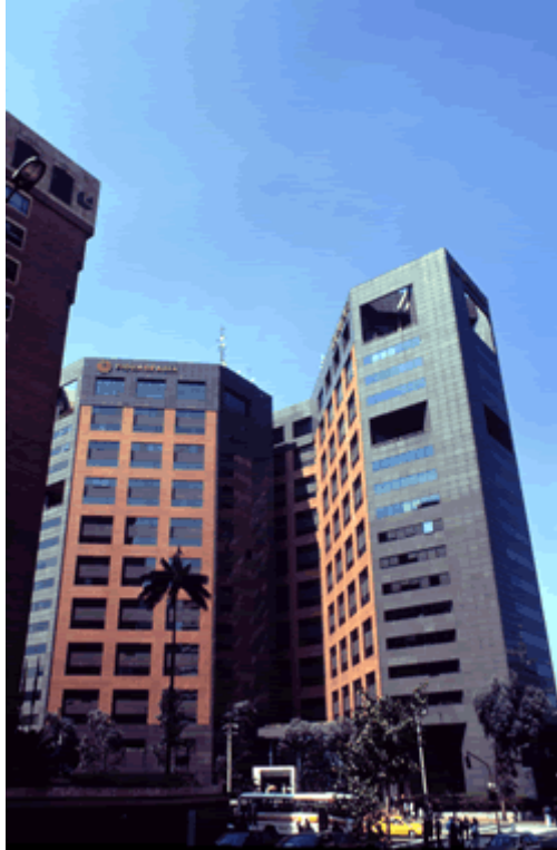
Carrera Séptima / Calle 72