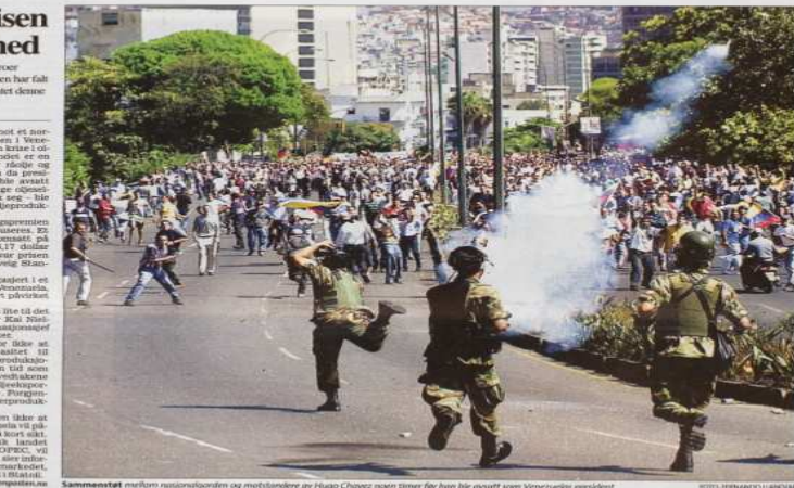
Sammensatt mellom nasjonalparken og møtende av Hugo Chavez noen timer før han ble avsatt som Venezuelas president.