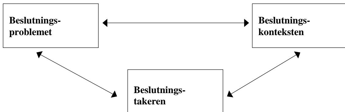
Figur 1. ”Beslutningstrekanten” (Backe-Hansen, 2004 s. 27).

Å fatte beslutninger handler om å ta et valg, og Backe-Hansen (2004) sier at å fatte beslutninger er en aktiv prosess. Backe-Hansen (2004, s. 27) forklarer denne prosessen ved å vise til modellen ”beslutningstrekanten”. Jeg har valgt å bruke denne modellen for å bedre forstå beslutningsprosessen. Modellen inneholder tre elementer; beslutningsproblemet, beslutningskonteksten og beslutningstakeren. Alle elementene i modellen er gjensidig avhengige av hverandre, endringer på et punkt kan føre til endringer på andre punkt (Backe-Hansen, 2004 s. 27).