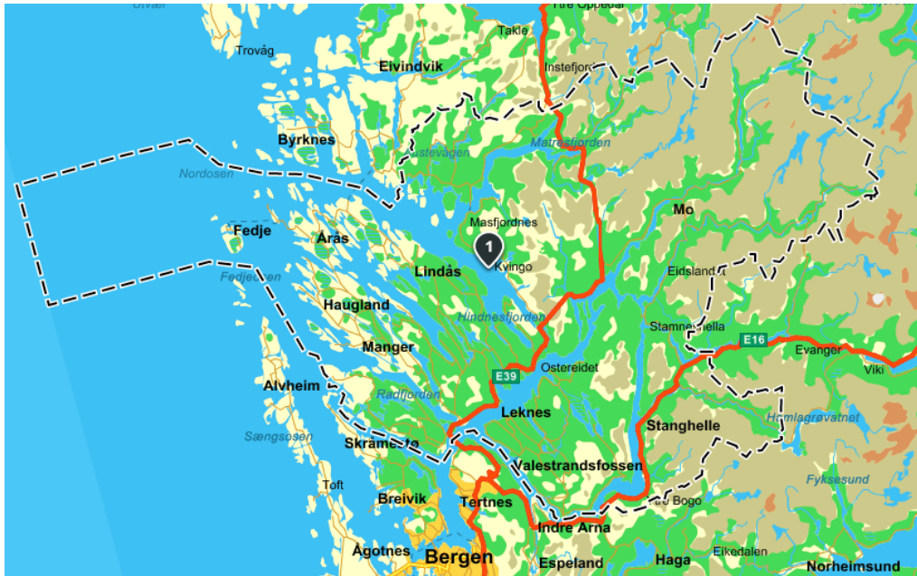
Figur 1 Skjermdump av kart over Nordhordland (Gule Sider, u.å)