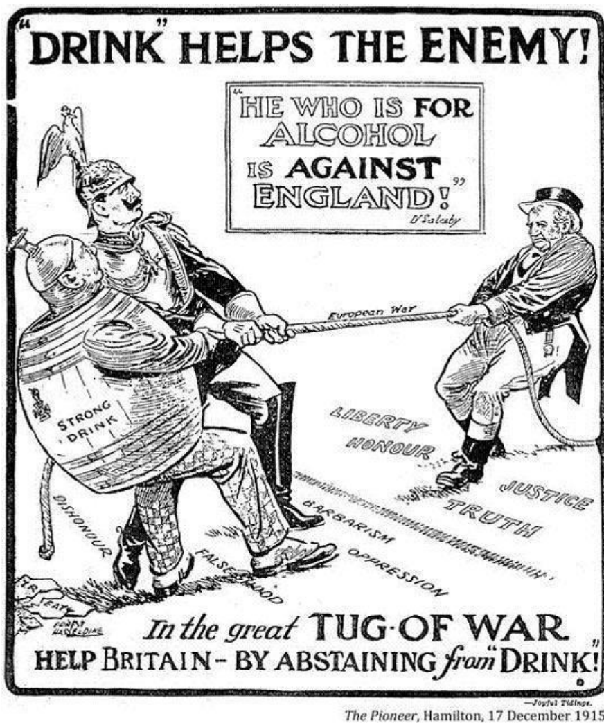
Fig 1: Den tyske keiser Wilhelm II med sin karakteristiske bart i en dragkamp om verdier.