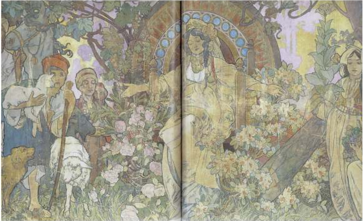
Figur 32 Alfons Mucha Bosnia tilbyr sine varer til Verdsutstillinga 1900 tempera, 244 x 627 cm