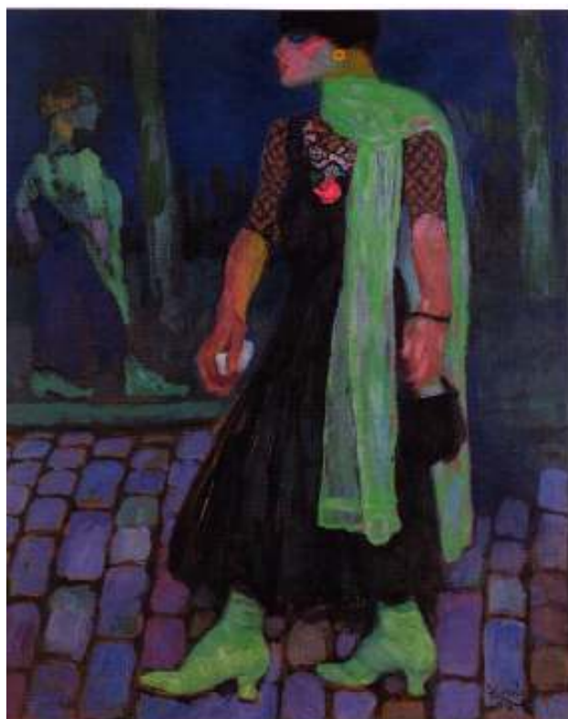
Figur 35 Frantisek Kupka Den arkaiske 1910 olje på lerret, 110 x 90 cm