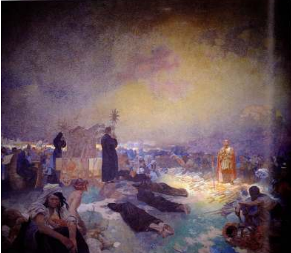
Figur 17 Alfons Mucha Etter slaget ved Vitkov 1916 eggtempera på lerret, 405 x 480 cm