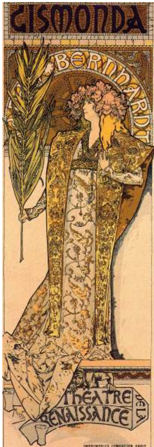
Figur 3 Alfons Mucha Gismonda 1895 fargelitografi, 215 x 76 cm