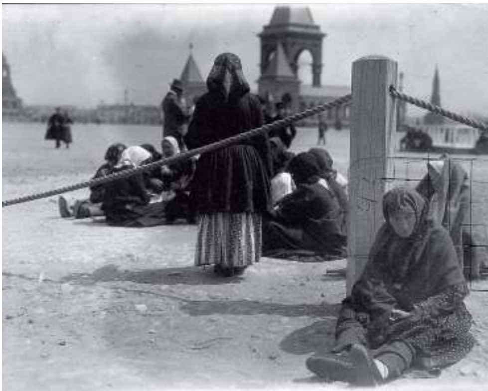
Figur 28 Alfons Mucha Den Raude Plass i Moskva; Sitjande kvinne fotografi frå turen til Russland, 1913