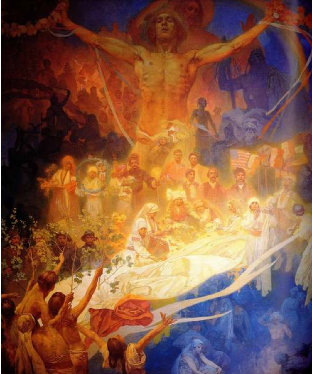
Figur 27 Alfons Mucha Slavarane sin apoteose 1926 eggtempera på lerret, 480 x 405 cm