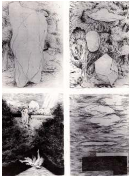
Figur 43 Josef Sima Det tapte paradys 1928 radering