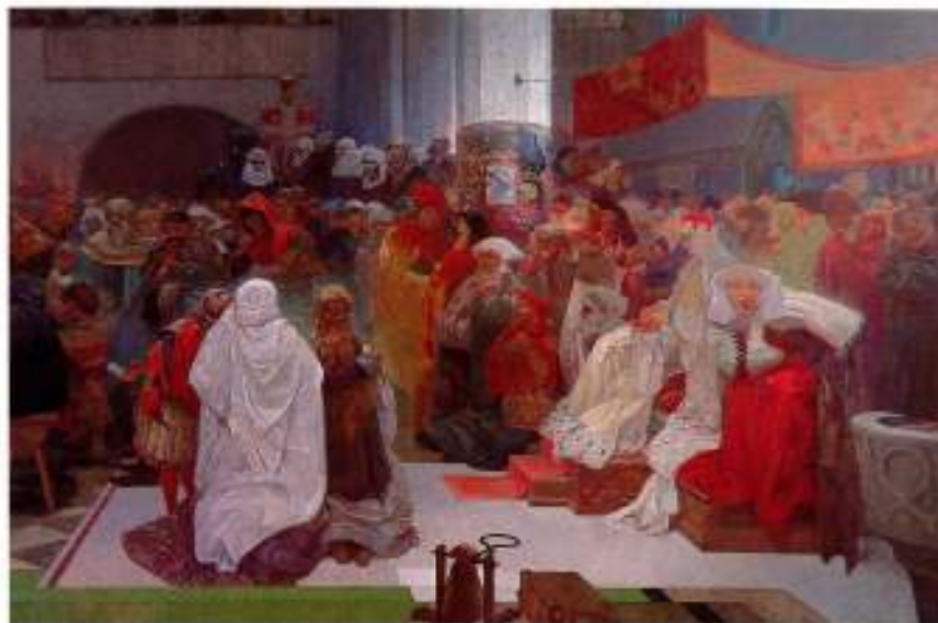
Figur 15 Detalj av Jan Hus sin siste seremoni i Betlehemskapellet