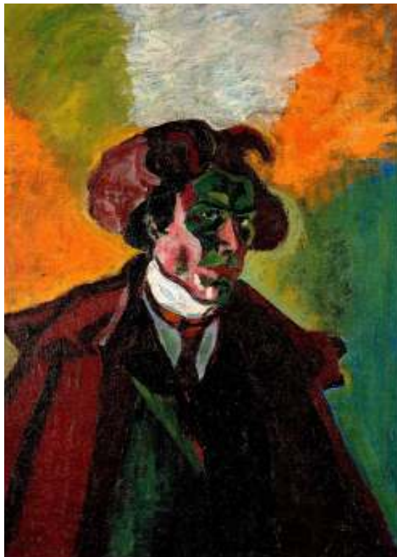
Figur 39 Bohumil Kubista Sjølvpportrett med frakk 1908 olje på lerret