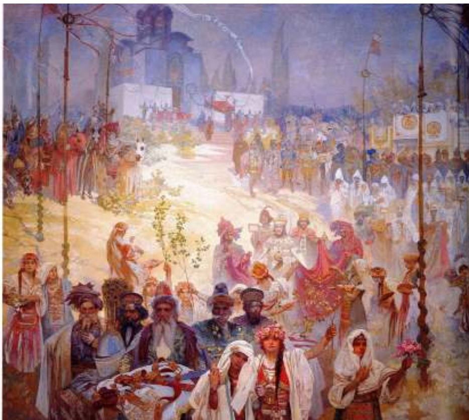
Figur 11 Alfons Mucha Kroninga av den serbiske tsaren Stefan Dusan 1926 eggtempera på lerret 405x480 cm