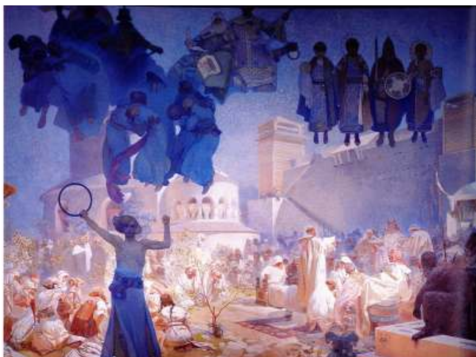
Figur 7 Alfons Mucha Introduksjon av den slaviske liturgien 1912 eggtempera på lerret, 610 x 810 cm