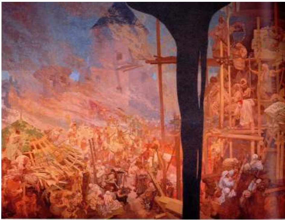
Figur 20 Alfons Mucha Forsvaret av Sziget, leia av Nicolas Zrinsky 1914 eggtempera på lerret, 610 x 810 cm