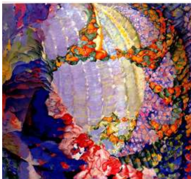
Figur 37 Frantisek Kupka Kosmisk Vår I 1913-1914 olja på lerret, 115 x 125 cm