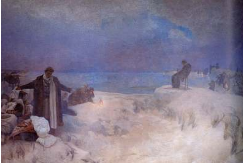
Figur 23 Alfons Mucha Jan Amos Komensky sine siste dagar 1918 eggtempera på lerret, 405 x 620 cm