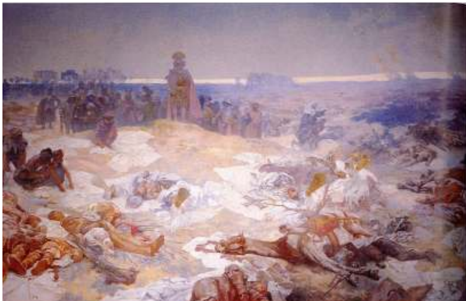
Figur 13 Alfons Mucha Etter slaget ved Grunwald 1924 eggtempera på lerret, 405 x 610 cm