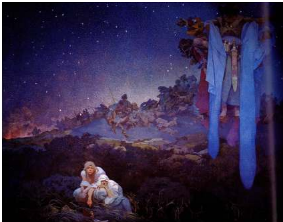
Figur 5 Alfons Mucha Slavarane på heimleg grunn 1912 eggtempera på lerret, 610 x 810 cm