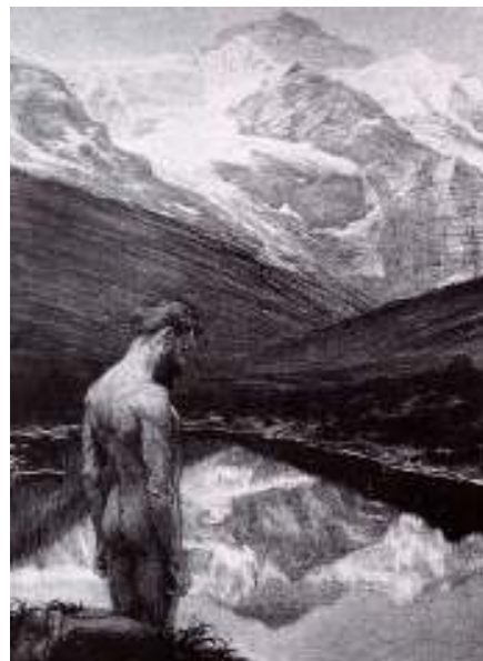
Figur 33 Frantisek Kupka Meditasjon 1899 kullstift på papir