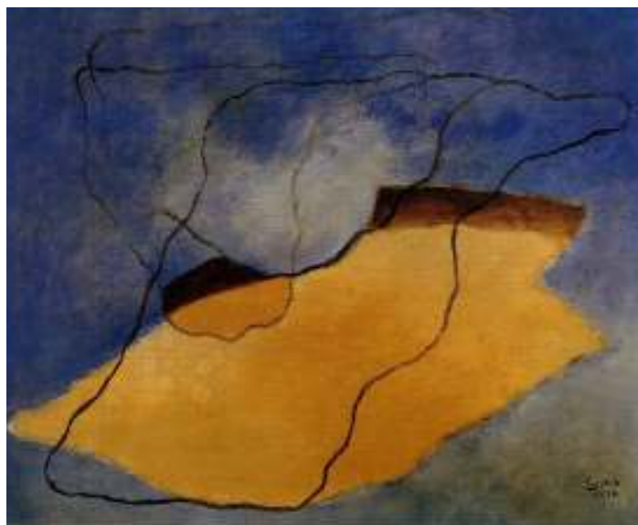
Figur 44 Josef Sima Øy I 1931 olje på lerret