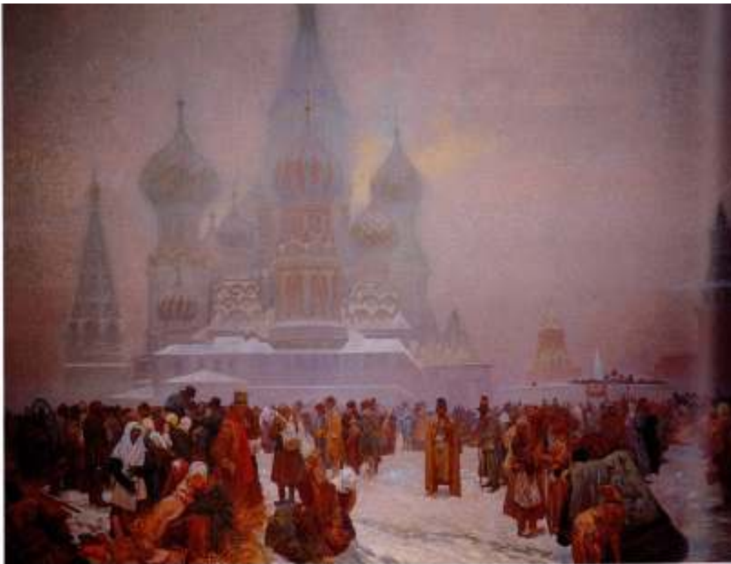
Figur 26 Alfons Mucha Avskaffing av liveigenskap i Russland 1914 eggtempera på lerret, 610 x 810 cm