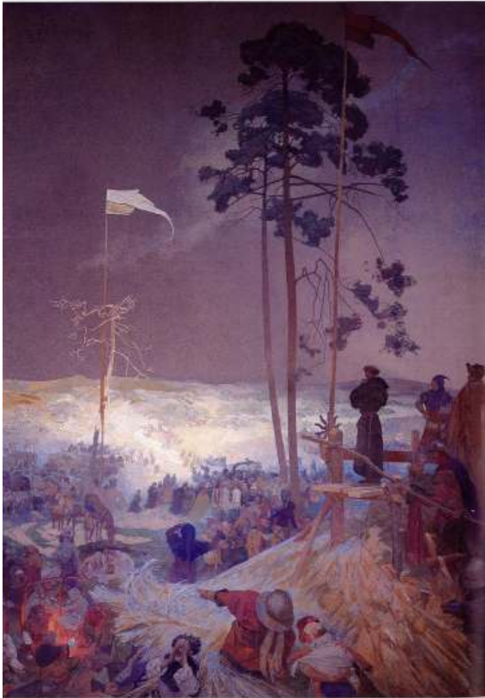
Figur 16 Alfons Mucha Møtet ved Krizky 1916 eggtempera på lerret, 620 x 405 cm