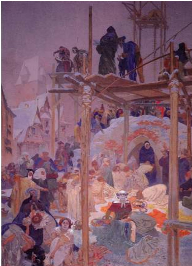
Figur 12 Alfons Mucha Jan Milic frå Kromeriz 1916 eggtempera på lerret, 610 x 405 cm