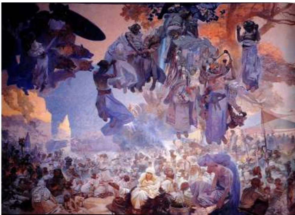
Figur 6 Alfons Mucha Svantovits kult 1912 eggtempera på lerret, 610 x 810 cm