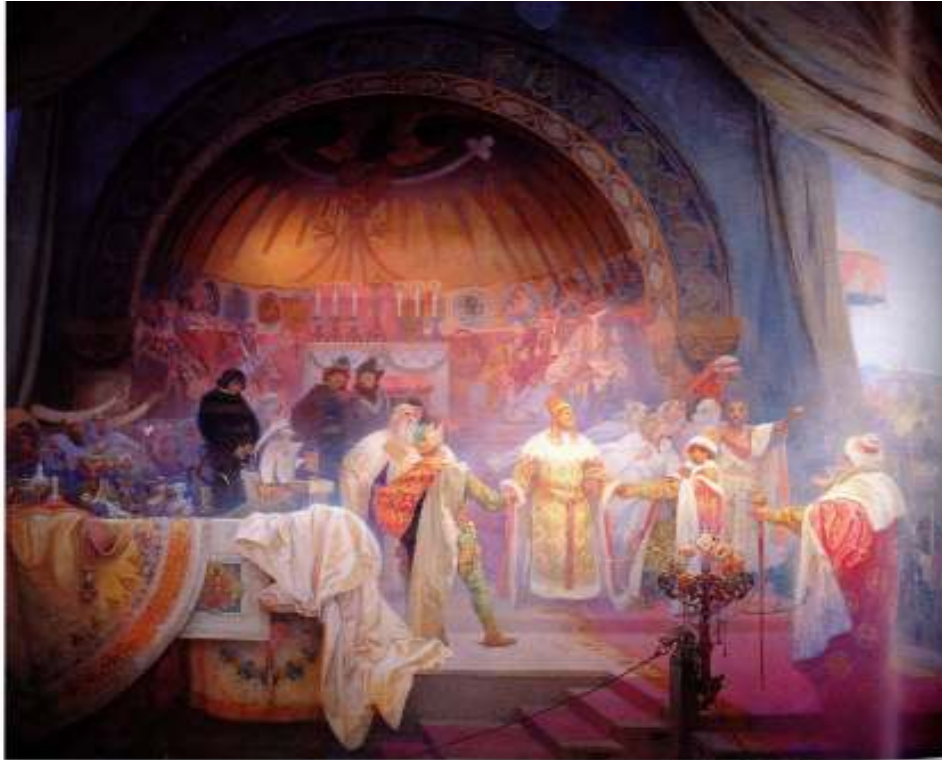
Figur 10 Alfons Mucha Den böhmske kongen Premysl Otakar II 1924 eggtempera på lerret, 405 x 480 cm