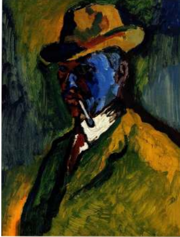
Figur 38 Emil Filla Sjølvpportrett med sigarett 1908 olje på papp