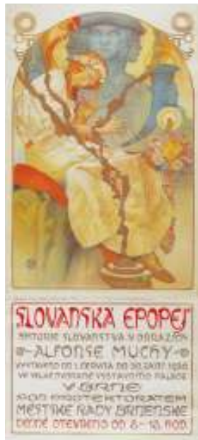
Figur 1 Forside: Alfons Mucha, plakat for Slovanska Epopiej, 1928 fargelitografi, 183 x 81 cm