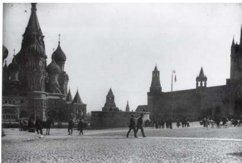
Figur 29 Alfons Mucha, fotografi frå turen til Russland, 1913