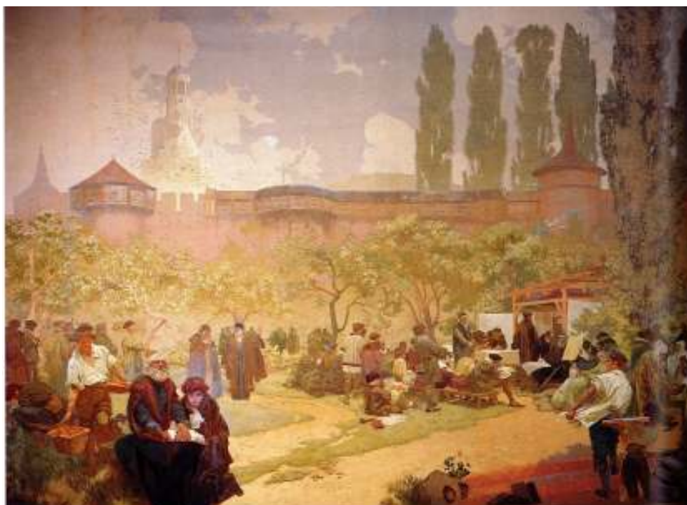
Figur 21 Alfons Mucha Trykking av Kralice-Bibelen i Ivancice 1914 eggtempera på lerret, 610 x 810 cm