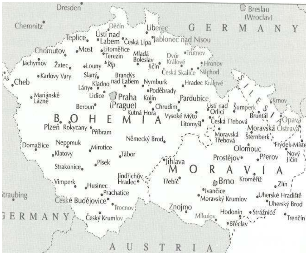
Figur 2 Tsjekkoslovakia mellom 1918 og 1938, utsnitt