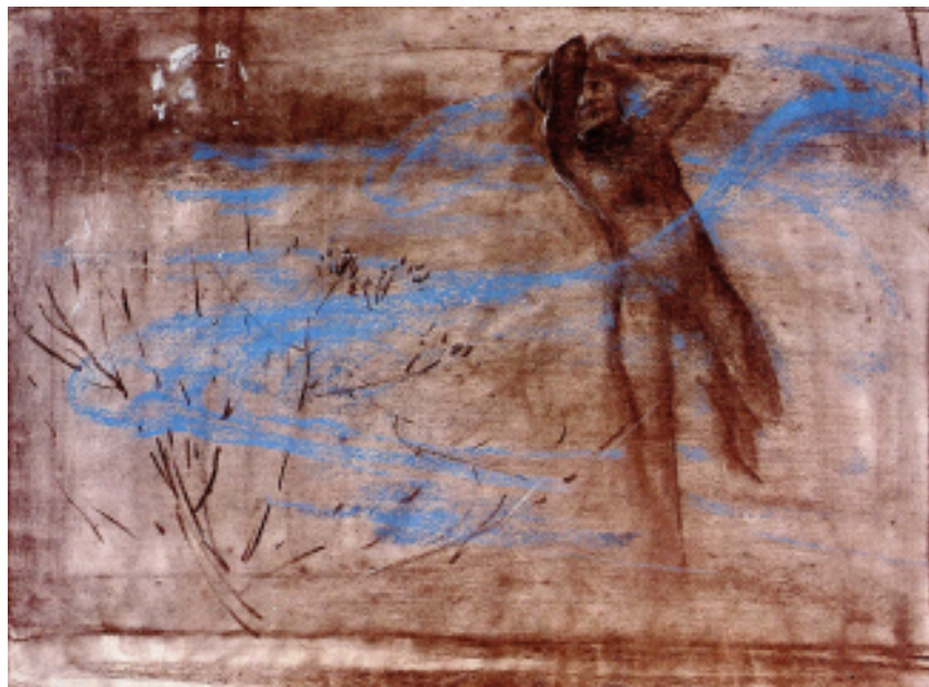
Figur 4 Alfons Mucha Figur i landskap 1897 pastellteikning, 43 x 59 cm