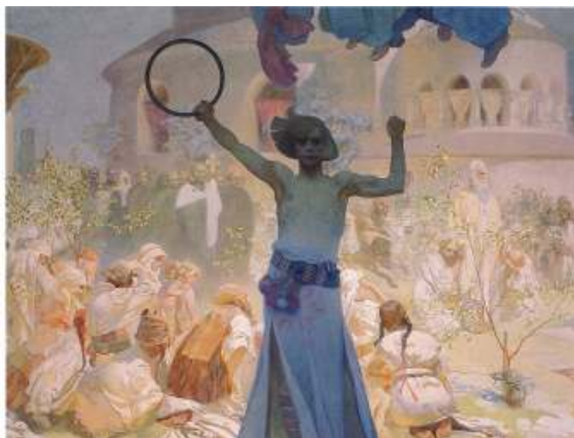
Figur 8 Detalj av Introduksjon av den slaviske liturgien