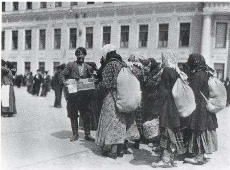
Figur 30 Alfons Mucha, fotografi frå turen til Russland, 1913