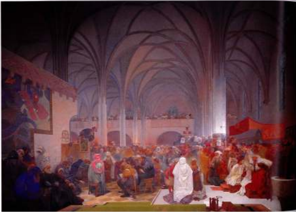
Figur 14 Alfons Mucha Jan Hus sin siste seremoni i Betlehemskapellet 1916 eggtempera på lerret, 610 x 810 cm