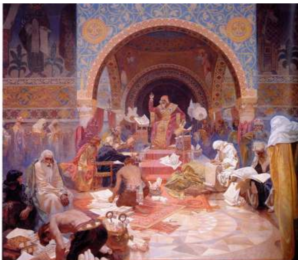
Figur 9 Alfons Mucha Simeon, den bulgarske tsaren 1923 eggtempera på lerret, 405 x 480 cm