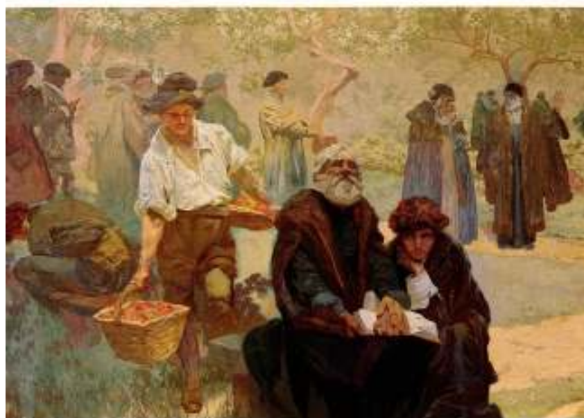
Figur 22 Detalj av Trykking av Kralice-Bibelen i Ivancice