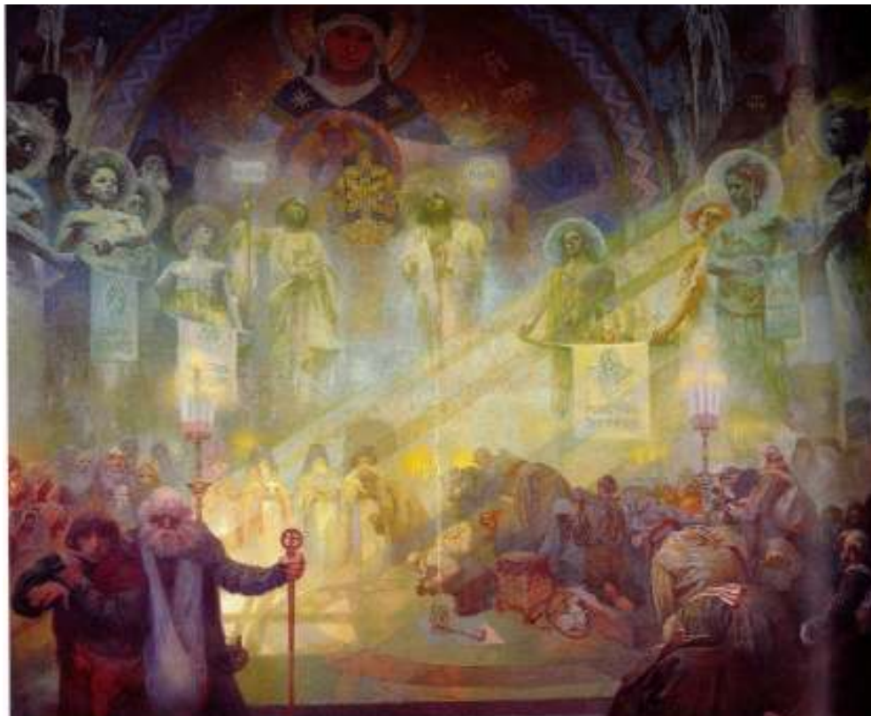
Figur 24 Alfons Mucha Mont Athos – det heilage fjellet 1926 eggtempera på lerret, 405 x 480 cm