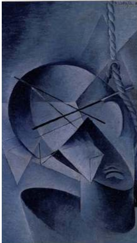
Figur 40 Bohumil Kubista Den hengde mannen 1915 olje på lerret