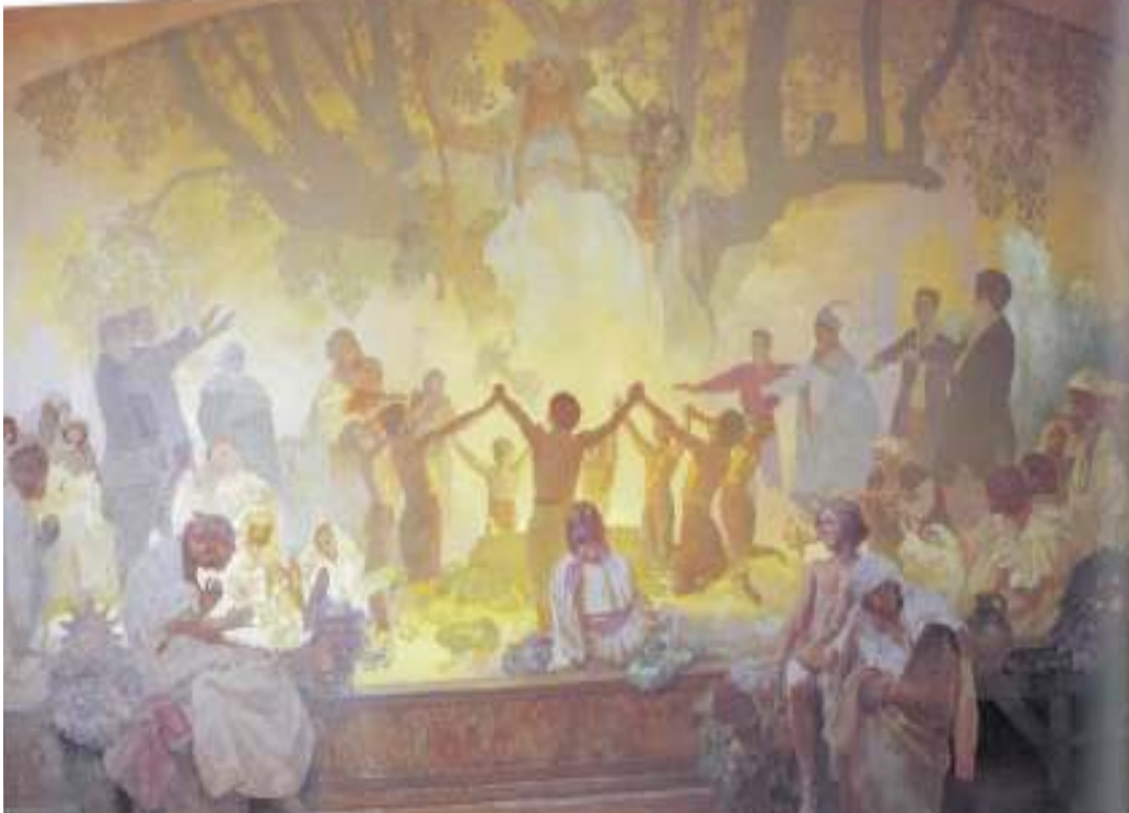
Figur 25 Alfons Mucha Dei unge tek eid under det slaviske lindetreet 1926 eggtempera og olje på lerret, 480 x 405 cm