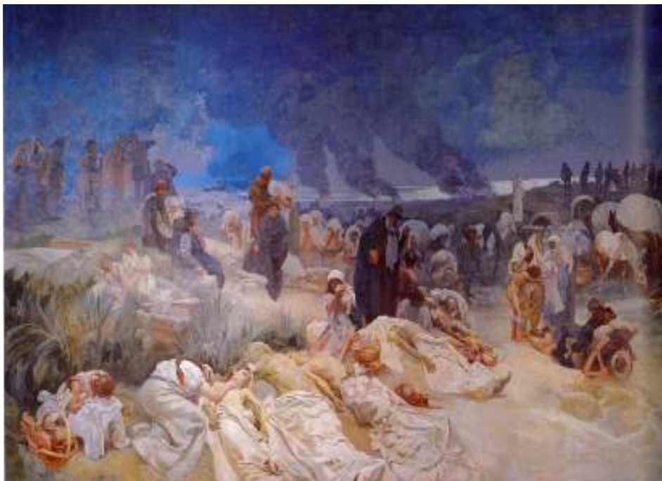
Figur 18 Alfons Mucha Petr Chelcicky ved Vodnany 1918 eggtempera på lerret, 405 x 620 cm