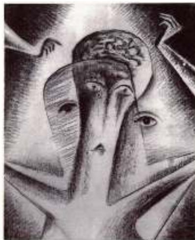
Figur 41 Jan Zrzavy Galning 1918 kullstift på papir