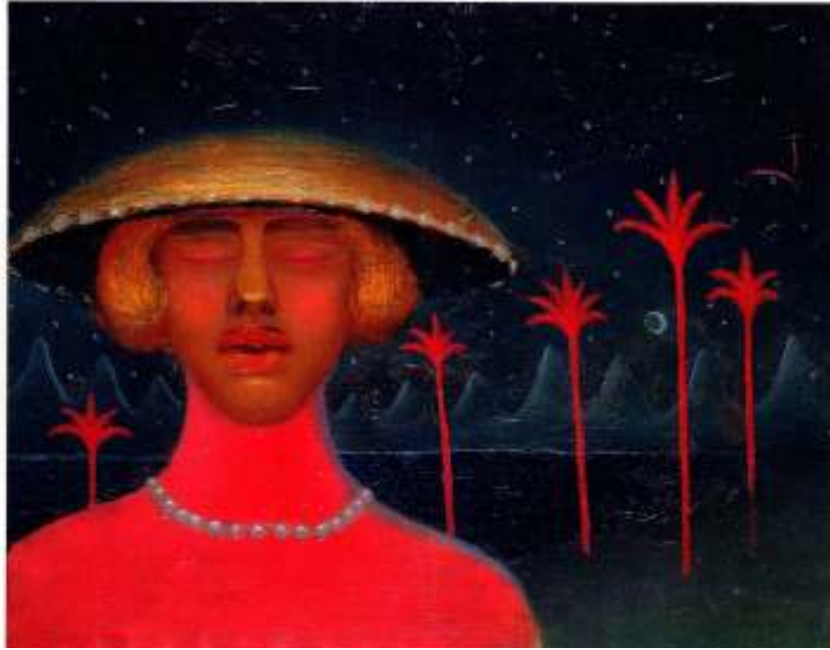
Figur 42 Jan Zrzavy Selvportrett med stråhatt 1907 olje på lerret