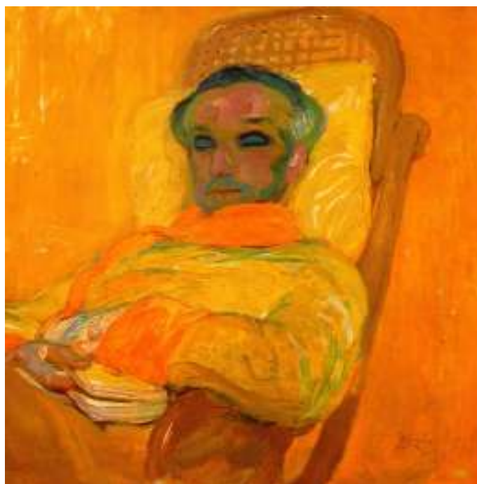
Figur 34 Frantisek Kupka Gult spekter 1907 olje på lerret, 79 x 79 cm