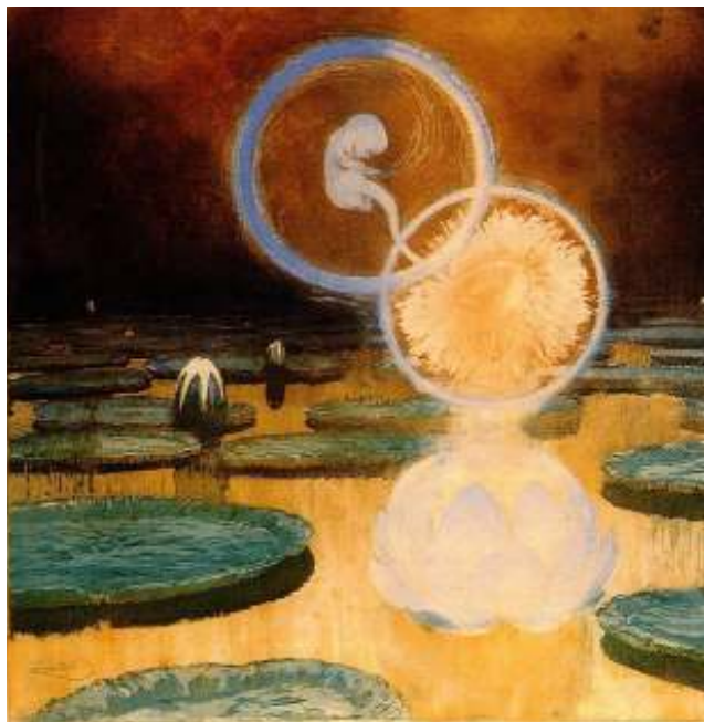
Figur 36 Frantisek Kupka Byrjina av livet 1900-1903 akvatinta på papper, 34.7 x 34.7 cm