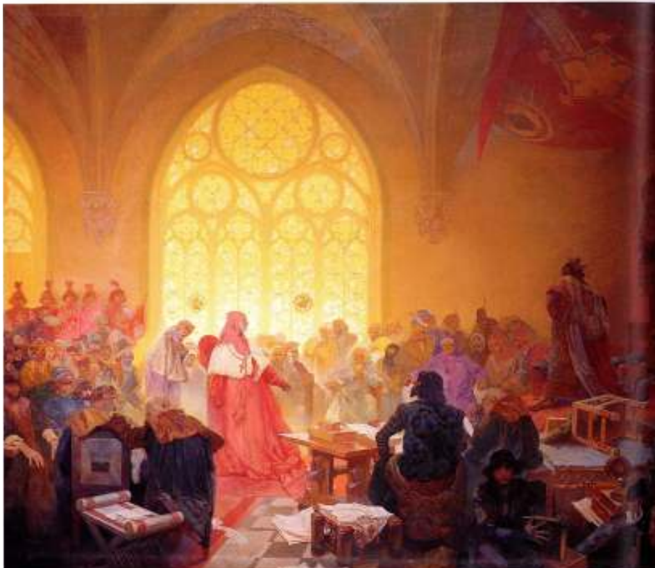
Figur 19 Alfons Mucha Husittkongen Georg av Podebrady 1923 eggtempera og olje på lerret, 405 x 480 cm