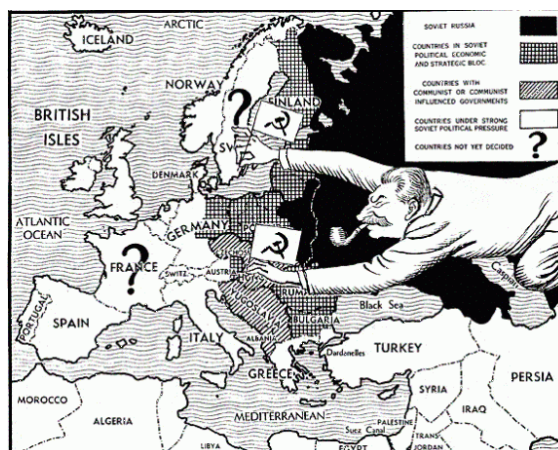
Figur 7 Stalins kommunisme

USA trodde, eller fikk folk til å tro, at Stalins mål var å spre kommunismen. Men ifølge Sovjetunionen tvang Stalin Øst-Europa til å bli kommunistisk for å sikre Sovjetunionen mot en ny invasjon fra vesten 6