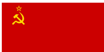
Figur 1 Sovjetunionens flagg