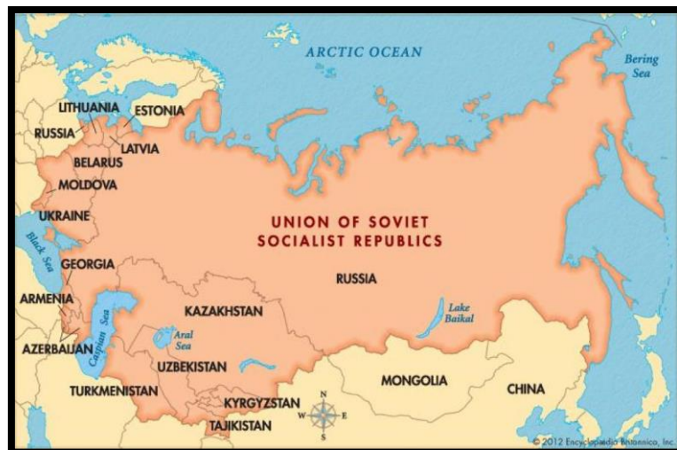
Figur 2 Kart over Sovjetunionen