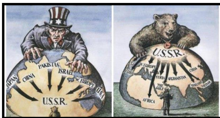
Figur 11 USA vs. Sovjetunionen.

Reagans periode som president i USA startet med fokus på realismen, men den endret seg de siste årene av hans periode, spesielt ift. forholdet med Sovjetunionen. Fra å anse Sovjetunionen og dens ledelse som det onde land til å bli Gorbatsjovs største fan var en utrolig forandring. Reagan (og senere Bush) betraktet Gorbatsjov som en positiv statsmann hvis reformer var like velkomne som de var nødvendige (Ambrose 1993 s. 367)