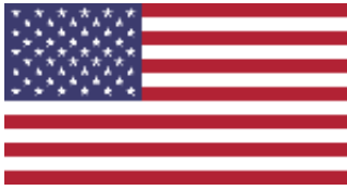
Figur 4USAs flagg