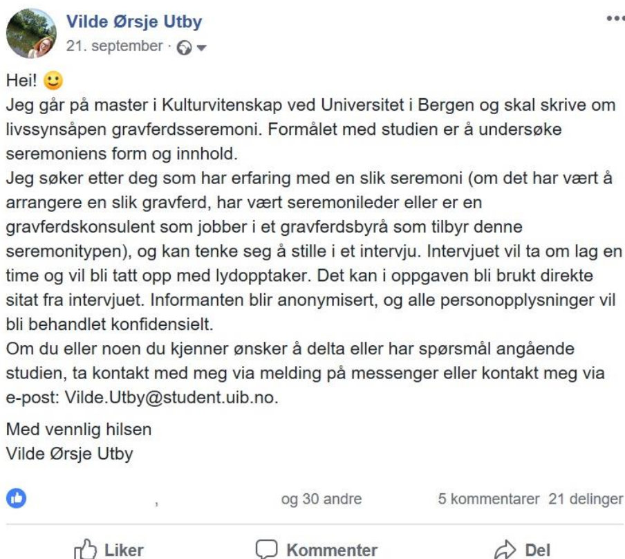
Bilde 1: Skjermdump av Facebook-innlegg for å rekruttere informanter.

En annen fremgangsmåte var å gå igjennom venner og bekjente, noe jeg gjorde både via internett og utenfor internett. Familien min snakket om studien med sine venner og bekjente. De formidlet ikke en direkte oppfordring til å delta, allikevel ytre én person ønske om å stille som informant. Etter dette intervjuet ønsket jeg å undersøke om det var flere bekjente av mine venner som kunne tenkte seg å delta. 21. september 2018 la jeg ut et innlegg på min private Facebook-profil, der jeg etterlyste informanter til studien. Mange av personene i mitt nettverk på Facebook er på min egen alder, noe som gjør at det er lett å trekke en slutning om at de har lite erfaring med denne seremonitypen eller gravferd generelt. Derfor var jeg avhengig av at mine Facebook-venner delte innlegget, slik at det kunne bli sett av flere aldersgrupper og miljøer. Nedenfor følger teksten jeg la ut på Facebook: