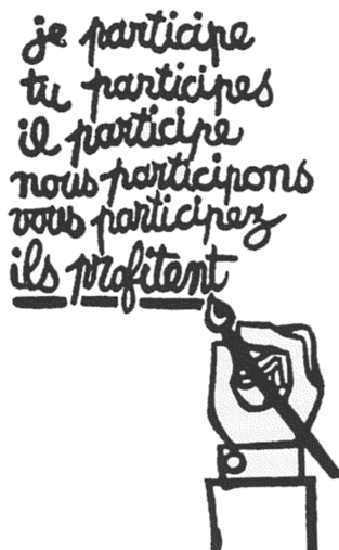
Figur 1. Fransk studentplakat (Arnstein, 1969)

Dei øvste trinna innehelg derimot ulike former for innbyggjarmakt, der ein har reell innverknad på kva og korleis avgjerder vert tatte. Med bakgrunn i dette, endra fokuset i planlegginga seg frå «ovanfrå og ned», gjerne med bakgrunn i statistikk, til å verta meir prosessorienterte. Arnstein (1969) legg fram at ein har sett døme på dei nedste trinna i stigen, men sjeldan eller aldri særleg meir enn dette, då ein stort sett ikkje har hatt ei omfordeling av makt. Dette vert illustrert med ein plakat frå 68-opprøret som seier «eg deltek, du deltek, han deltek, me deltek, de deltek, dei tener » 4 .