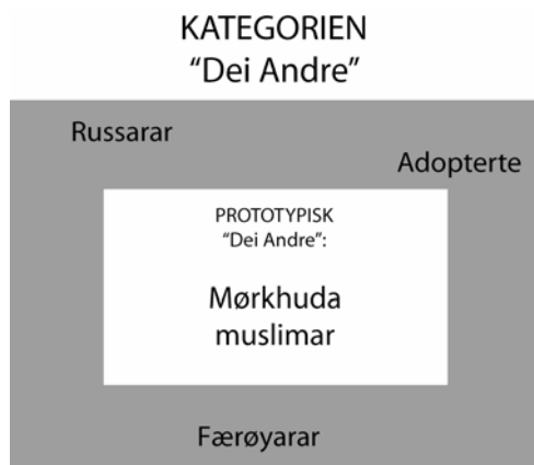
Figur 6.1. Kategorien og prototypen "dei Andre"

Figuren viser at den prototypiske fleirkulturelle er mørkhuda innvandrar og muslim, medan innvandrarar som er lyse i huda og dei som er adopterte er å finna i periferien av kategorien. Gjennom denne kategoriseringa av kven som er "Oss" og kven som er "dei Andre" har ein konstruert eit utgangspunkt for å inkludere og ekskludere (Sibley 1995). Samstundes har ein fylt eit omgrep ("dei Andre") med visse eigenskapar.