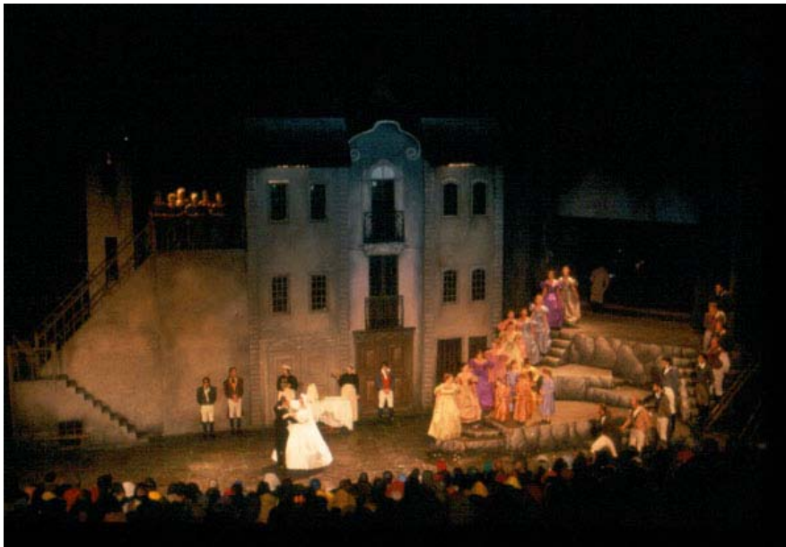
Figur 5.3: Frå oppsetnaden av Les Miserable i Moster Amfi august 2004

”I sommer var eg med på oppsetjinga av ”Les Miserables” i Moster Amfi....., og var blant ca 300 bømlingar som ofra sommaren sin for at andre skulle få noko å sjå på. I Oslo skal dei prøva å setje opp same førestilling sommaren 2005, men eg har høyrte rykter om at dei ikkje får det til, dei har ikkje pengar nok. Med andre ord, dei har ikkje nok folk til å hjelpe, og stille opp. Alle vil ta betalt, slik er det ikkje på Bømlo.” (Stiloppgåve).