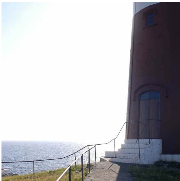
Figur 5.1: Bilete frå Slåtterøy fyr.