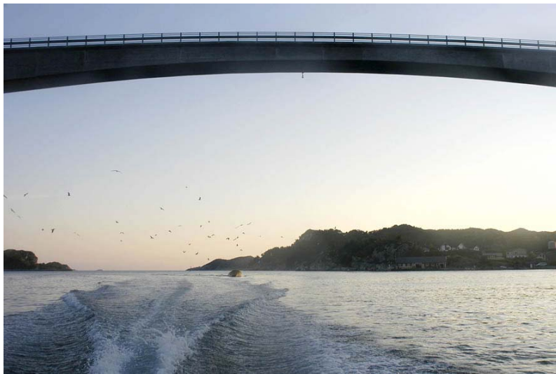
Figur 4.3. Bilete av ei av mange bruer i kommunen.