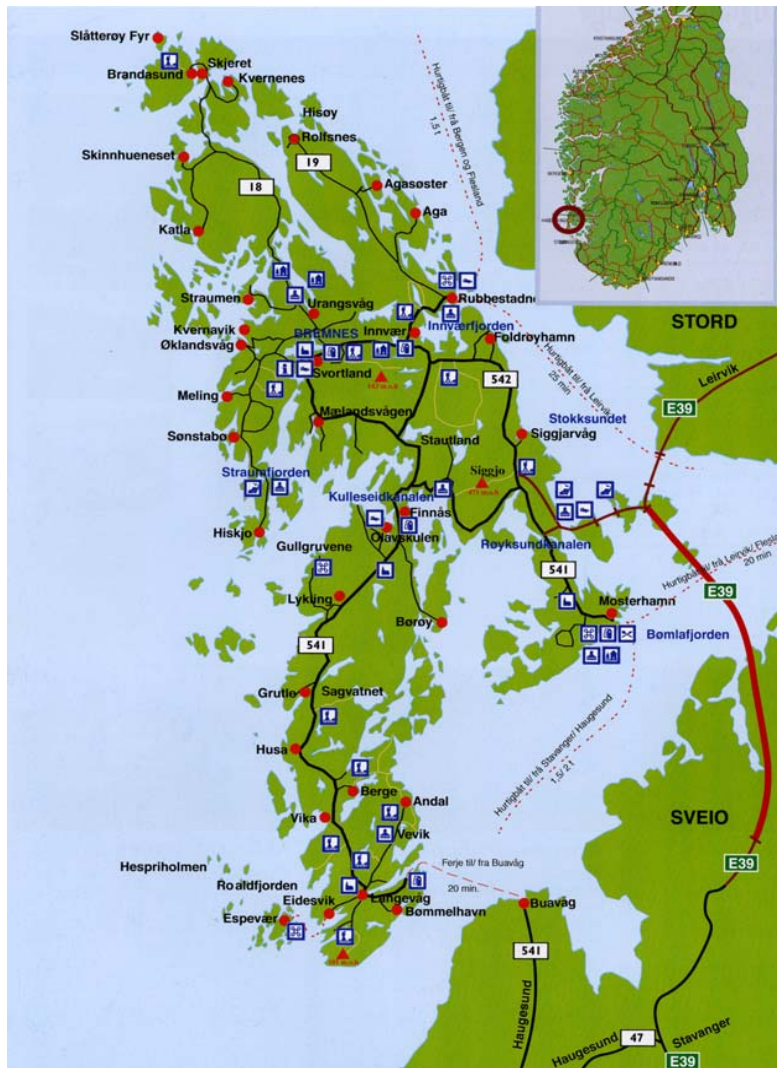
Figur 4.1. Kart over Bømlo

Kommunen har om lag 10800 innbyggjarar. Av tabell 4.1 ser ein at folketallet gjennom fødselsoverskot er positivt, men i forhold til nettoflytting har tala vore varierende positive og negative i frå år til år.