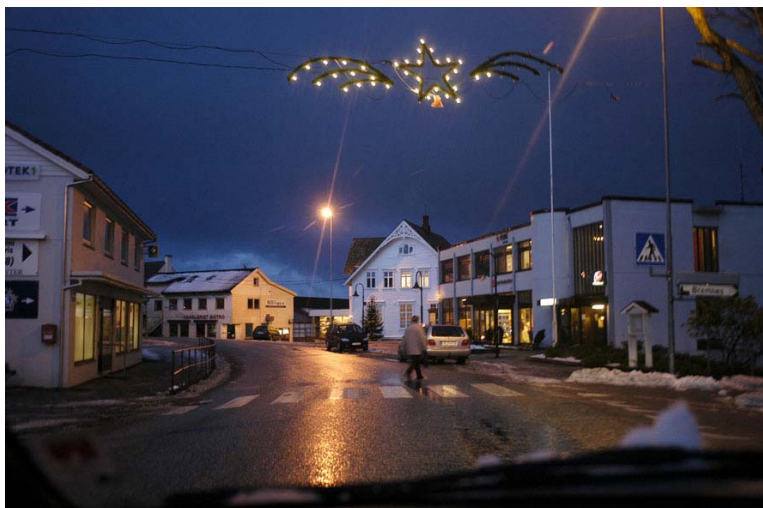
Figur 3.1: Bilete frå Sortland, kommunesentrum på Bømlo.