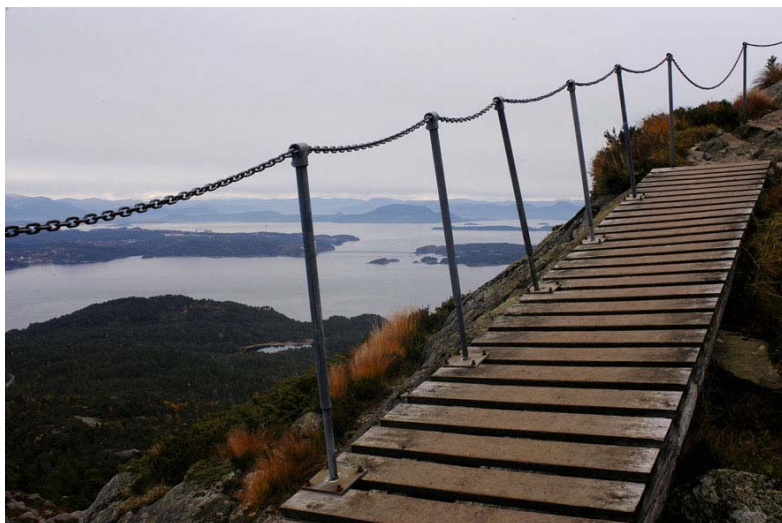
Figur 4.2. Bilete teke frå Siggjo.