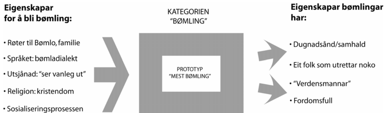
Figur 5.4. Bømlingen

seg ein bømbling på. På den andre sida ser ein eigenskapar ein får i kraft av å bli kalla ein bømbling: