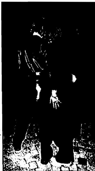
MAFIASØSTRE: - Idealene våre er supermodeller og mafiajenter, sier «Birgitte» og «Cecilie», begge 15 år. Sist uke ble de arrestert for ran.

- Jeg ville ikke være med. Jeg syntes det gikk over grensa, mener «Birgitte» som likevel måtte til politiavhør.