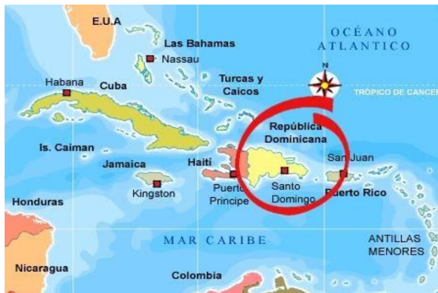
Mapa 1: Del Mar Caribeño, con la localización de República Dominicana.