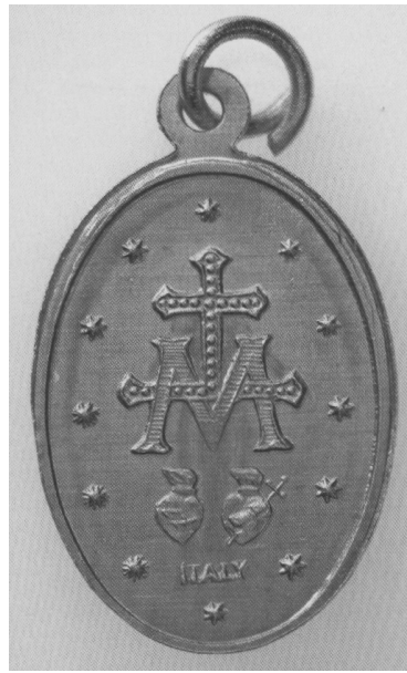
Fig. 10 Den undergjørende Maria-medalje fra 1830, masseprodusert eksemplar fra det 20. århundre, utført i aluminium, oval, 20 x 15 mm. Aversen viser Jomfru Maria, aversen hennes monogram over Jesu og Marias hjerter. Anskaffet til samlingen i 2004.

Når det gjelder katalogiseringen, er det etablert et nasjonalt samarbeidsprosjekt, der landets offentlige samlinger fra 2007 etter hvert blir tilgjengelige på nettet. Arbeidet med digitaliseringen ledes fra Bergen, i nært samarbeid med Norges Bank. Arbeidsdelingen innen Norge har altså ført til at det her i landet er Bergen Museum som satser på medaljer når det gjelder innsamling, forskning og formidling.