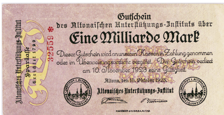
Fig. 6 Tysk inflasjonsseddel, 1 milliard mark, utstedt av understøttelsesinstituttets sparekasse i Altona. På grunn av den galopperende inflasjonen var seddelen bare gyldig i 1 måned, fra 10. oktober til 10. november 1923. Slike sedler er slett ikke sjeldne, de er så vanlige som dødsannonser, men hver eneste