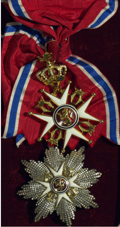
Fig. 1 Statsråd Kristoffer Lehmkuhls storkors av St. Olavs orden som han mottok i 1935. Gitt som testamentarisk gave i 1949.

Selv i perioder der det knapt ble arbeidet med samlingene opphørte virksomheten aldri helt. I slutningen av august 1866 skrev Schive for eksempel til museet og gjorde oppmerksom på at det omtrent en kilometer utenfor Stavanger var gjort et betydelig funn av mynter fra 900-årene, og han mente at museet burde sikre seg dette – hvilket antikvarisk avdelings styre da også straks besluttet seg til. 23 Om arbeidet med myntsamlingen i stadig mindre omfang utgjorde de ansattes hovedinnsats, kom det dog jevnlig inn nye mynter og medaljer til museet.