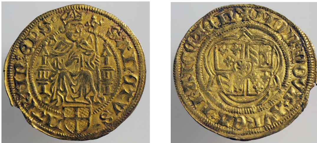
Fig. 3 En nederlandsk gylden, preget av biskop David av Utrecht (1457-96), diam. 23 mm. Mynten stammer fra et funn på Bergenhus av 63 slike gullmynter; en skatt lagt i en liten krukke som ble gravd ned omkring 1490. Forsiden, aversen, har en fremstilling av den hellige biskop Martin av Tours, mens baksiden, reversen, viser biskopens våpenskjold. Innkommet i 1900.