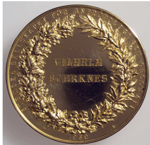
Fig. 2 Det "Svenska sällskapet för antropologi och geografi"s gullmedalje, på 92,5 gr. rent gull, gitt til Vilhelm Bjerknes i 1939. Diam. 56 mm. Gitt som gave til Bergen Museum i 2001.