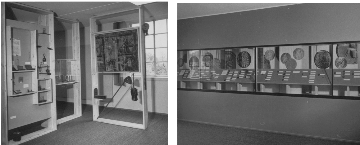
Fig. 8 Fra utstillingen ”Iuno Moneta – betalingsmidler gjennom tidene” på Historisk museum 1963.