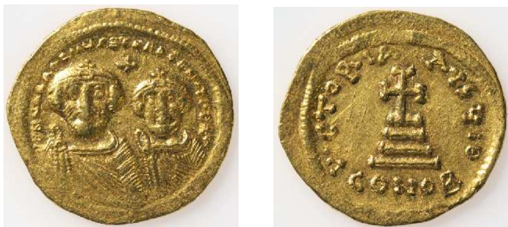
Fig. 4 En solidus, gullmynt preget omkring 615 under kong Herakleios av Bysants. Diam.ca. 20 mm. Aversen viser kongens og hans sønn, mens reversen har en fremstilling av det hellige kors. Innkjøpt i 1996.