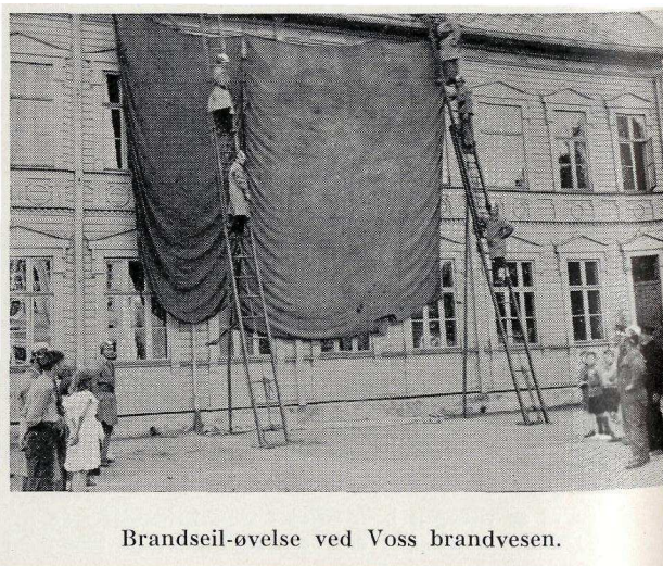
Brandseil-øvelse ved Voss brandvesen.

Brannseil var store presenninger som var sprøytet med vann og som ble hengt opp på husvegger for å hindre flammene i å få tak. Dette var tidligere brannkorpsets beste brannredskap 148 Brannseilet måtte festes med jernkroker til takene, derfor er dette del av det pålagte brannutstyret til Bryggen. Det var også nødvendig å ha stiger for å få hengt opp seilene.