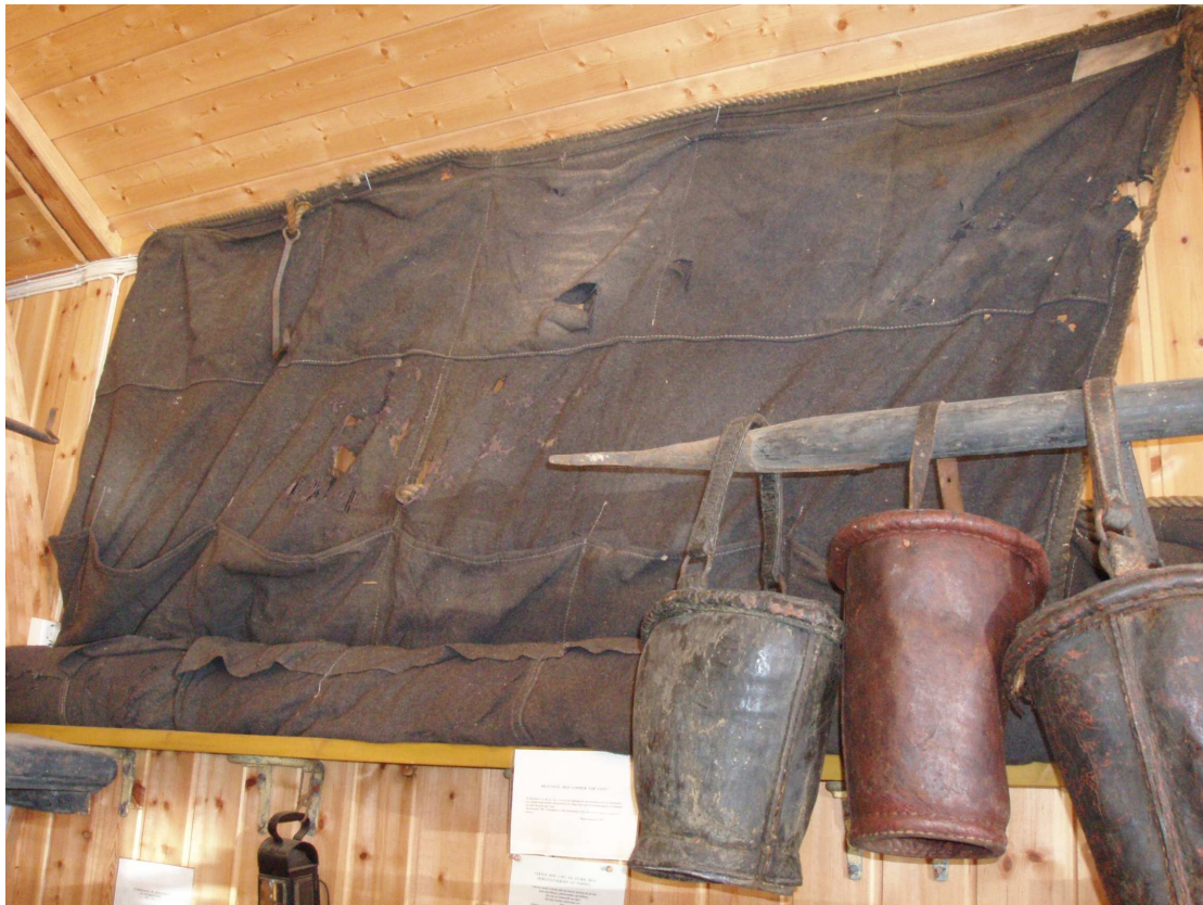
Brannseil og brannbøtter

Brannsprøyte som Kontoret ble pålagt å skaffe til veie var en slangesprøyte. Beskrivelsen av denne brannsprøyten finnes i branddirektørens instruksjer fra katalognummer 781. Det var nemlig branddirektørens ansvar å vedlikeholde brannsprøyten. I instruksene står det at slangesprøyten var 102 fot lang, 149 noe som kunne tilsvare ca. 32 meter. Slangen lå i en kasse som også inneholdt åtte skruer som alltid skulle passe til de stedene de skulle skrues inn. I tillegg var det to kopperrør, som antagelig var til å feste på slangen ytterst nærmest brannstedet. Seilduksstoff ble knyttet fast på slangen for å holde rørene på plass. I tillegg var det et bad med "Canitas"- slange. Det kan tyde på at det dreier seg om et vannkar som skulle stå ved selve pumpekassen til slangesprøyten. En canitas-slange ville så kunne pumpe vann inn i pumpekassen. Pumpekassen bestod av stempelpumper som førte vannet ut i brannslangen. To trestammer var også del av utstyret, og sannsynligvis er det her snakk om to stokker som skulle puttes inn som håndtak oppå pumpekassen for å