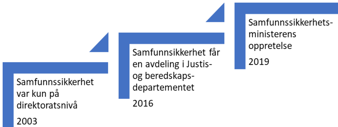
Figur 3: Utviklingen av samfunnssikkerhet i norsk politikk

for krisehåndtering, beredskap og sikkerhet og ble kalt Samfunnssikkerhetsavdelingen (NSD forvaltningsdatabase, u.å 23 ). Innvandringsfagfeltet har et direktorat, men har også like lenge hatt en avdeling i de forskjellige departementene fagfeltet har vært i. Dette er noe som gjør at det kun har blitt flyttet horisontalt og ikke vertikalt i forvaltningen.