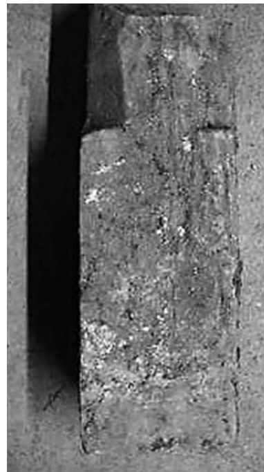
Εικόνα 8: Άτταλη. Οκτάπλευρος κιονίσκος, πεσσίσκος, παραστάδα.