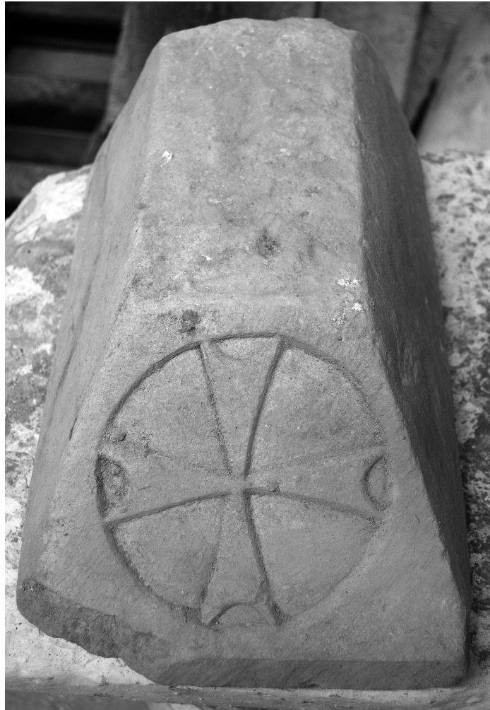
Εικόνα 12: Άτταλη. Επίθημα τρούλου.