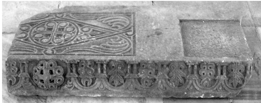
Εικόνα 5: Άτταλη. Τμήμα επιστυλίου.