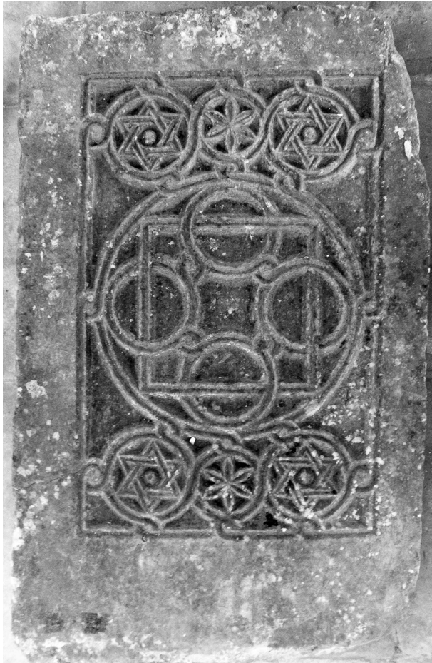
Εικόνα 10: Άτταλη. Θωράκιο στενού διάκενου.