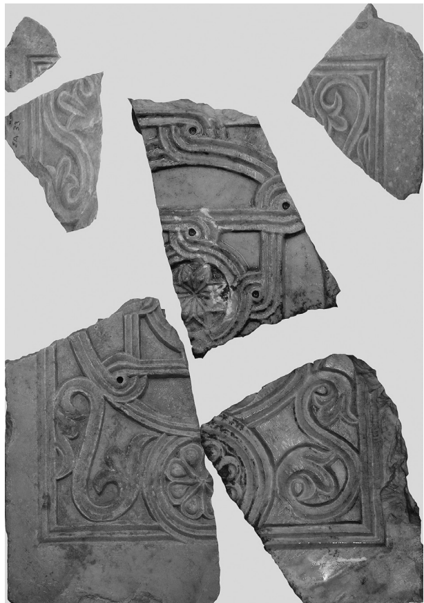
Εικόνα 11: Άτταλη. Αποκατάσταση θωρακίου στενού διάκενου.