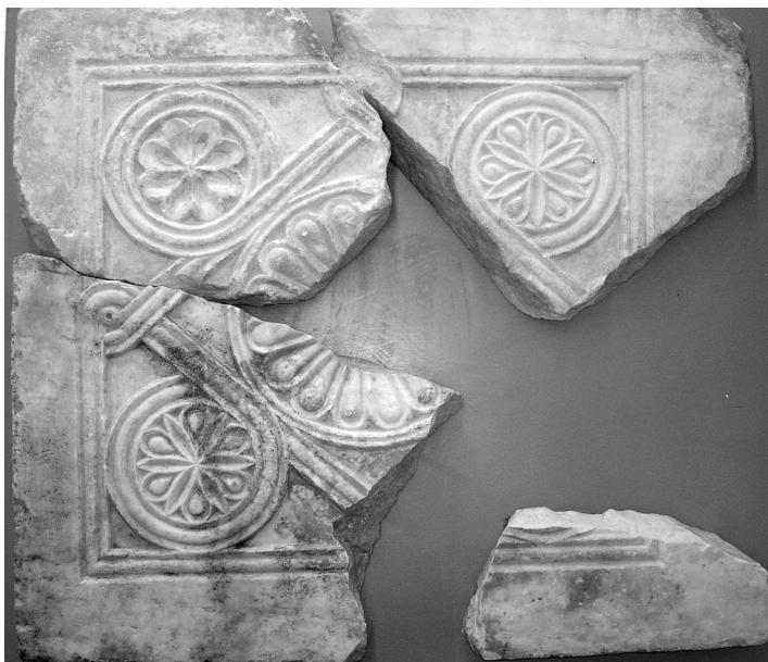
Εικόνα 9: Άτταλη. Αποκατάσταση θωρακίου κεντρικού διάκενου.