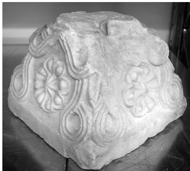
Εικόνα 7: Άτταλη. Κιονόκρανο.