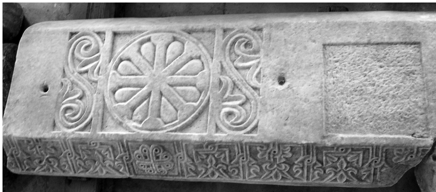
Εικόνα 6: Άτταλη. Τμήμα επιστυλίου.