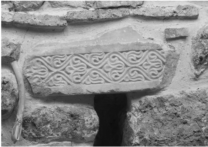
Εικόνα 1: Άτταλη. Τμήμα πεσσίσκου εντοιχισμένου στην κόγχη του ιερού του ναού των Εισοδίων της Θεοτόκου.