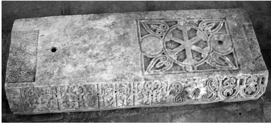
Εικόνα 4: Άτταλη. Τμήμα επιστυλίου.