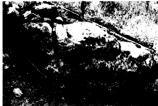
Εικ. 2. Λεπτομέρεια του τείχους της δυτικής πλευράς.