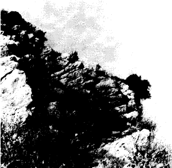
Εικ. 3. Εσωτερικό τείχος.