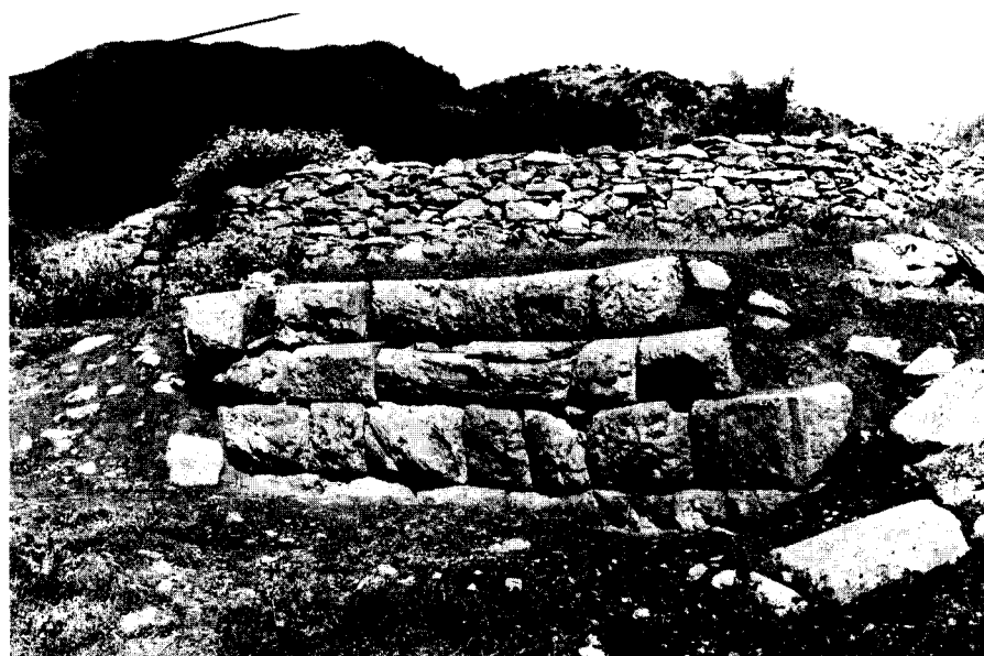
Εικ. 5. Πύργος του Νότιου σκέλους του τείχους στη θέση Παλιομάγανο.