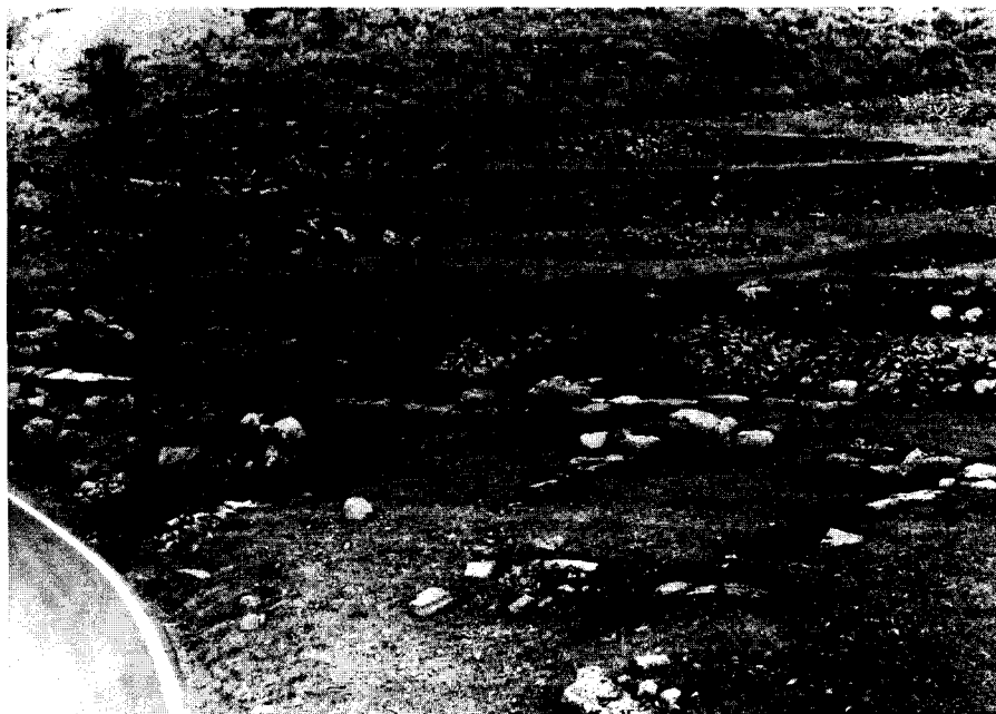
Εικ. 4. Αγ. Ιωάννης. Τμήματα τοίχων, πιθανώς δημόσιων κτηρίων.