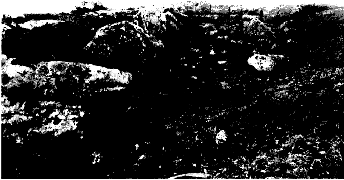
Εικ. 1. Το δυτικό τείχος και τμήμα ορθογώνιου πύρ- γου.