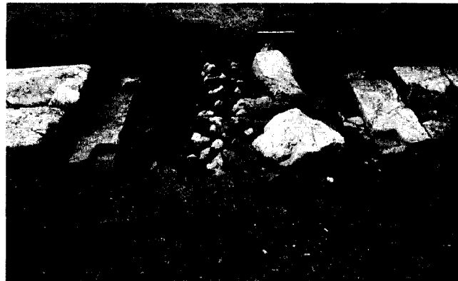
Εικ. 2. Η προς τα έξω εσωτερική θύρα της ΝΔ πύλης.