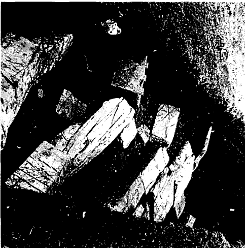
Εικ. 3. Μερική άποψη της έρευνας του θεάτρου.