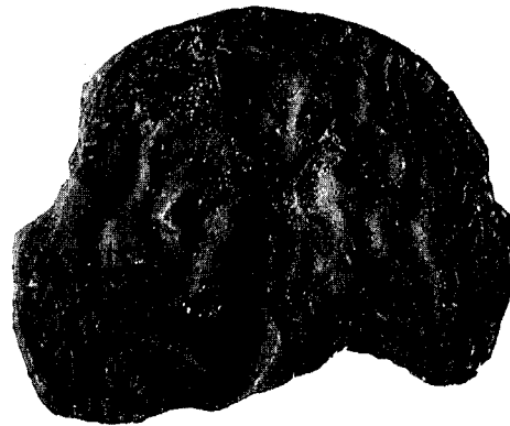
Εικ. 6. Η πήλινη μήτρα με απεικόνιση του ήρωα Αχταίωνα.