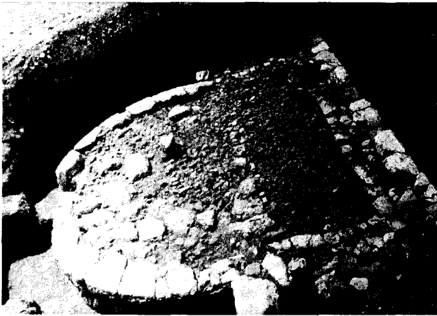
Εικ.1. Κάτοψη του πύργου στην κοίτη του ποταμού Καρνεσίου. (Φωτογρ. ΣΤ΄ ΕΠΚΑ.)