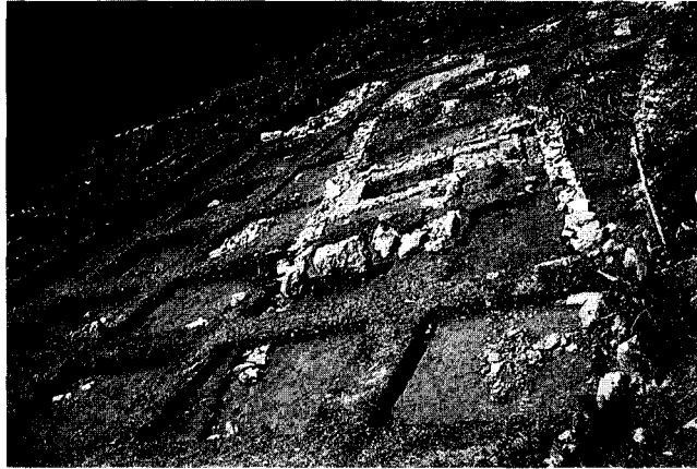
Εικ. 4. Γενική άποψη του αγροτικού συνοικισμού του Αγίου Πέτρου.