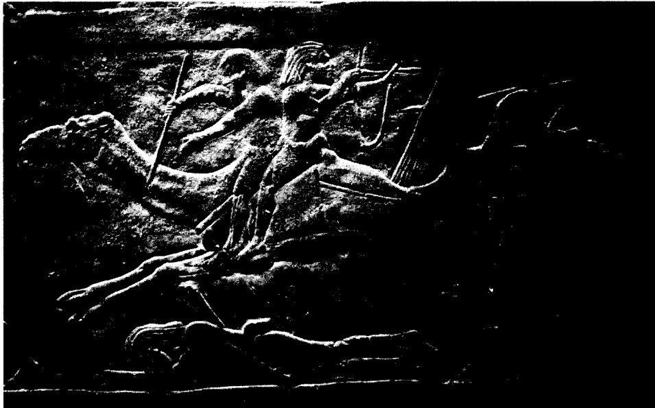
Kamp mod beredne nomader. Frise fra Assurbanipals palads i Ninive, ca. 645 f.Kr.

befolkningen i sit land, opførte templer, reparerede bygninger, gravede vandingskanaler og brønde, plantede plantager, fyldte lagre op med korn, ikke til ære for sig selv, men til guderne (Grayson 1976, § 653). Som et højdepunkt inviterede han 47.074 mænd og kvinder fra sit eget land, sammen med 23.500 udsendinge fra sine allierede, til en 10 dages fest i sit nye palads i Nimrud med en overdådig fortæring, som udpensles i detaljer. Han konkluderede: Således ærede jeg dem, og sendte dem tilbage med fred og glæde (Grayson 1976, § 682). Kong Assurbanipal oprettede i Ninive et omfattende videnskabeligt bibliotek med over 1500 enkeltværker. Krig var heller ikke det eneste middel til at opnå sine mål. Ca. 660 f. Kr. spurgte kong Assurbanipal solguden Shamash: Jeg spørger dig, Shamash, mægtige herre, om Nabu-sharru-usur, chef-eunukken, og mændene, hestene og kong Assurbanipals, hær, som står til hans rådighed, skal generobre de forter, som mannaerne har erobret, eller om han ved krig, venskab og fredelige forhandlinger, eller ved en eller anden list, skal generobre disse forter (Starr 1990, 244-250).