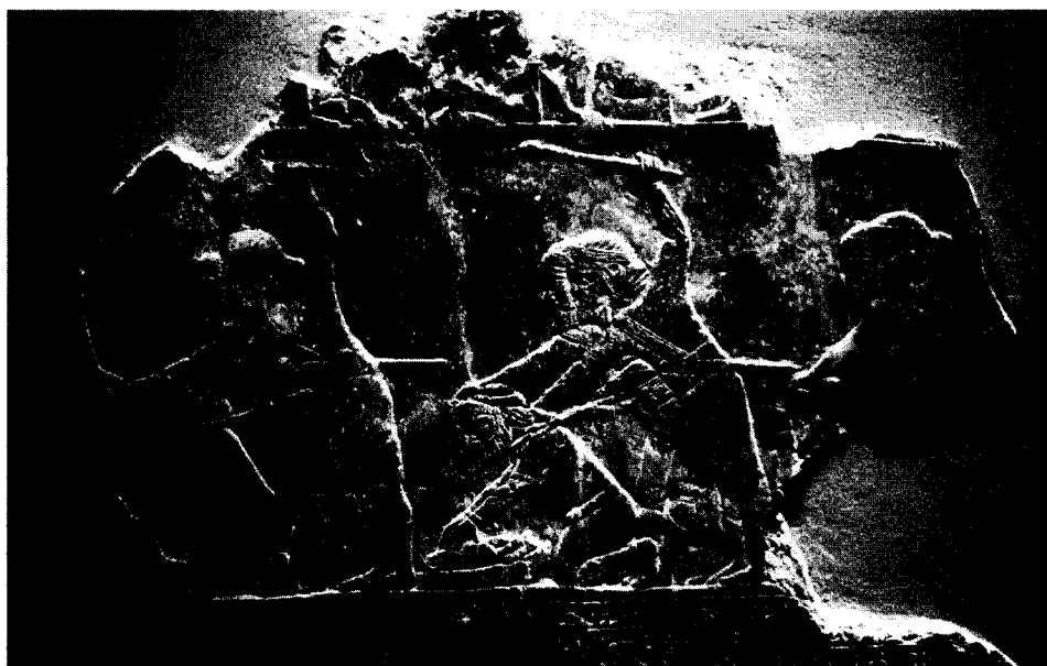
Slagne elamittiske fjender tvinges til at male deres forfædres ben til mel. Uddrag af stort relief fra Assurbanipals palads i Ninive, ca. 660-650 f.Kr.

Kongens mere private gemakker var dekoreret med jagtrelieffer med forkærlighed for løvejagt. I det indre hof dominerede relieffer som viste de sejrige assyriske felttog, kongen som guden Assurs tro tjener og kongen som den retfærdige dommer. I modtagelsesfløjen er udvalget et andet ved siden af de militære triumfer. Her fremstilles den skæbne, der venter utro vasaller gennem udsøgte scener med henrettelser og tortur. Det er tydeligt, at de beregnet for ambassadører, gesandter og vasaller, som ventede på audiens hos kongen. Den for os sadistiske og helt nedværdigende behandling af modstandere var tydeligvis her ikke en del af vilkårlig og tilfældig voldsbrug, men et utvetydigt budskab til de besøgende om utro undersåtters og allieredes skæbne.