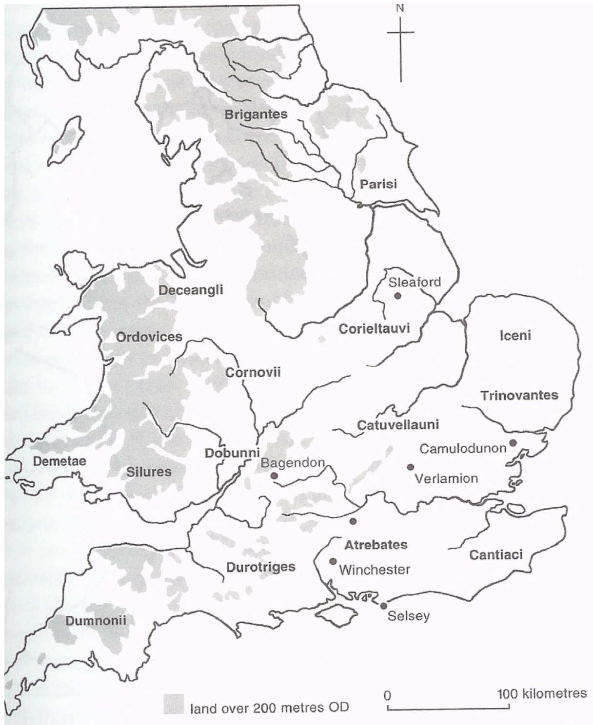
Oversikt over keltiske stammer i Britannia. Bildet er hentet fra Hingley, Richard og Christina Unwin. Boudica: Iron Age Warrior Queen . London: Hambledon and London, 2005 (s. 13).