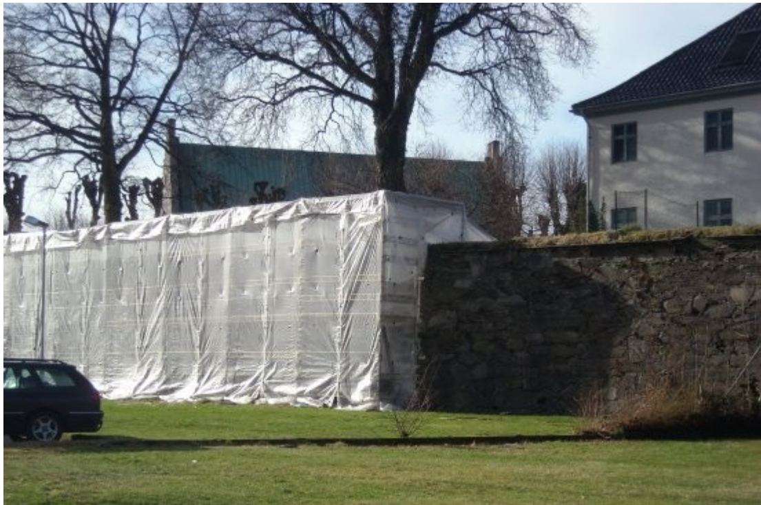
Eksempel på restaurering av festningsmurer etter gamle prinsipper og løsninger, ett tidkrevende og grundig arbeid.

med ned til beplanting. På mange måter representerer den derfor et kraftig brudd med tidligere tiders syn på området.