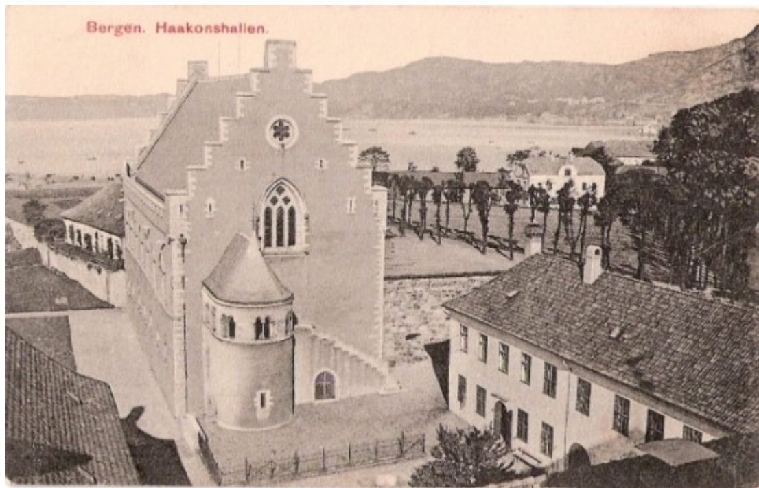
Bildet viser den ferdig restaurerte Håkonshallen, fra å være en tilnærmet anonym lagerhall har den fått en mer synlig dominerende stilling i festninsområdet. Gammelt postkort.