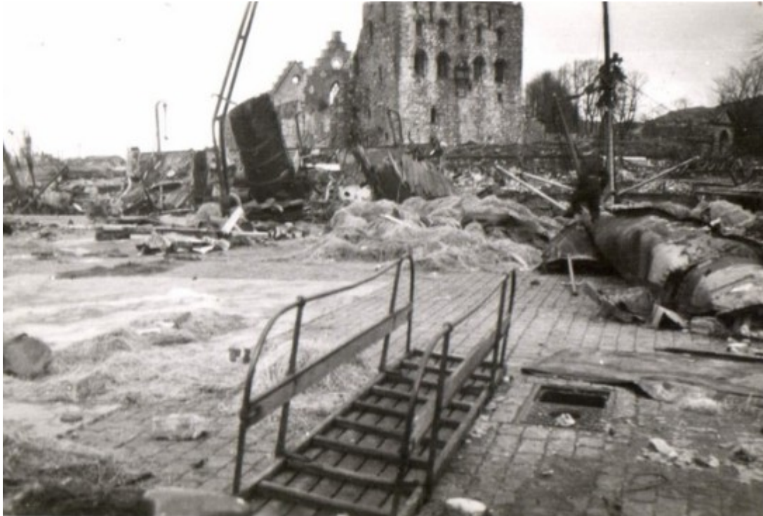
To fotografier tatt ved Bradbenken som viser de omfattende skadene på Rosenkrantzårnet og Håkonshallen etter eksplosjonsulykken 20.april 1944. Begge bildene stammer fra en ukjent tysk soldat som var stasjonert i Bergen .