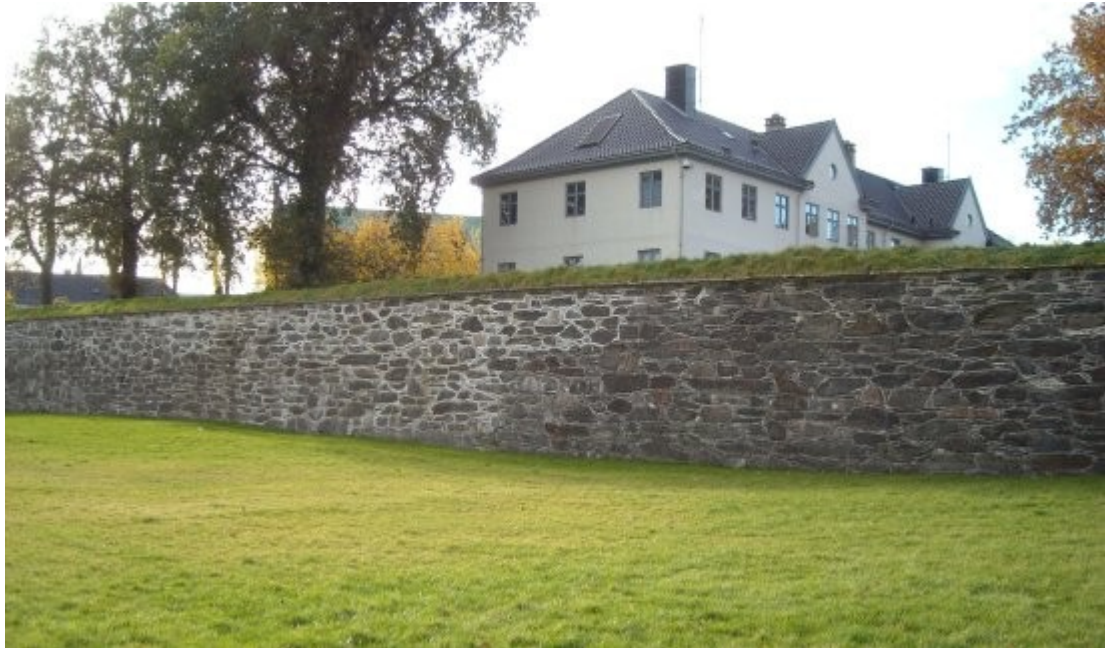
Bildet viser det nyrestaurerte partiet som vist under presentering på S.64..

Inntrykket man får av dette er at helheten fastsettes som veldig viktig, det nasjonale og historiske trekkes også fram for å påvise stedets unikhhet og for å legitimere formålet.