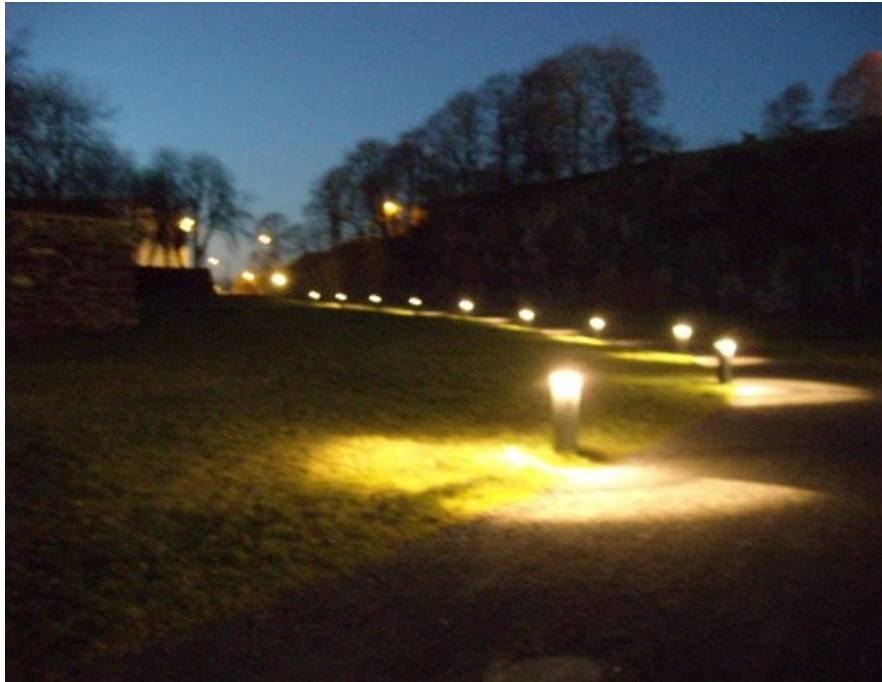
Bildet viser en nyoppført lysløype over Koengen bak festningen som del av en "revitalisering" av dette området som tidligere var preget av asfalterte parkeringsplasser.

moderne former. Festningen kan derfor karakteriseres som en kulturell arena på historisk grunn og danner dermed bakteppet for en rekke tilstelninger, opplevelser og aktiviteter, både i nåtid og etter alt å dømme også i framtiden.