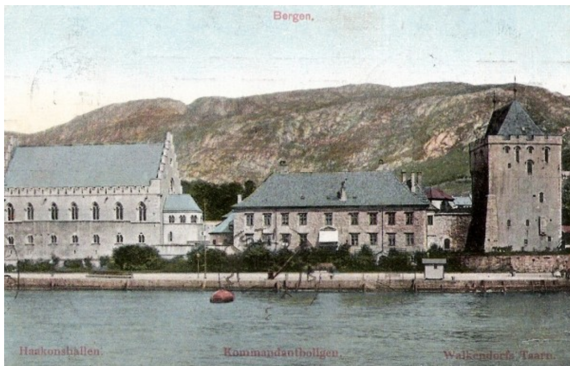
Bildet viser den ferdigrestaurerte Håkonshallen og Rosenkrantzstårnet rundt 1910. Kolorert postkort.

Ut i fra dette kan man kanskje si at kulturminnevernet i en viss form hadde modnet i forhold til tidligere. Debatt var det ingen mangel på, men visse syn hadde fått overtaket og kursen er synlig mer ensrettet enn tidligere. Man kan derfor snakke om at pionerfasen innenfor kulturminnevernet på dette tidspunktet gikk mot slutten. De store stridighetene mellom den begrensede gruppen arkitekter og vitenskapsmenn gikk i større grad mot sin naturlige slutt.