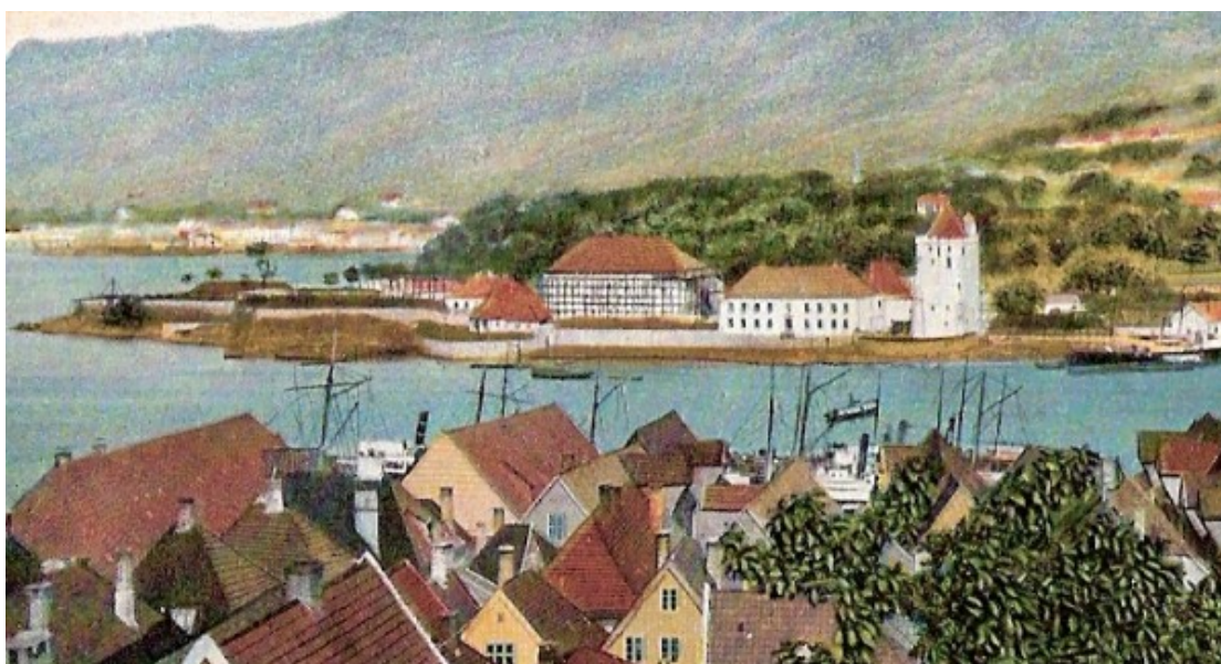
Bergehus Festning sett fra Nordnes mot slutten av 1800-tallet. Det er mulig å se ett stillas reist rundt selve Håkonshallen, noe som tyder på at vi her kan se dokumentasjon på hvordan restaureringsarbeidet så ut sett ifra resten av byen. Bildet er ett utsnitt som stammer fra ett kolorert postkort utgitt i USA og trykket i Tyskland, sannsynligvis mot slutten av 1880-årene.

Ut ifra kildene var oppmålingen et langsomt og møysommelig arbeid som gikk over flere år, hvor Blix ga grundige rapporter fra sitt arbeid. Helt uten problemer var det riktignok ikke, da arbeidet skulle starte etter vinteren i 1883 hadde det oppstått splid mellom Blix og styret i Fortidsforeningen i Bergen. 50