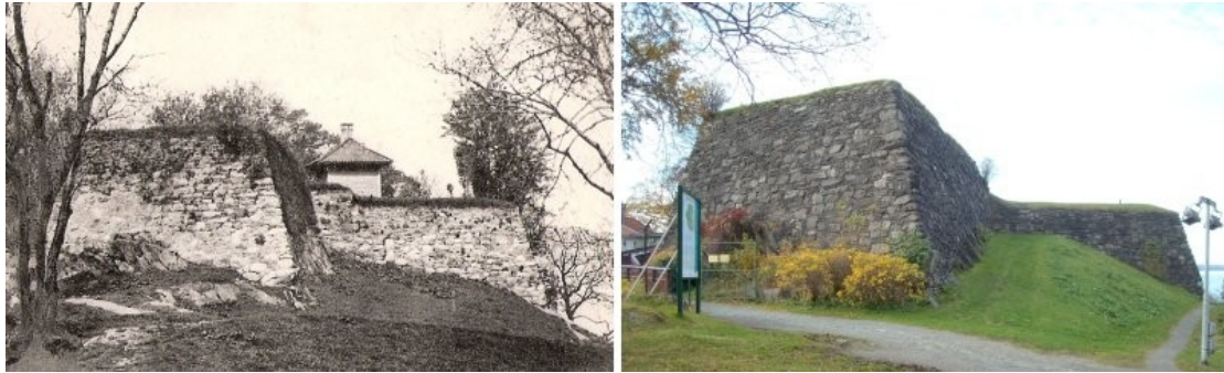
Bildene viser Sverresborg, fra ett ca.100 år gammelt postkort til venstre, til høyre et bilde tatt i senere tid. Man kan her også se plasseringen på en av de ny informasjonstavlene..