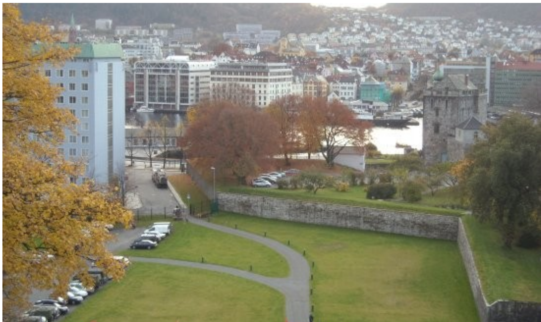
Koengen sett fra Sverresborg, man kan her se hvor nært hotellet er plassert selve festningen.

Både foran og bak festningen ble det på 1950- og 1960-tallet bygget høye bygninger, et høyt og stort fiskeindustribygg på havnesiden, mens Orion Hotell sprang opp på bysiden. Litleskare gir selv følgende karakteristikkk på dette: “ødeleggelsen av