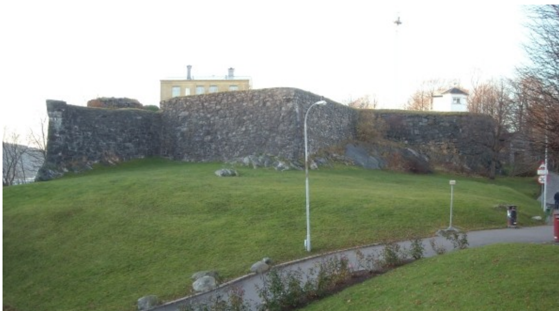
Fredriksberg Fort slik det ser ut på nåværende tidspunkt. På sommerstid er marken foran fortet ett yndet tilholdssted for utflukter og solbad.

Fredriksberg fort ble overtatt av kommunen i 1897 og fungerte i lengre tid som tilholdssted for deler av brannvesenet da den på grunn av sin høye og skjermede beliggenhet fungerte godt som utkikspost og brannvakt. I senere tid har en meteorologisk stasjon og buekorpset Nordnes Bataljon overtatt for dette. Hæren gjorde riktignok et lite og midlertidig inntog på området igjen under første verdenskrig, da et luftvernatteri ble etablert der, igjen som følge av fortets høye beliggenhet.