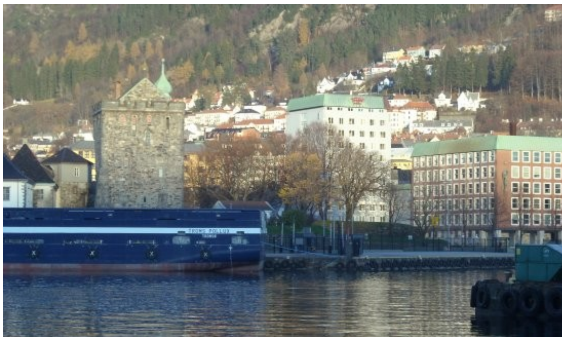
Bildet viser Rosenkrantzårnets "konkurent", nåværende Thon Hotell Bergen Brygge.