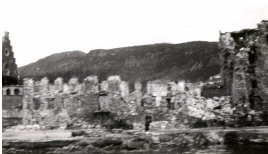
Ett noe uskarpt foto som viser kommandantboligen og deler av Rosenkrantzårnet etter ulykken sett ifra Vågen. Ammunisjonsskipet lå fortøyd rett foran kommandantboligen hvor det også er mulig å se store skader på selve kaaien.

Resultatet av eksplosjonen var omfattende skader på de fleste bygningene rundt Vågen, samt i varierende grad på resten av Sentrum, men hardest rammet av alle ble Bergenhus Festning. På Håkonshallen forsvant hele taket og det meste av bygget ble utbrent innvendig. Rosenkrantzårnet raste delvis ut på siden som vendte mot Vågen og taket ble ødelagt. Aandre bygg som Kommandantboligen og Stallbygningen ble nesten fullstendig ødelagt og utbrent.