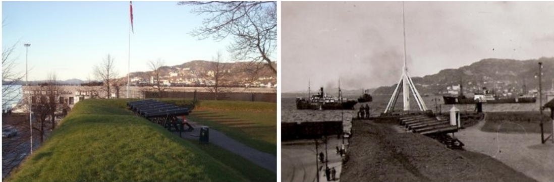
Bildet til venstre viser utsikten fra festningen mot Byfjorden/Sandviken og hvordan havnelagrene dekker til festningen i denne retningen. Bildet til høyre er tatt i 1940 og viser den frie utsikten mot fjorden som dette punktet opprinnelig hadde. Sistnevnte bilde er tatt av en ukjent tysk soldat i 1940.

bebyggelsen.” 89 Ut i fra dette bør det være mulig å trekke paralleller med den tidligere perioden med salg av militære eiendommer. Verneplanen gir klart hentydninger til å være et offisielt dokument som skal hindre enhver form for slike aktiviteter i framtiden og som setter en klar ramme rundt området.