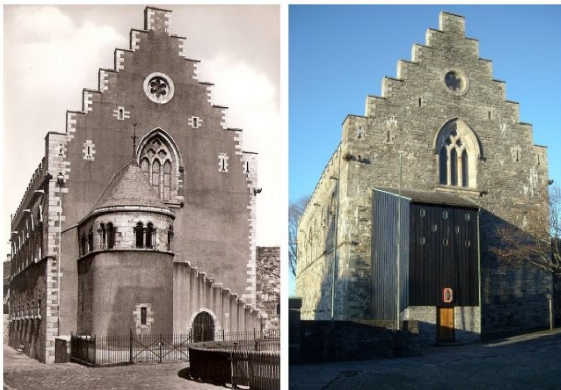
Bildene viser den opprinnelig restaureringen av Håkonshallen til venstre og slik den ble gjenreist etter krigen til høyre. Bildet til venstre er et gammelt postkort.