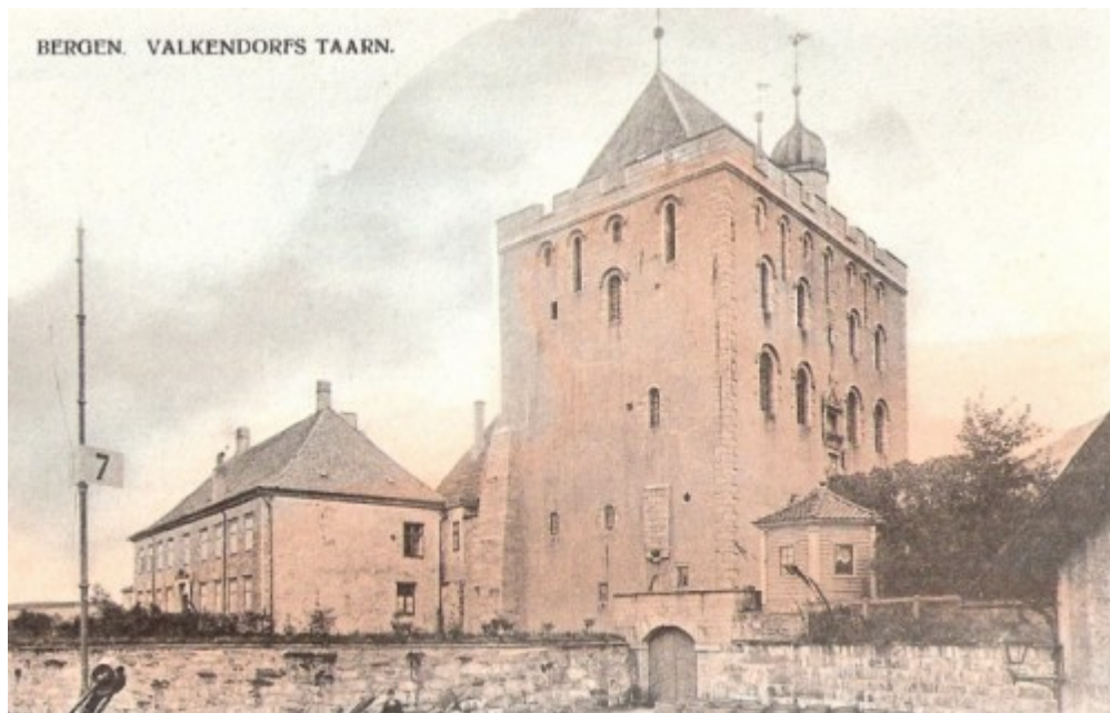
Bildet viser Rosenkrantzårnet mot slutten av 1800-tallet. Ut ifra billedteksten kan man se at tårnet på dette tidspunktet fortsatt gikk under flere navn. Eldre og delvis kolorert postkort.

historiske ekvivalensprinsippet som Myklebust beskriver, der man ser alle historiske perioder som verdifulle, og hvor monumentets skiftende bygningshistorie sees på som bevaringsverdig i seg selv. En tilnærmet tilbakeføring til en spesiell tidsperiode ville sannsynligvis nesten ha vært umulig uten å ødelegge bygget fullstendig. Tildels er dette i tråd med kunsthistorikeren Harry Fetts teorier rundt å unngå favorisering et byggverks eldste stil på bekostning av de senere periodene. Videre kan man da også føye til at byggets historie kanskje bedre vises gjennom å bevare noe slik det er blitt overlevert og ved at de forskjellige epokene og tilføringene kan sees sammen i selve bygget. Dette kan sies i større grad å være i tråd med nyere vernepolitikk og skiller derfor på mange måter Håkonshallen fra Rosenkrantzårnet i restaureringsspørsmålet. Der hvor Håkonshallen ble restaurert tilbake til ett tenkt punkt i middelalderen lot man Rosenkrantzårnet forbli tilnærmet i sin overleverte tilstand. Man har derfor to bygg restaurert på tilnærmet samme tidspunkt men etter vidt forskjellige prinsipper side om side. Ved Rosenkrantzårnet kan man her kanskje også se de første antydninger til at middelalderens grep om kulturminnefeltet begynner å minske som følge av dette.