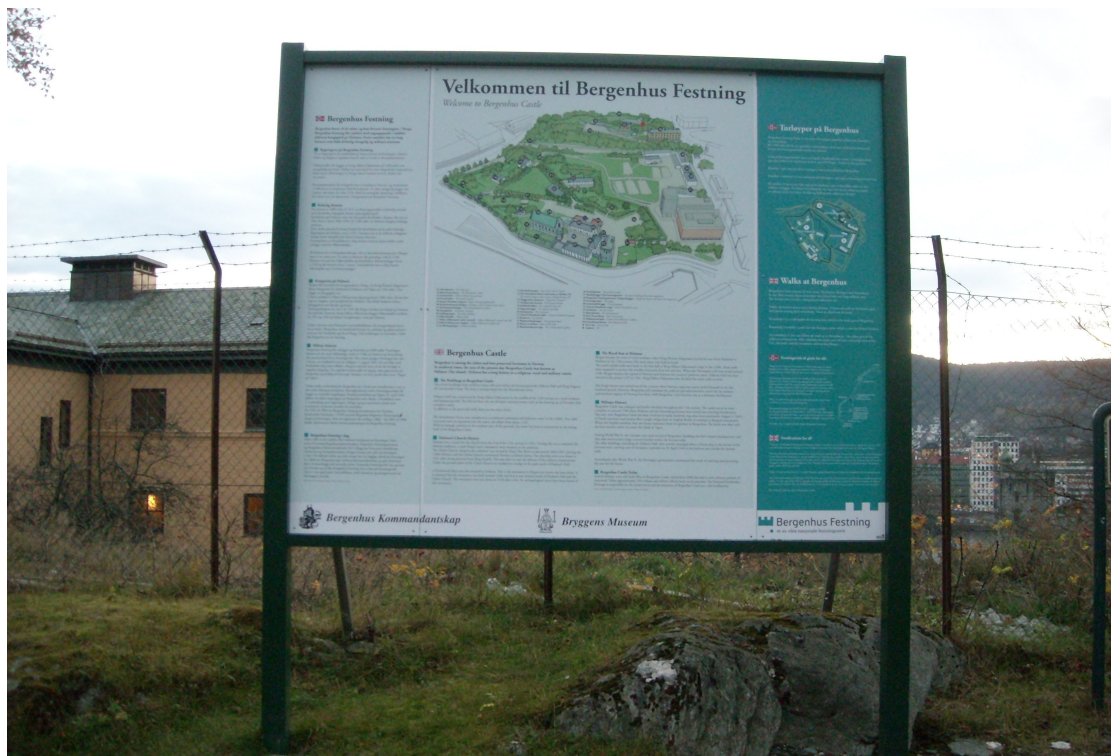
Bildet viser infotavler av den typen som det nå finnes flere av på Bergenhus Festning.

moderne former. Festningen kan derfor karakteriseres som en kulturell arena på historisk grunn og danner dermed bakteppet for en rekke tilstelninger, opplevelser og aktiviteter, både i nåtid og etter alt å dømme også i framtiden.