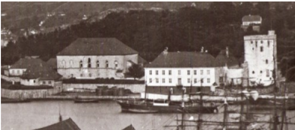
Bildet viser Bergenhus rundt 1870, det er her mulig å se Rosenkrantzårnet uten tak slik det så ut da forsvaret lot seg inspirere av Dahls mening om hvordan det kunne ha sett ut i middelalderen. Det viser også hvordan området så like før restaureringsarbeidet av Håkonshallen tok til. Bildet er ett utsnitt av ett eldre postkort av ukjent datering, men sannsynligvis en senere reproduksjon.

Da Dahl opprinnelig sammen med sitt opprop i 1841 la fram et forslag til hvordan området kunne ha sett ut i middelalderen, regnet han også med det såkalte “Walkendorffs Casteltaarn” som en del den gamle kongsgården og stilte det nesten på samme linje som Håkonshallen. At tårnet nok var i bedre stand og ikke var “dandsesal for Rotter og Muus” som hallen i sin rolle som kornmagasin ble karakterisert som, gjorde nok at det i større grad ble fokusert på hallen siden den trengte mer dyptgående og grundig arbeid.